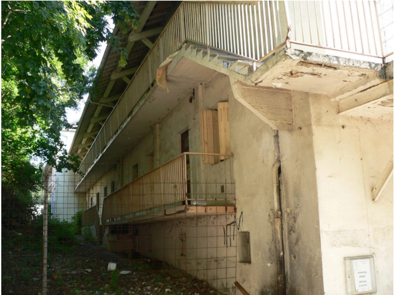
Coursives façade arrière