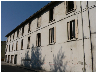
Façade sur rue IVR82_20073800171NUCA