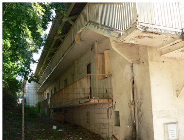
Coursives façade arrière IVR82_20073800172NUCA