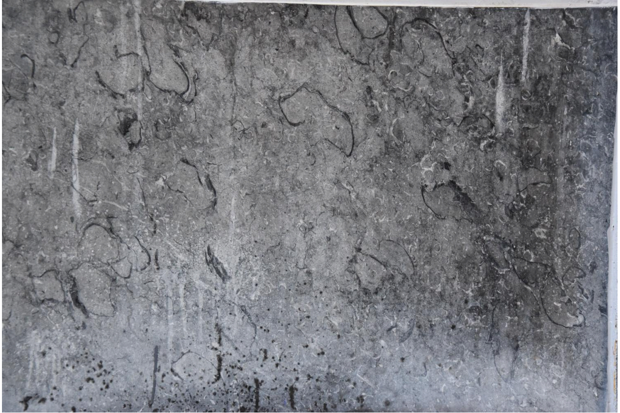
Détail de fossiles : accumulation d'huîtres (bivalves) dans un marbre décoratif (lumachelle de Lourdes), en façade