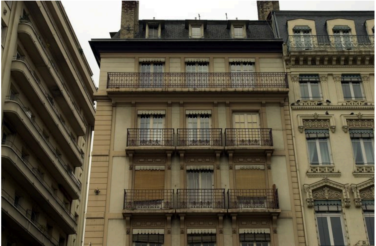
Elévation sur la place des Jacobins : partie supérieure