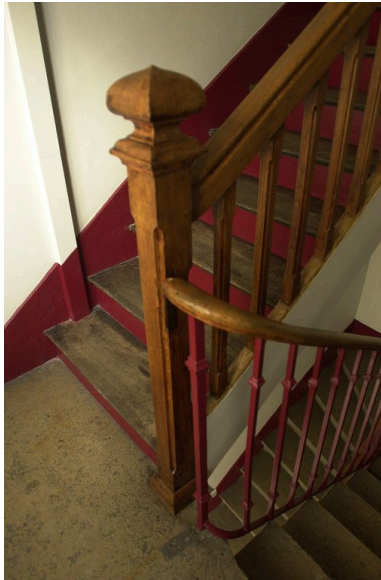
Escalier : garde-corps en fonte et garde-corps en bois