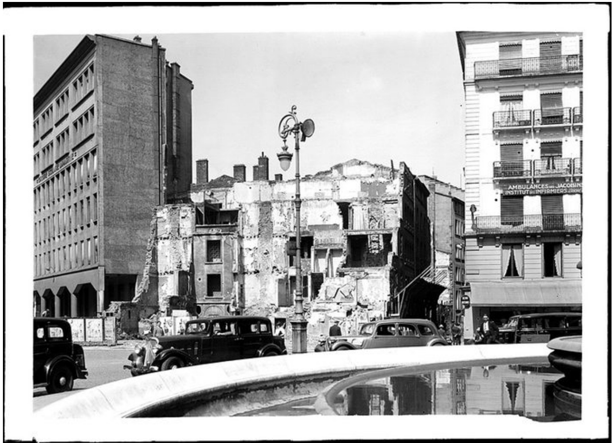
A droite, vue partielle de l'élévation place des Jacobins, 1937. fotogr. Nég. sur verre AM Lyon. 3 Ph 00237