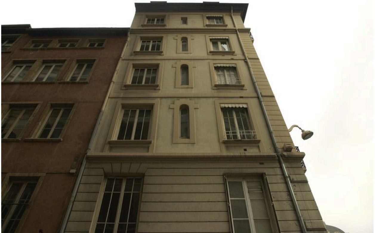
Elévation antérieure, rue du Port-du-Temple : partie supérieure