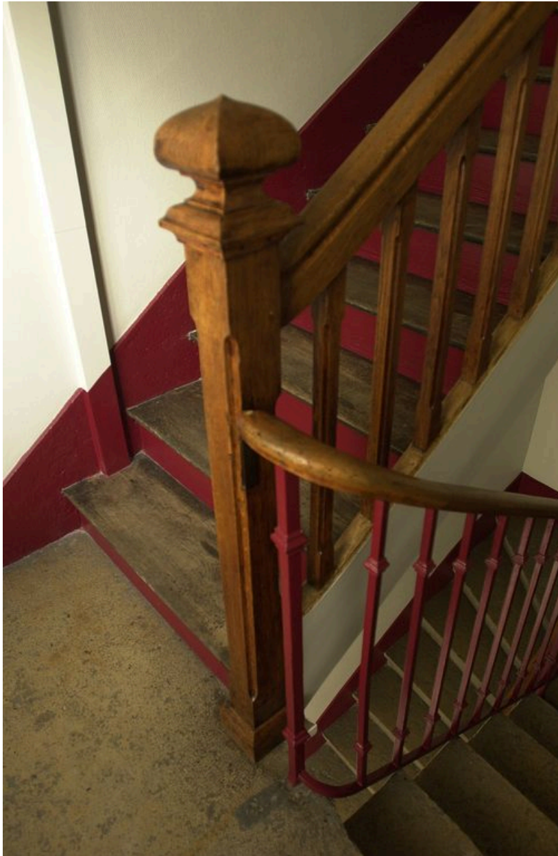
Escalier : garde-corps en fonte et garde-corps en bois