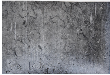
Détail de fossiles : accumulation d'huîtres (bivalves) dans un marbre décoratif (lumachelle de Lourdes), en façade IVR84_20236900515NUCA