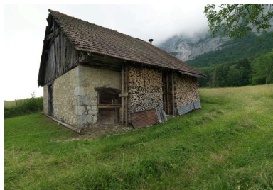
Vue d'ensemble de trois-quarts avant gauche de la ferme IVR82_20157402525NUCAQ