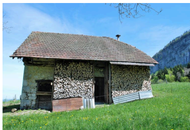
Vue d'ensemble de la façade sud. IVR84_20187400278NUCA