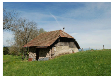
Vue d'ensemble de trois-quarts avant droit. IVR84_20187400279NUCA