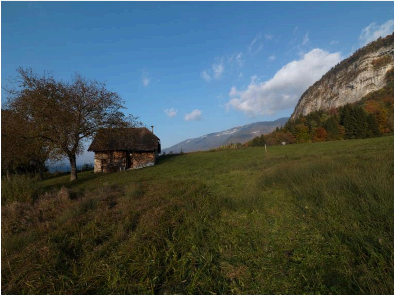
Vue d'ensemble de la ferme dans son site