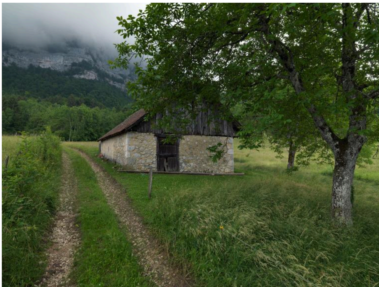
Vue d'ensemble de trois-quarts arrière gauche.