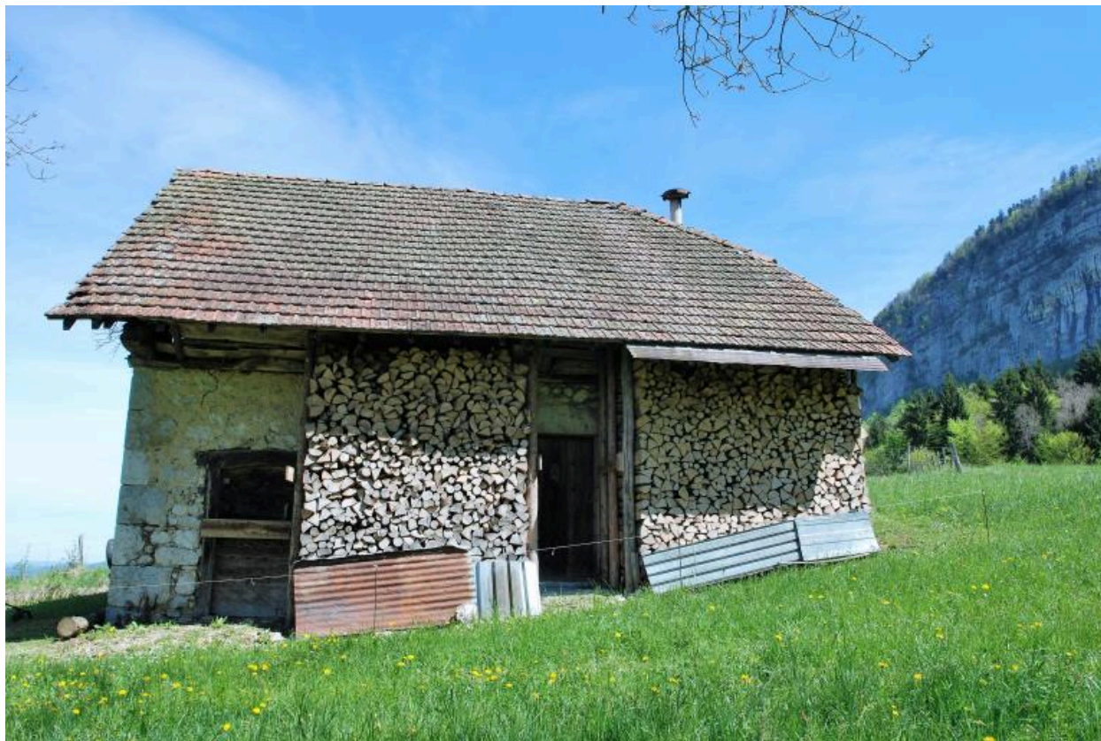
Vue d'ensemble de la façade sud.