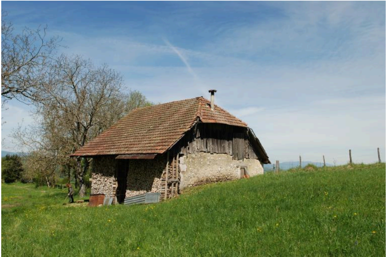
Vue d'ensemble de trois-quarts avant droit.