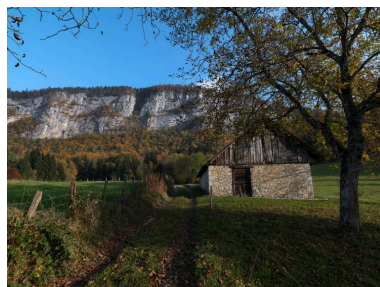
Vue d'ensemble depuis l'ouest de la ferme. IVR82_20157402721NUCAQ