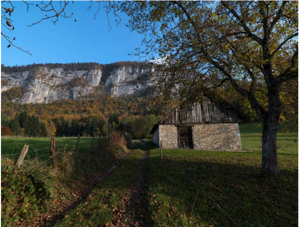
Vue d'ensemble depuis l'ouest de la ferme.