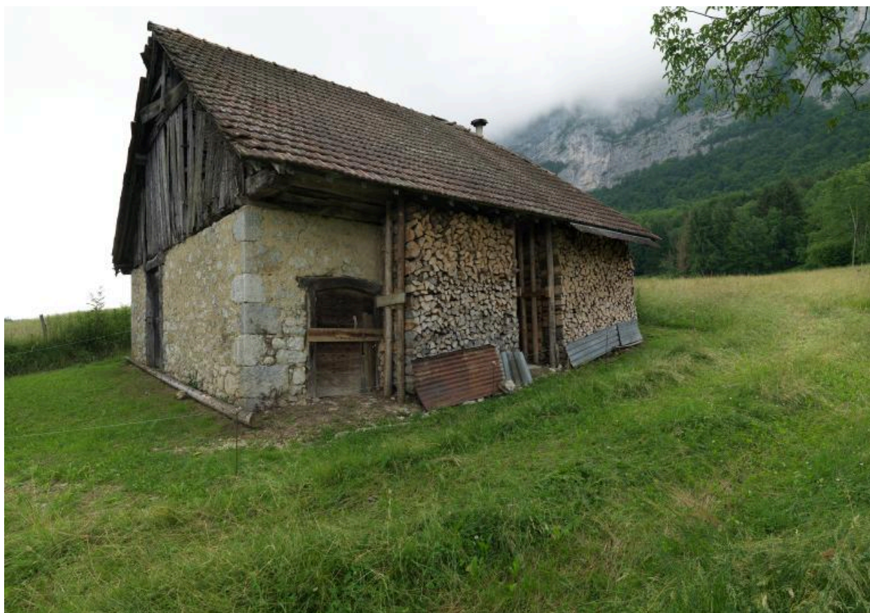
Vue d'ensemble de trois-quarts avant gauche de la ferme