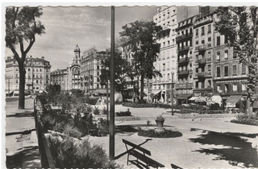
Vue de l'immeuble après surélévation, sur une carte postale datant des années 1960. IVR82_20126900808NUCB