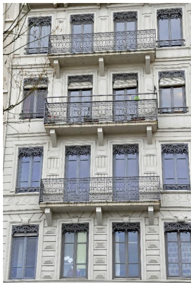
Vue des balcons centraux aux deuxième, troisième et quatrième étages IVR84_20166900627NUCA