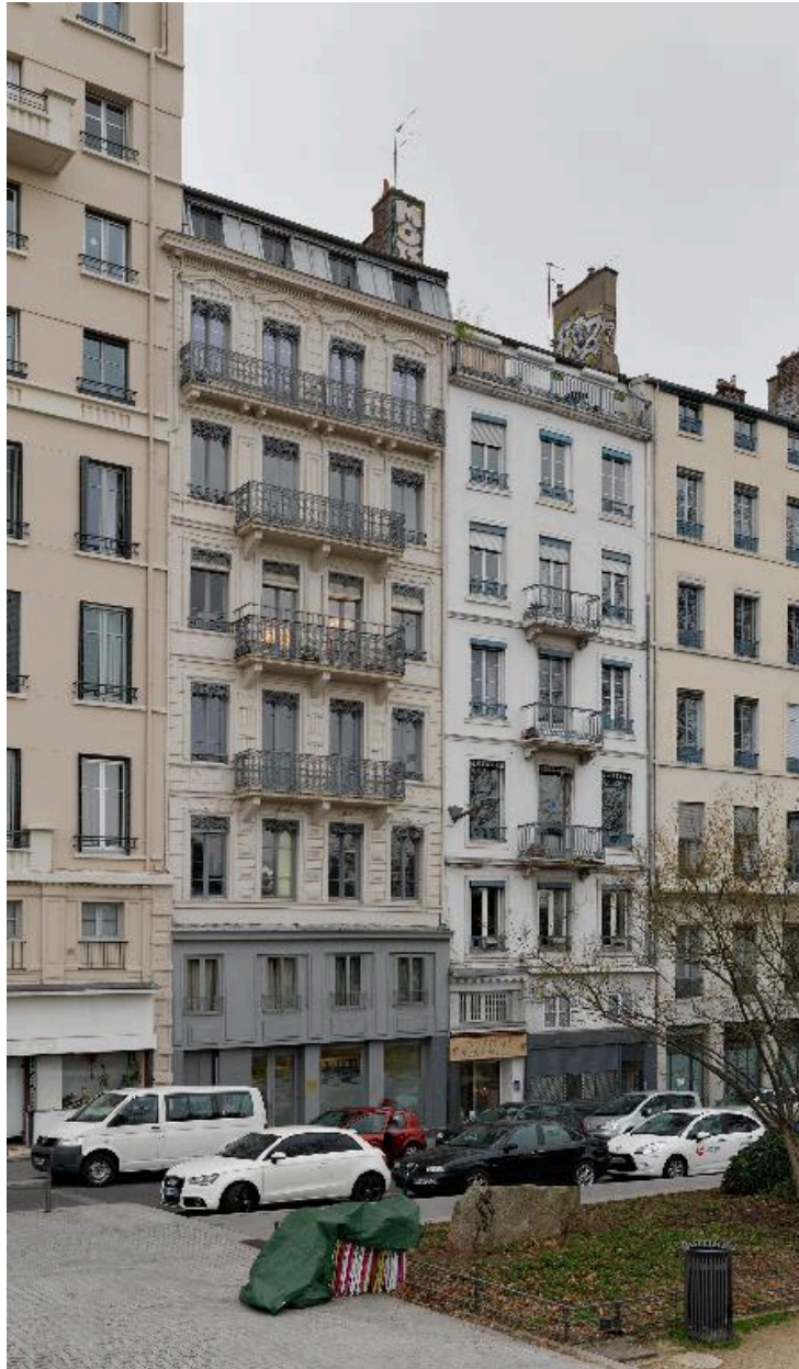
Vue de situation, avec l'immeuble mitoyen