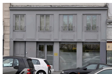
Vue du soubassement : rez-de-chaussée et entresol IVR84_20166900626NUCA