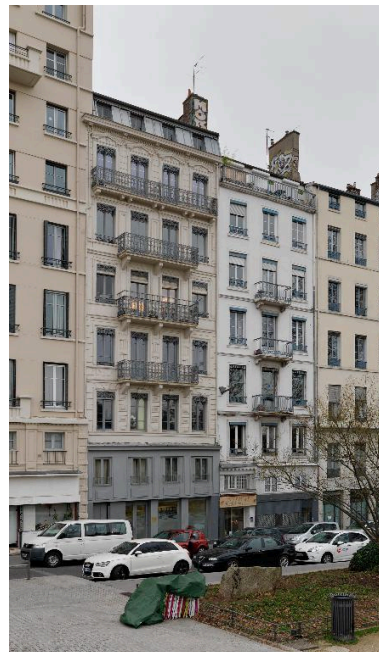
Vue de situation, avec l'immeuble mitoyen IVR84_20166901375NUCA