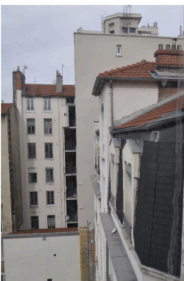
Vue partielle de l'élévation sur cour, montrant l'escalier à cage ouverte IVR84_20166900629NUCA