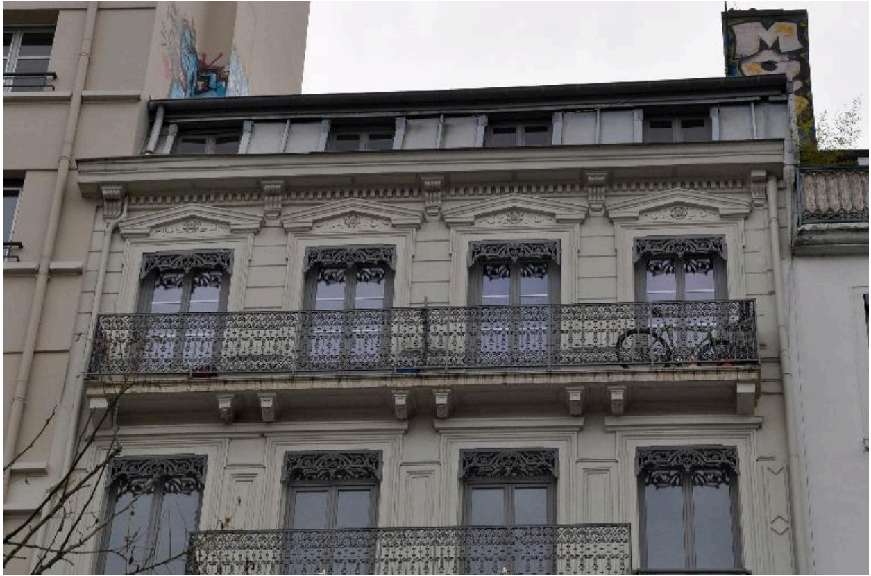
Vue du couronnement