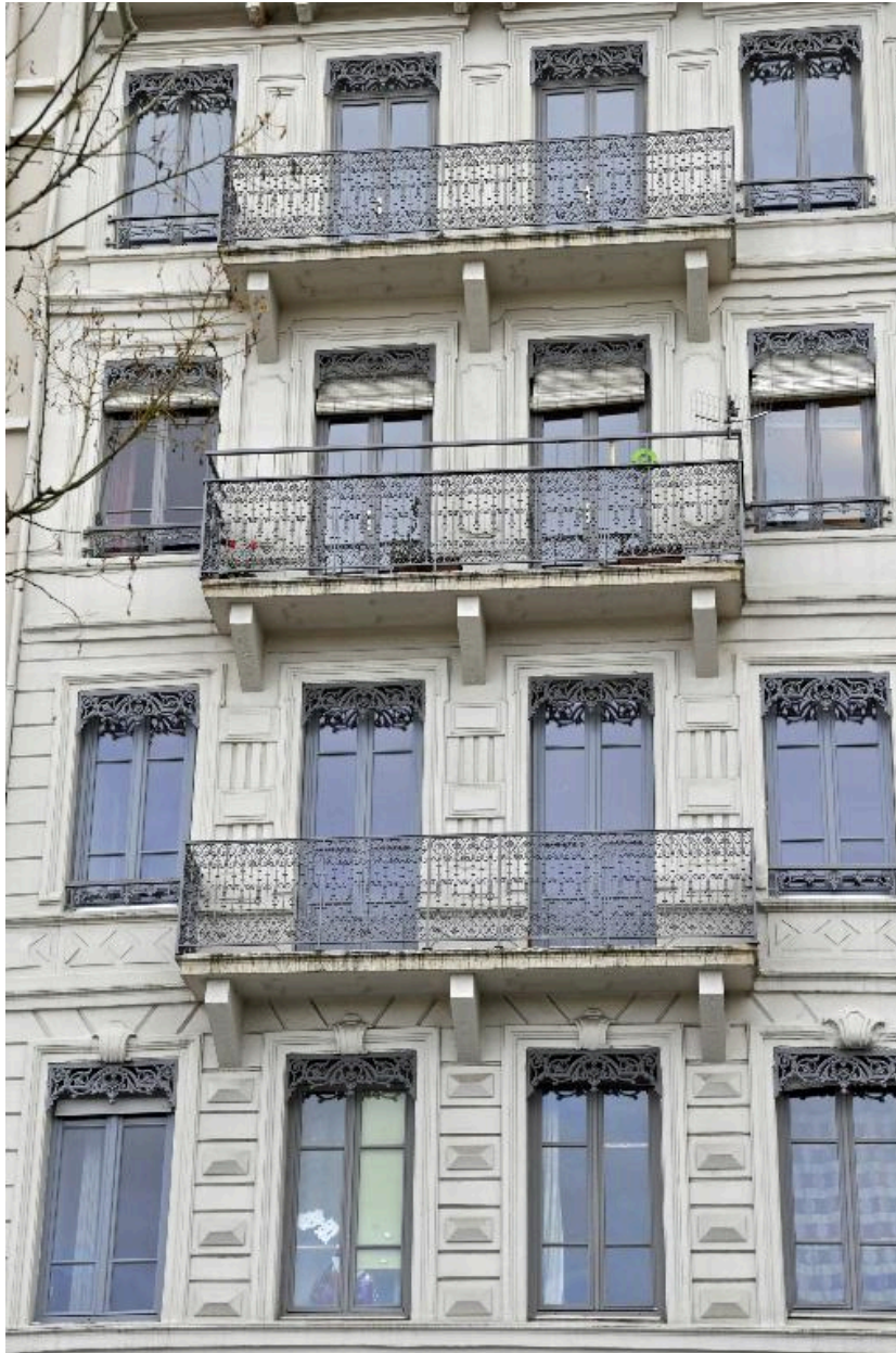
Vue des balcons centraux aux deuxième, troisième et quatrième étages