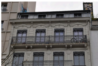
Vue du couronnement IVR84_20166900628NUCA