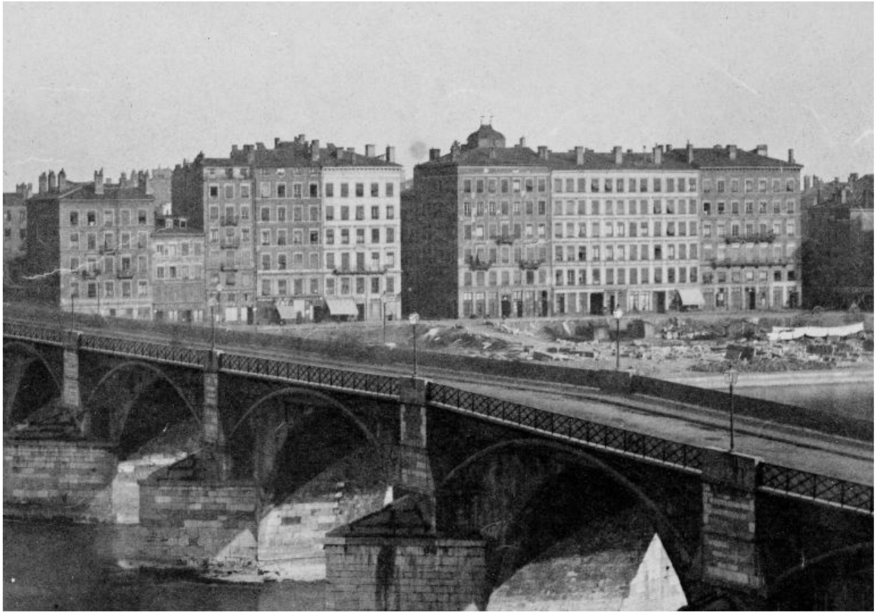
Vue de l'immeuble en 1857, avant surélévation, détail du panorama photographique de René-Félix Baumers (AC Lyon 84 PH)