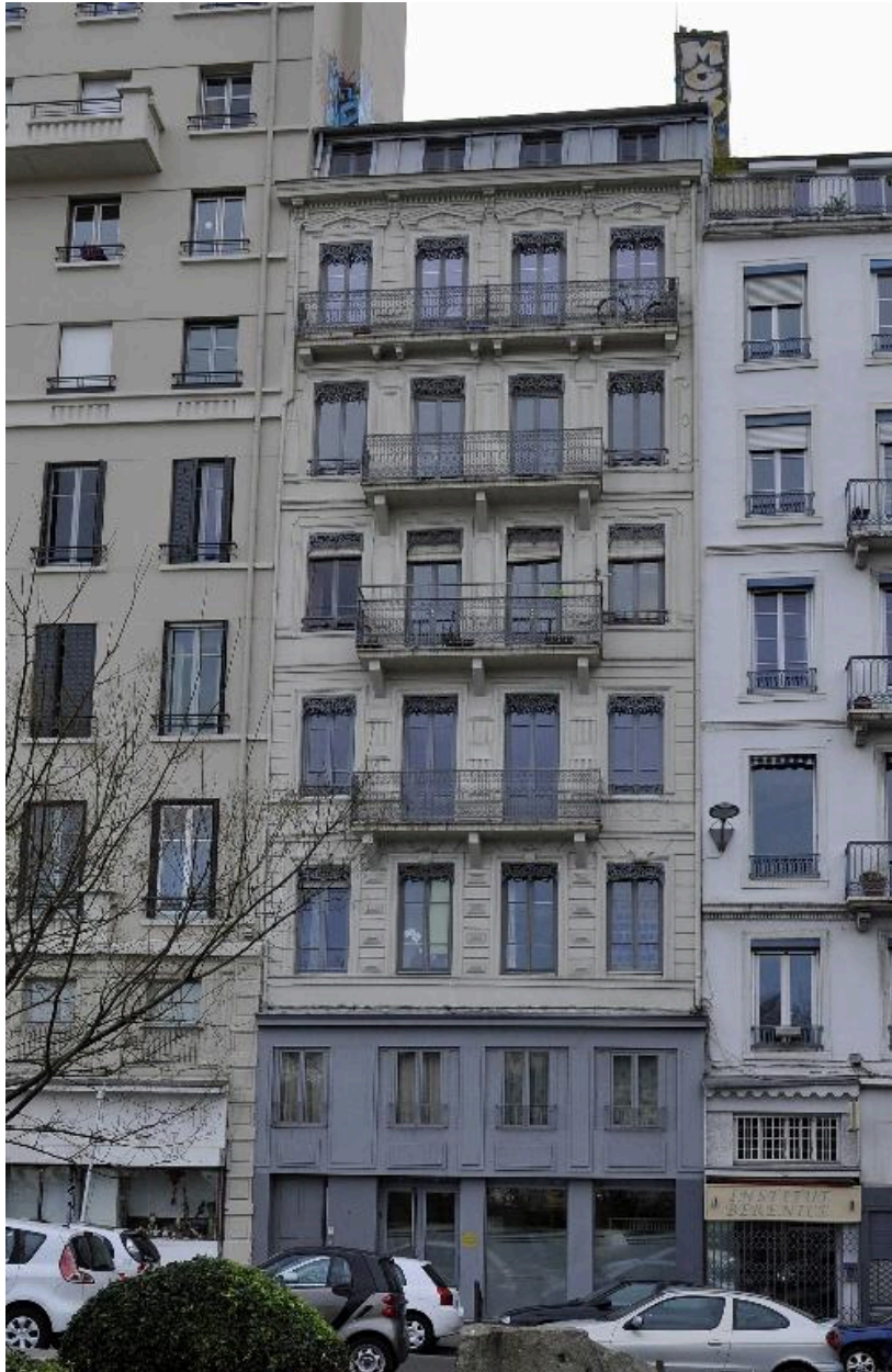
Elévation sur rue, vue générale