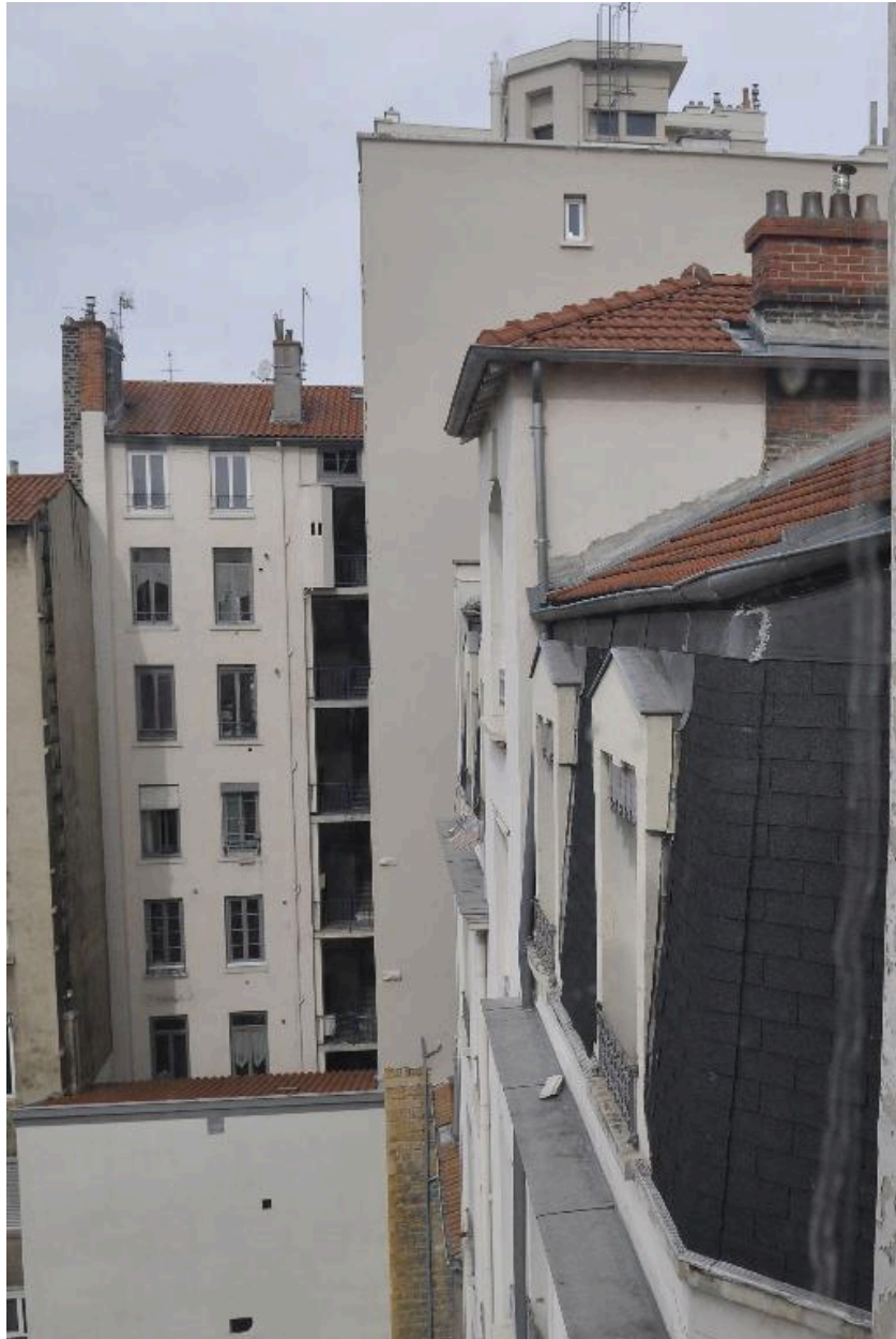
Vue partielle de l'élévation sur cour, montrant l'escalier à cage ouverte