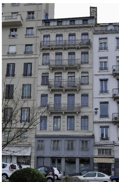
Elévation sur rue, vue générale IVR84_20166900625NUCA