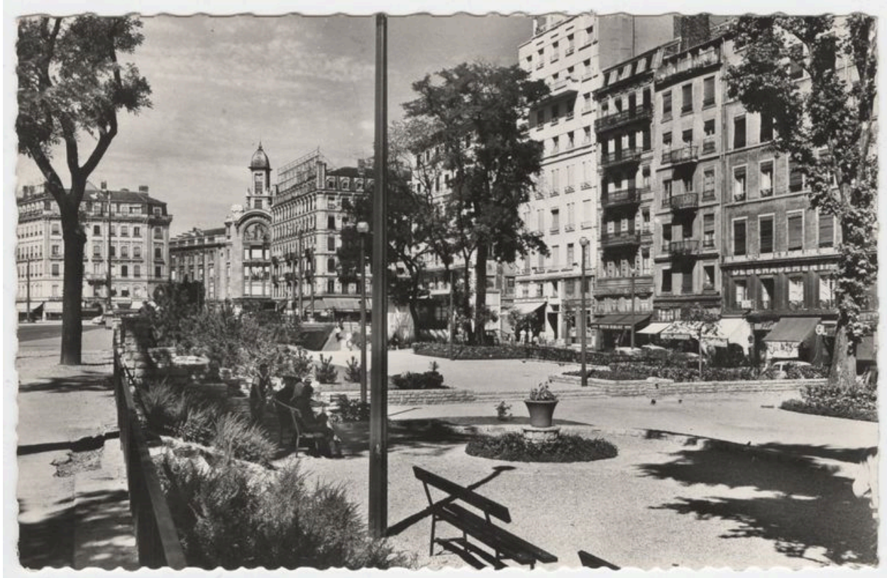
Vue de l'immeuble après surélévation, sur une carte postale datant des années 1960 (AC Lyon, 4 Fi 05559).