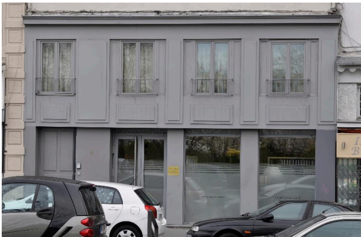
Vue du soubassement : rez-de-chaussée et entresol