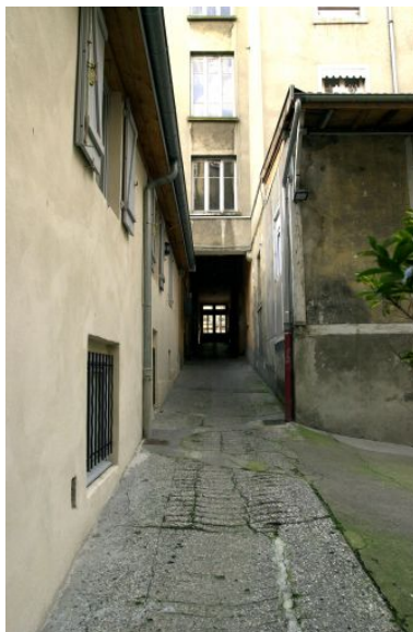
Vue du passage cocher depuis la cour IVR82_20016900249NUCA