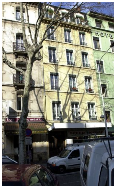
Elévation principale IVR82_20016900248NUCA