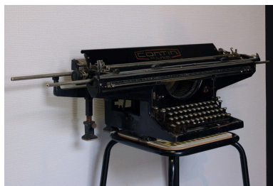
Vue générale IVR82_20116900820NUCA