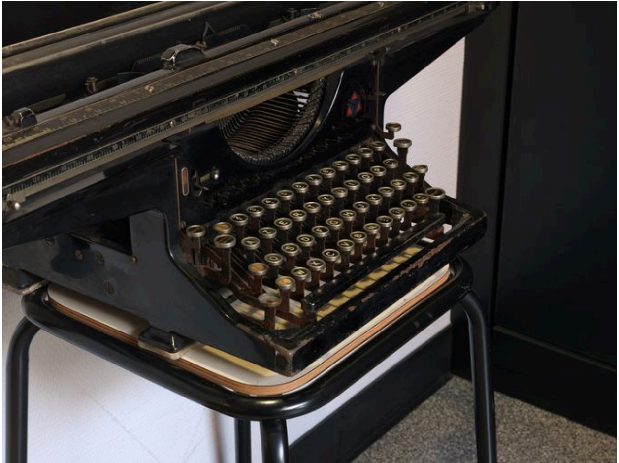
Détail du clavier