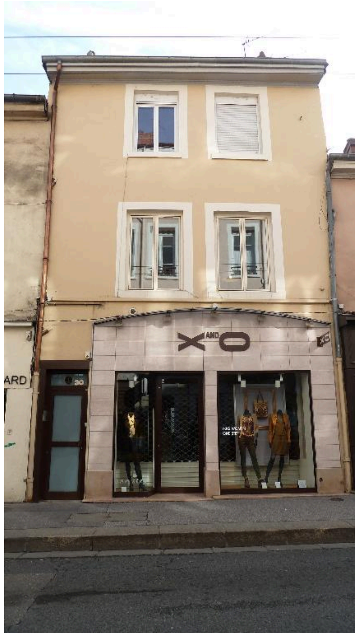
Vue ouest de l'immeuble