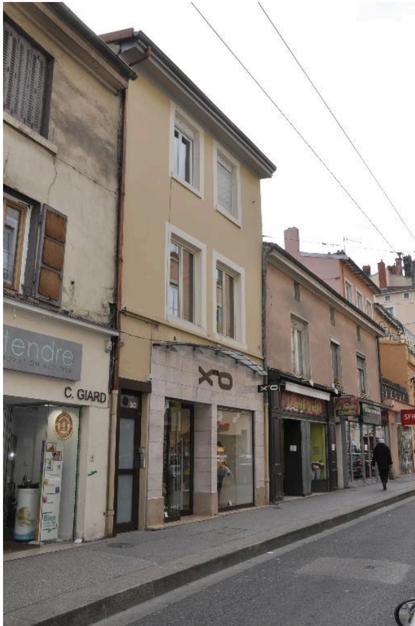
Vue d'ensemble nord ouest de l'immeuble de deux étages