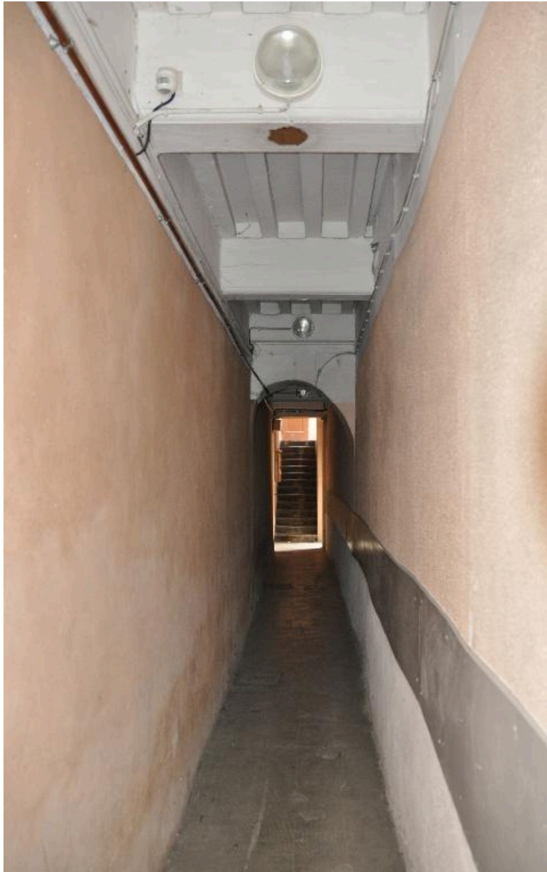
Vue de l'allée