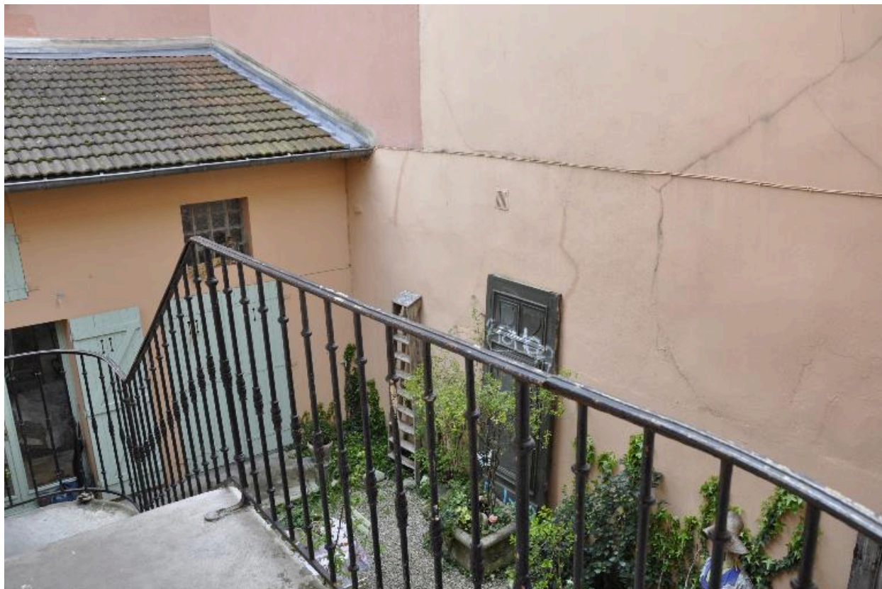
Vue du logement sur cour depuis l'escalier