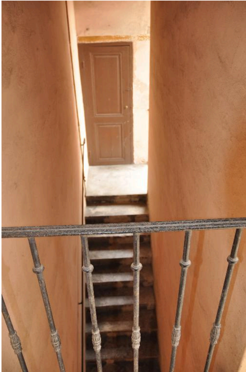
Vue de l'escalier depuis le dernier niveau