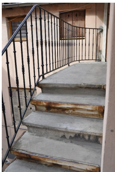
Vue du derniveau de l'escalier IVR82_20146900339NUCA