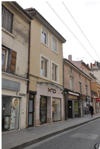
Vue d'ensemble nord ouest de l'immeuble de deux étages IVR82_20146900335NUCA