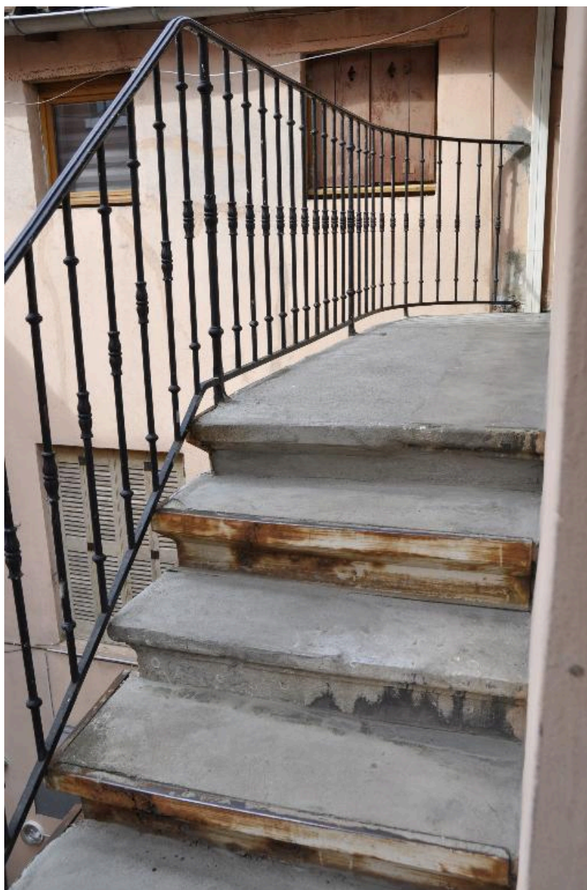
Vue du derniveau de l'escalier