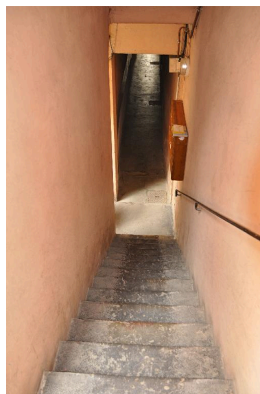
Vue de la première volée de l'esclaiier depuis le repos IVR82_20146900341NUCA