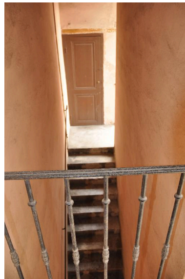
Vue de l'escalier depuis le dernier niveau IVR82_20146900337NUCA