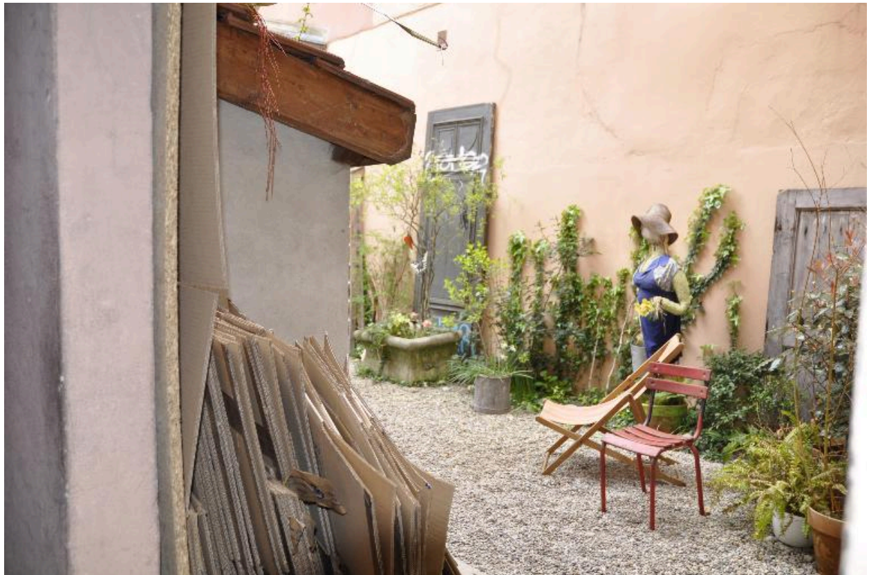
Vue de la cour depuis l'allée