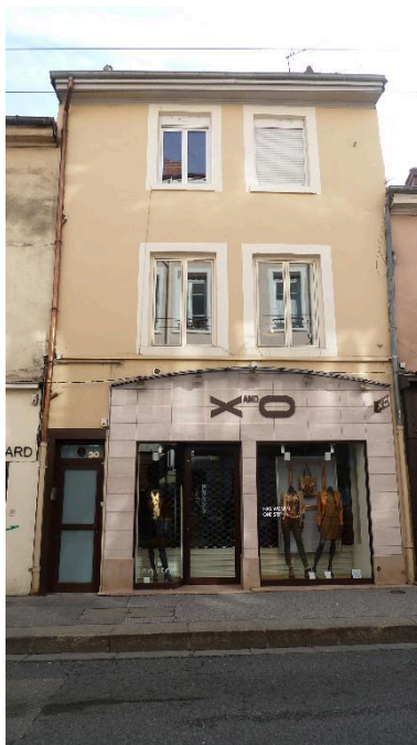
Vue ouest de l'immeuble IVR82_20146900356NUCA