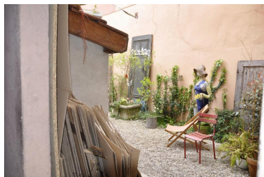
Vue de la cour depuis l'allée