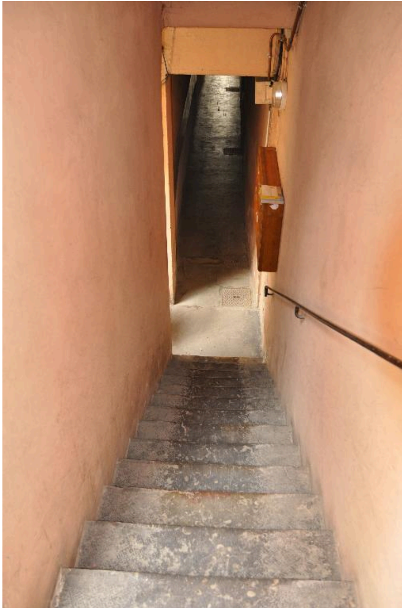
Vue de la première volée de l'esclaiier depuis le repos