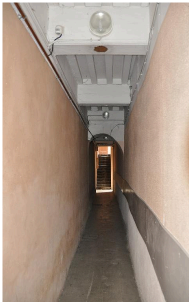
Vue de l'allée