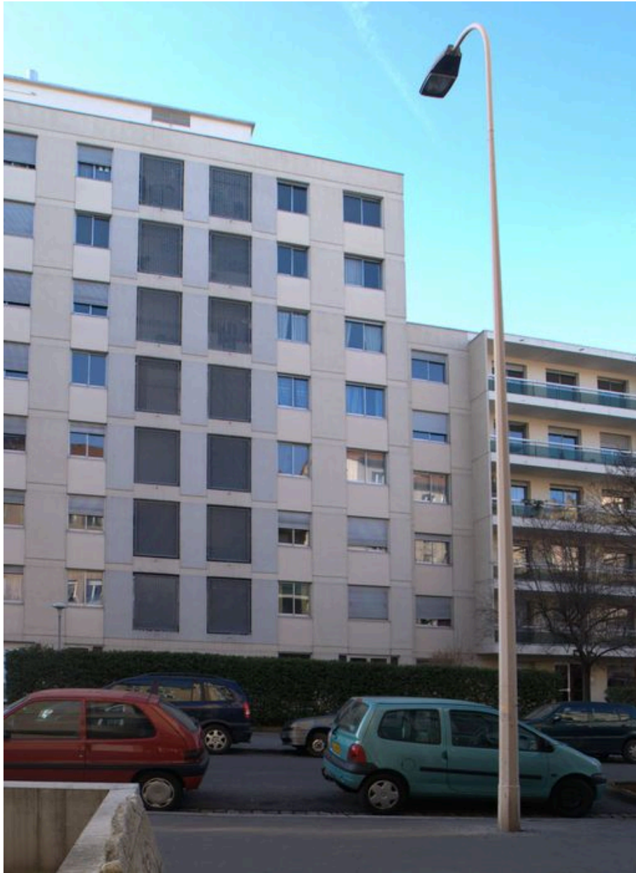
Elévation sur rue