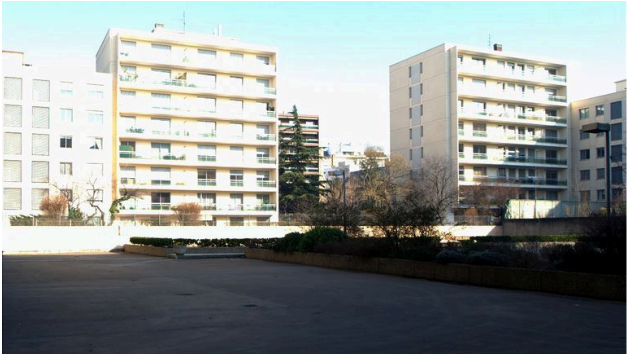
Elévation sur cour, depuis le sud