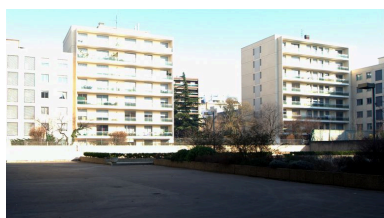
Elévation sur cour, depuis le sud IVR82_20116904134NUCA