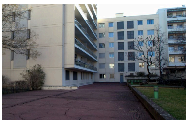
Elévation sur cour, vue partielle depuis l'ouest IVR82_20116904141NUCA