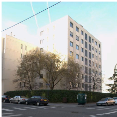
Vue générale IVR82_20116904140NUCA