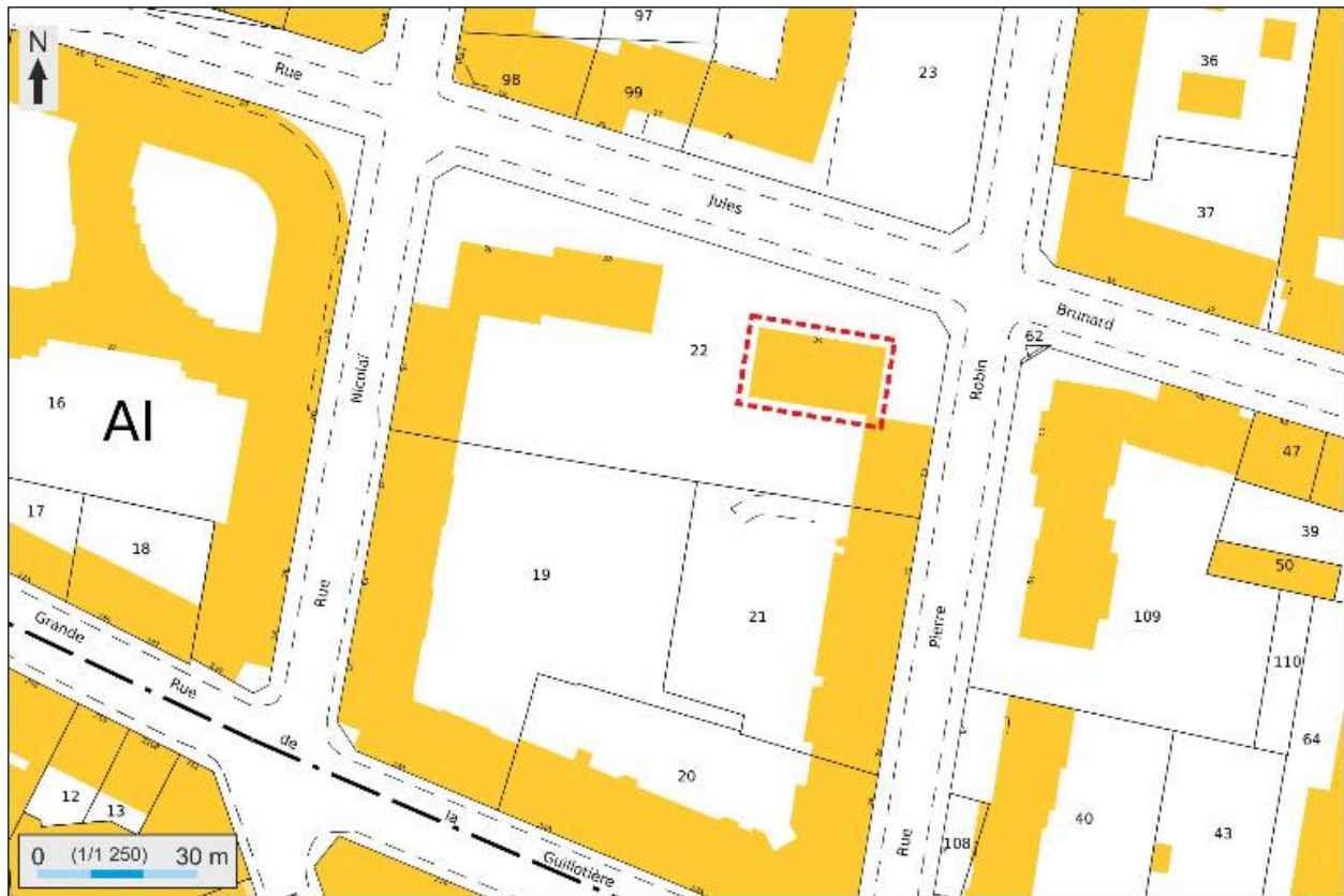
Plan masse et de situation