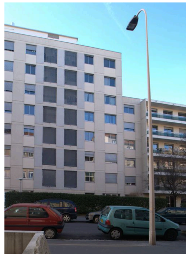
Elévation sur rue IVR82_20116904138NUCA