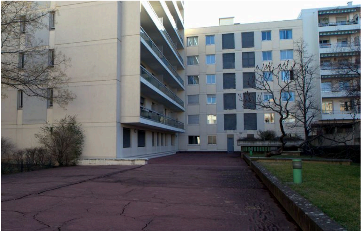
Elévation sur cour, vue partielle depuis l'ouest