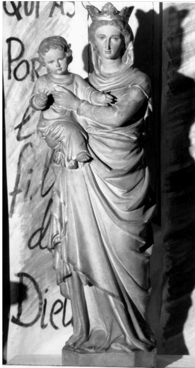
Vue de la Vierge à l'Enfant, volée en mai 2013.