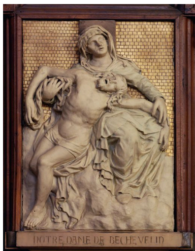
Vue de la Vierge de Pitié dite Notre-Dame de Béchevelin. IVR82_20126901771NUCA