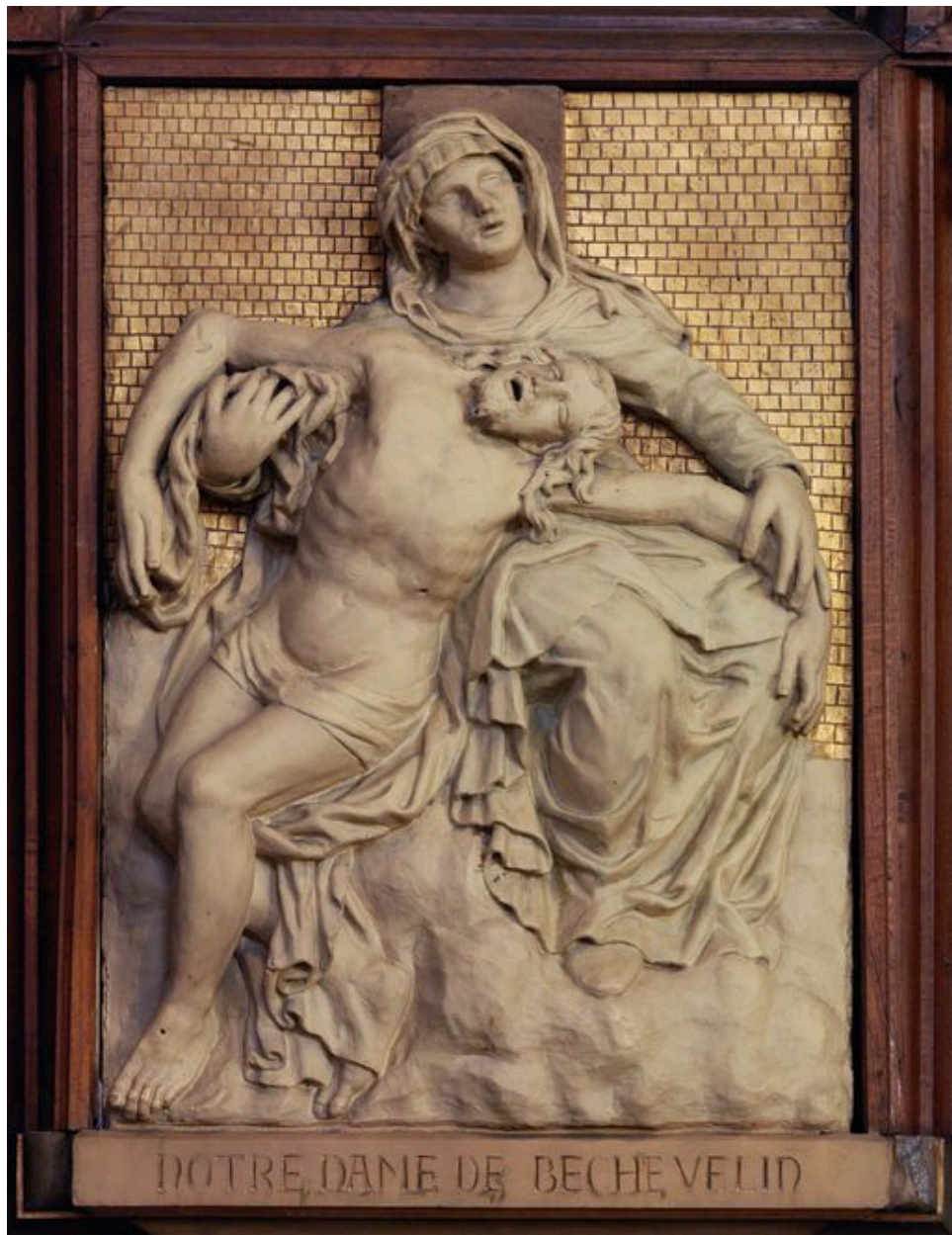
Vue de la Vierge de Pitié dite Notre-Dame de Béchevelin.