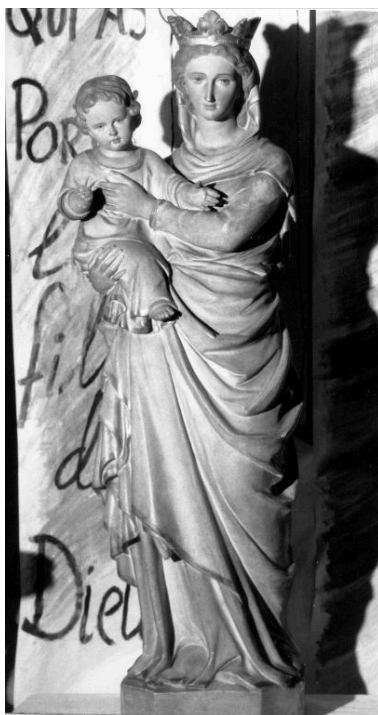
Vue de la Vierge à l'Enfant, volée en mai 2013. IVR82_20136900061NUCA