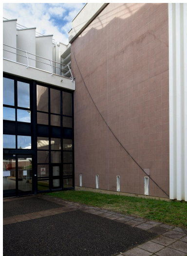
Trait extérieur. IVR84_20193800449NUCA