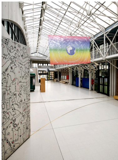
Traits intérieurs. IVR84_20193800447NUCA