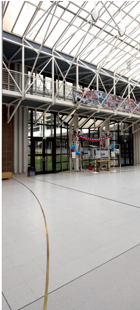
Traits intérieurs, autre point de vue.