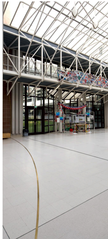
Traits intérieurs, autre point de vue. IVR84_20193800448NUCA