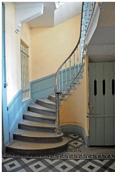
Vue intérieure : le départ de l'escalier