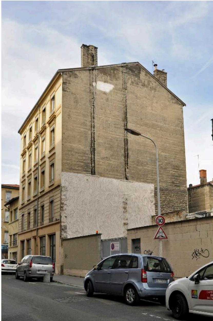
Vue d'ensemble, depuis le nord-est