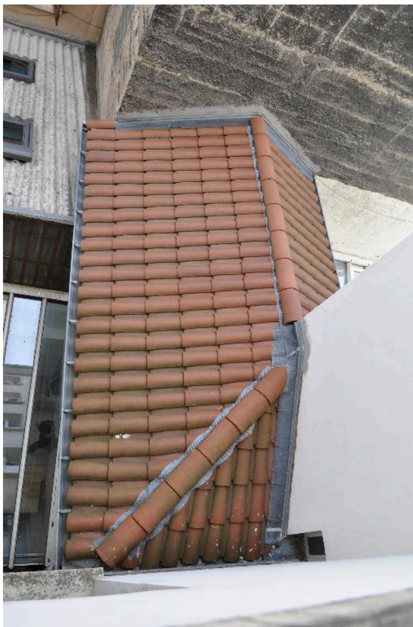
Vue de la loge construite en encorbellement sur la cour