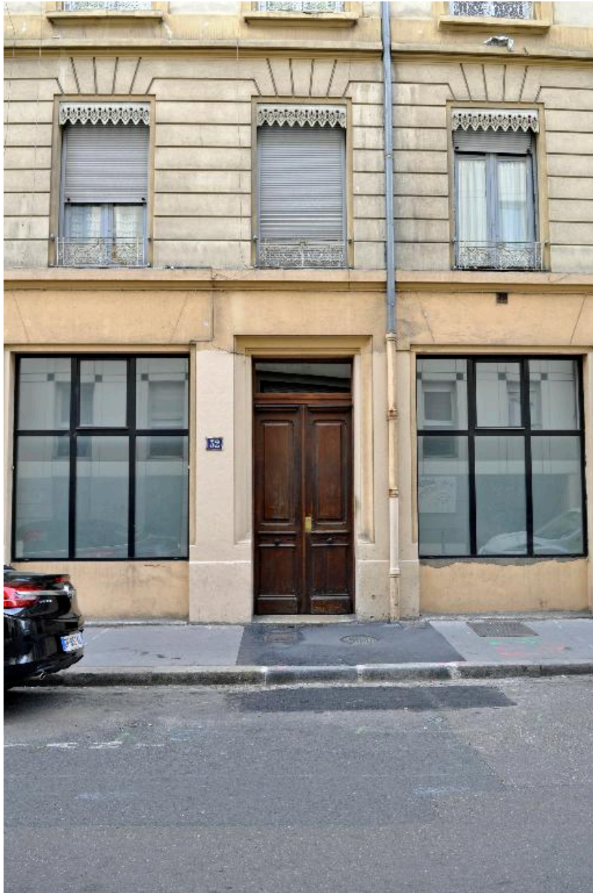
Elévation sur rue : vue de la porte, décor du rez-de-chaussée et de l'étage en entresol