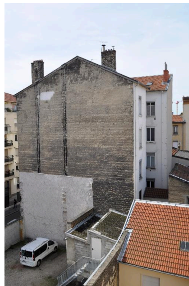
Vue d'ensemble, depuis le nord-est IVR84_20176901080NUCA