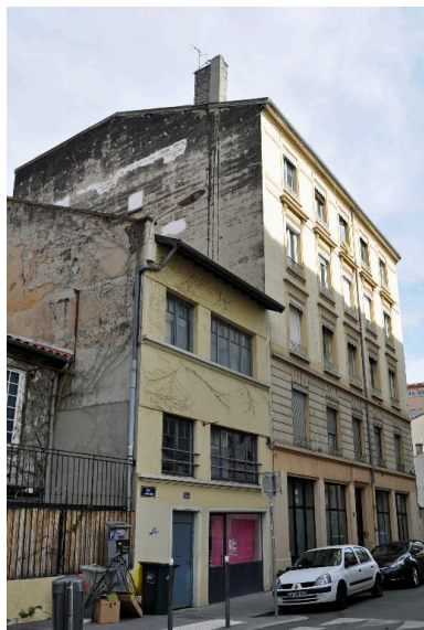
Vue d'ensemble, depuis le sud-est IVR84_20176901078NUCA