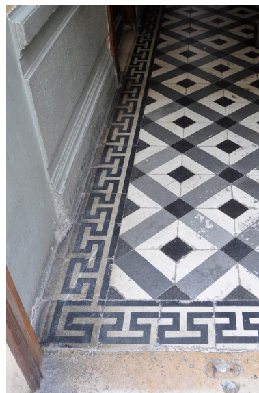
Vue intérieure : détail du pavement de l'allée