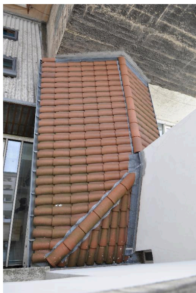
Vue de la loge construite en encorbellement sur la cour