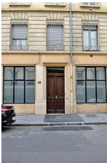
Elévation sur rue : vue de la porte, décor du rez-de-chaussée et de l'étage en entresol