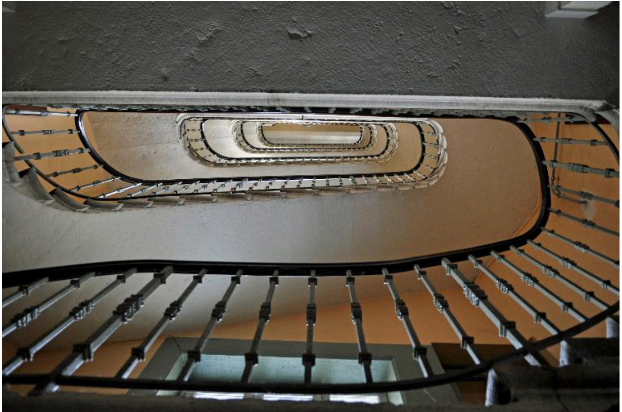
Vue intérieure : l'escalier vu du dessous