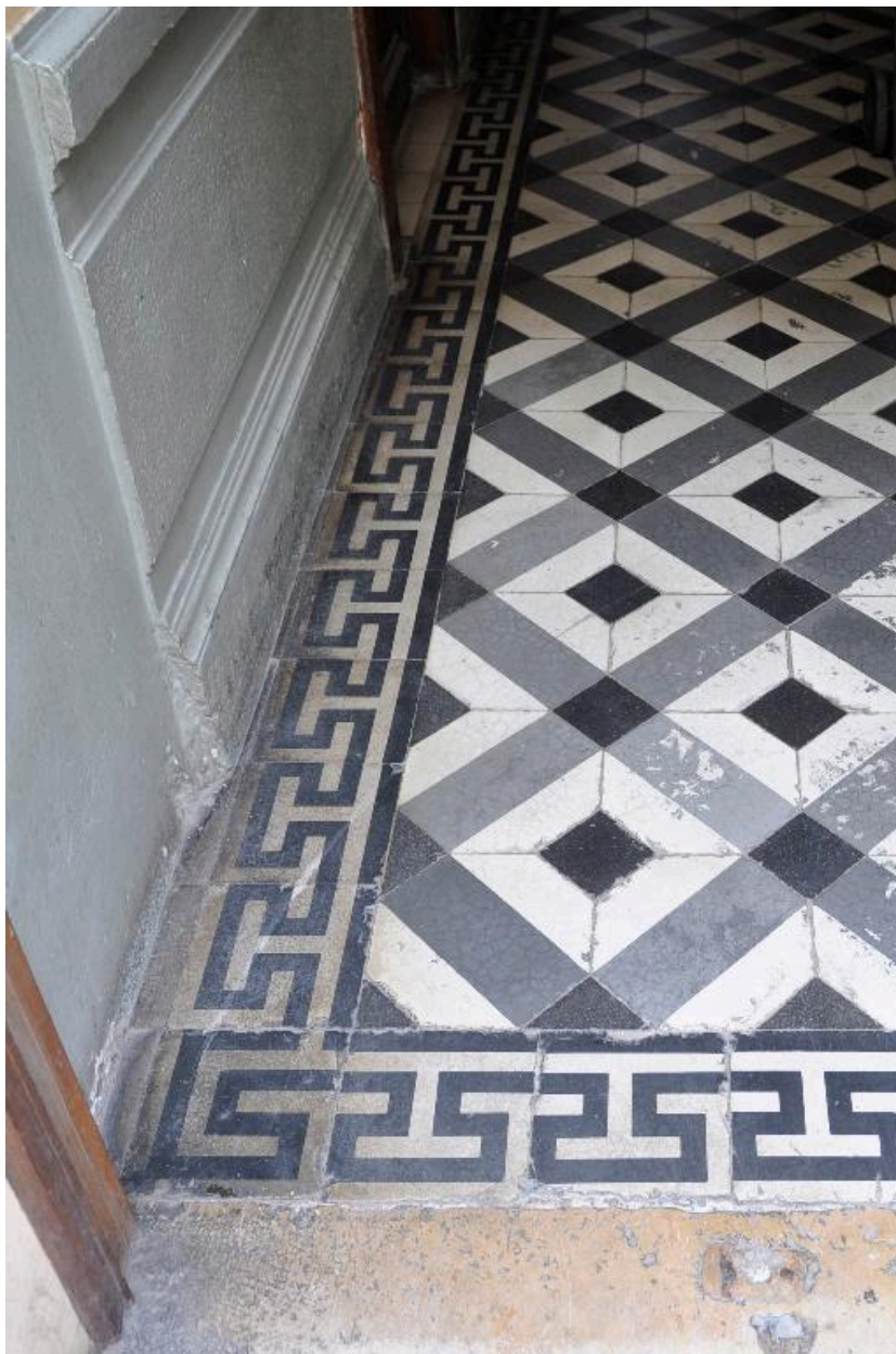
Vue intérieure : détail du pavement de l'allée