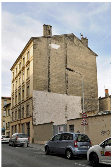
Vue d'ensemble, depuis le nord-est IVR84_20176901079NUCA