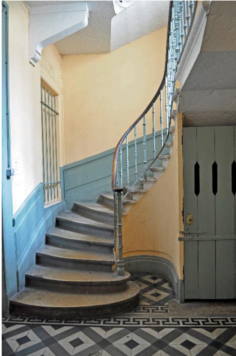
Vue intérieure : le départ de l'escalier