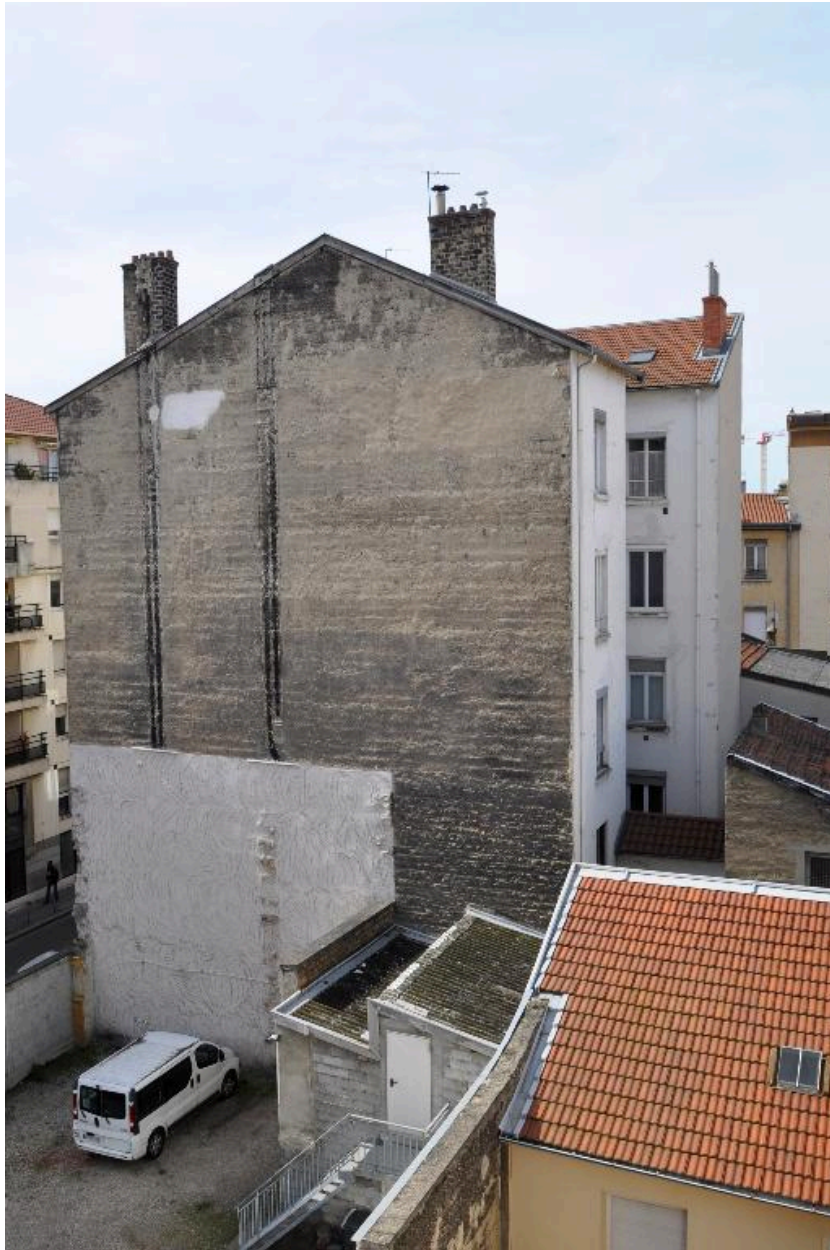
Vue d'ensemble, depuis le nord-est