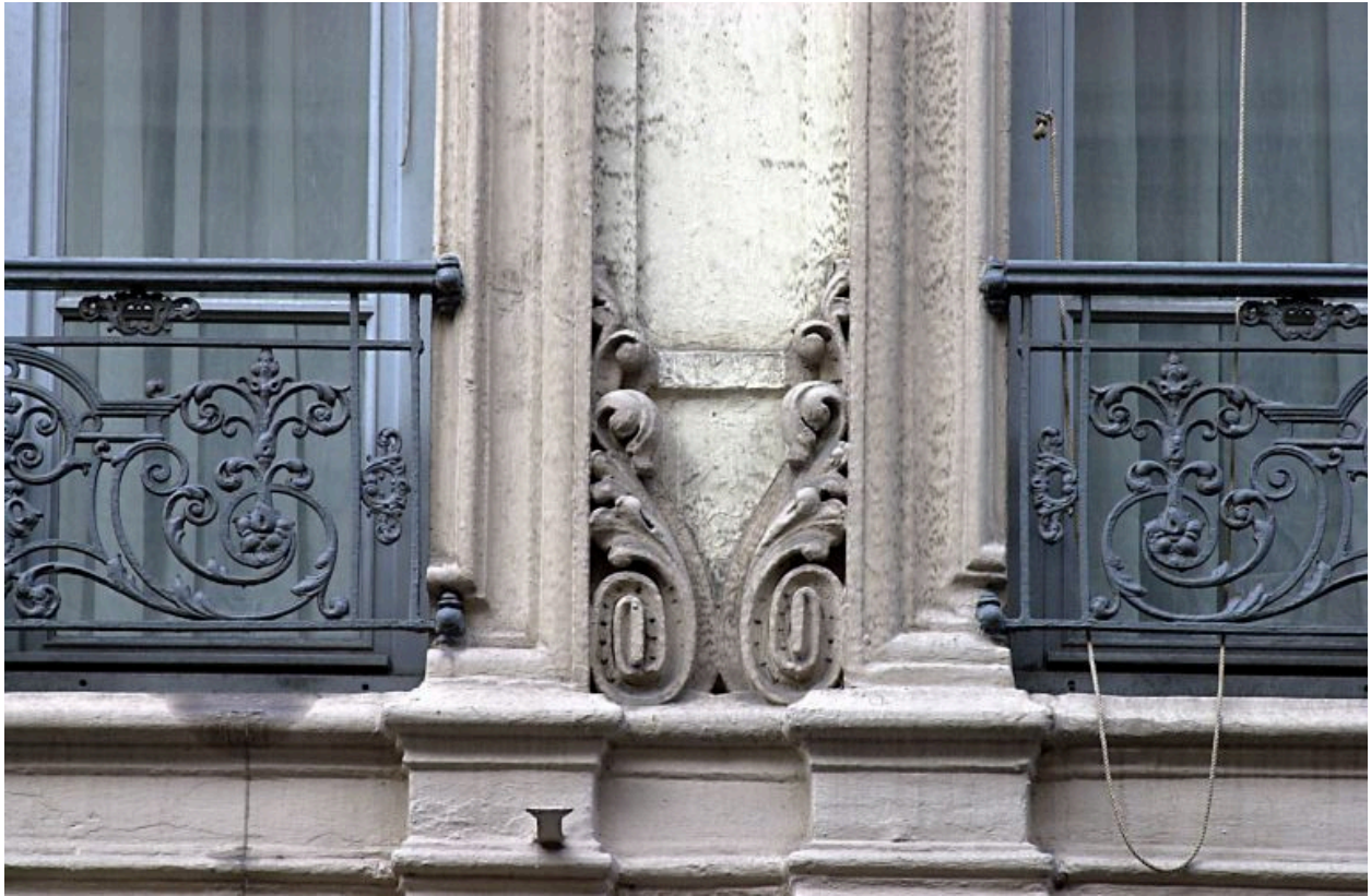
Façade, 1er étage, détail des chambranles de fenêtres