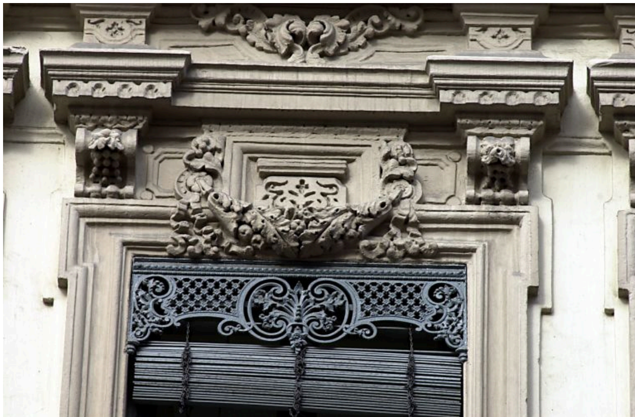
Façade, détail de la partie haute d'une fenêtre du 2e étage