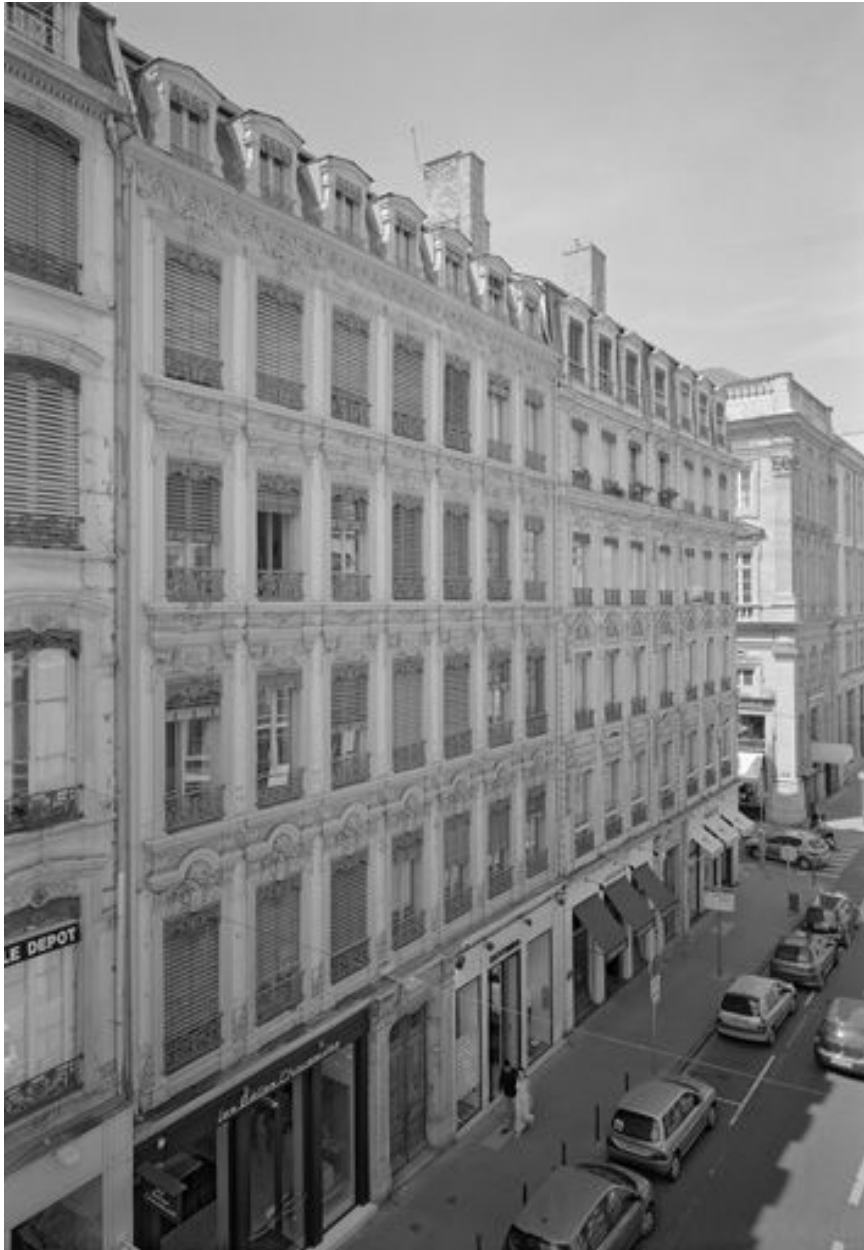
Façade, vue générale