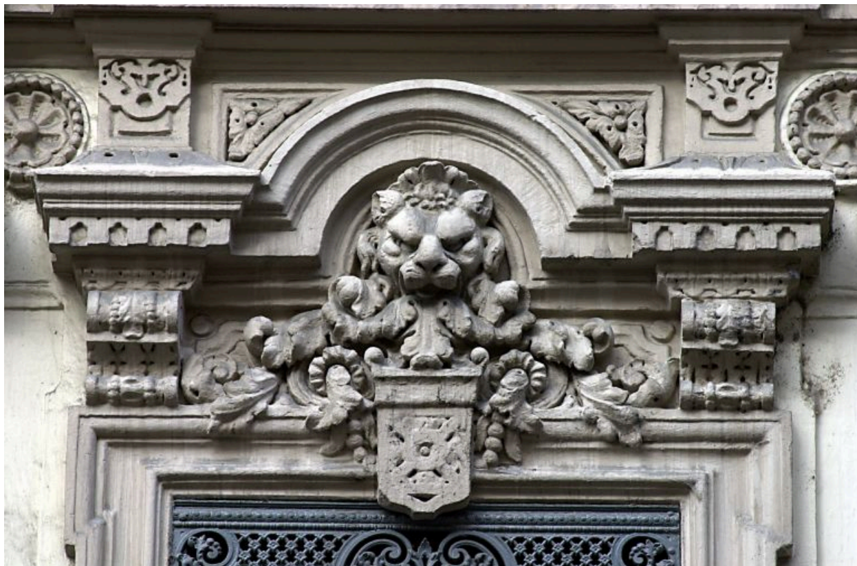
Façade, détail d'une fenêtre du 1er étage