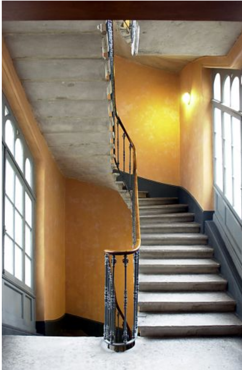
Escalier vu depuis le palier du 3e étage