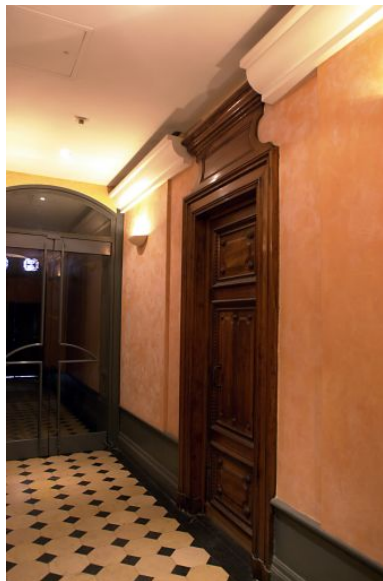
Allée