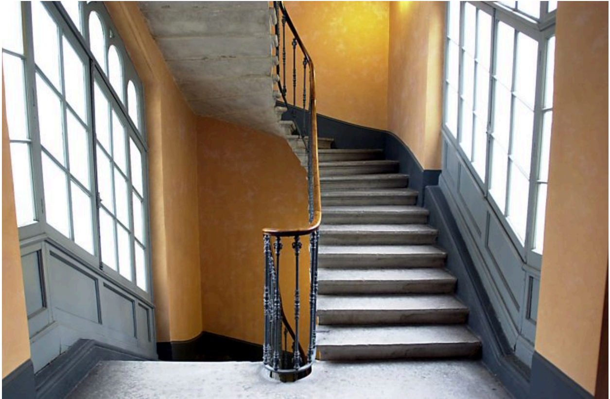
Escalier vu depuis le palier du 3e étage