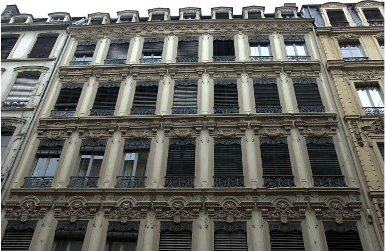
Façade, vue des 4 étages carrés