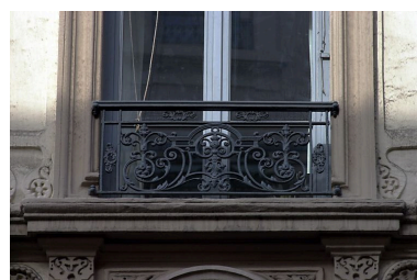
Façade, détail de l'appui d'une fenêtre du 2e étage IVR82_20046900256NUCA