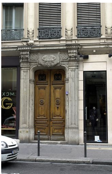
Façade, porte IVR82_20046900253NUCA