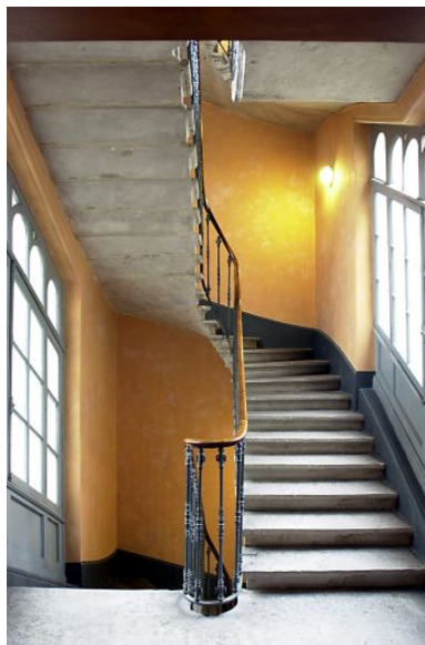
Escalier vu depuis le palier du 3e étage IVR82_20046900263NUCA