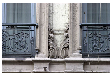
Façade, 1er étage, détail des chambranles de fenêtres IVR82_20046900260NUCA