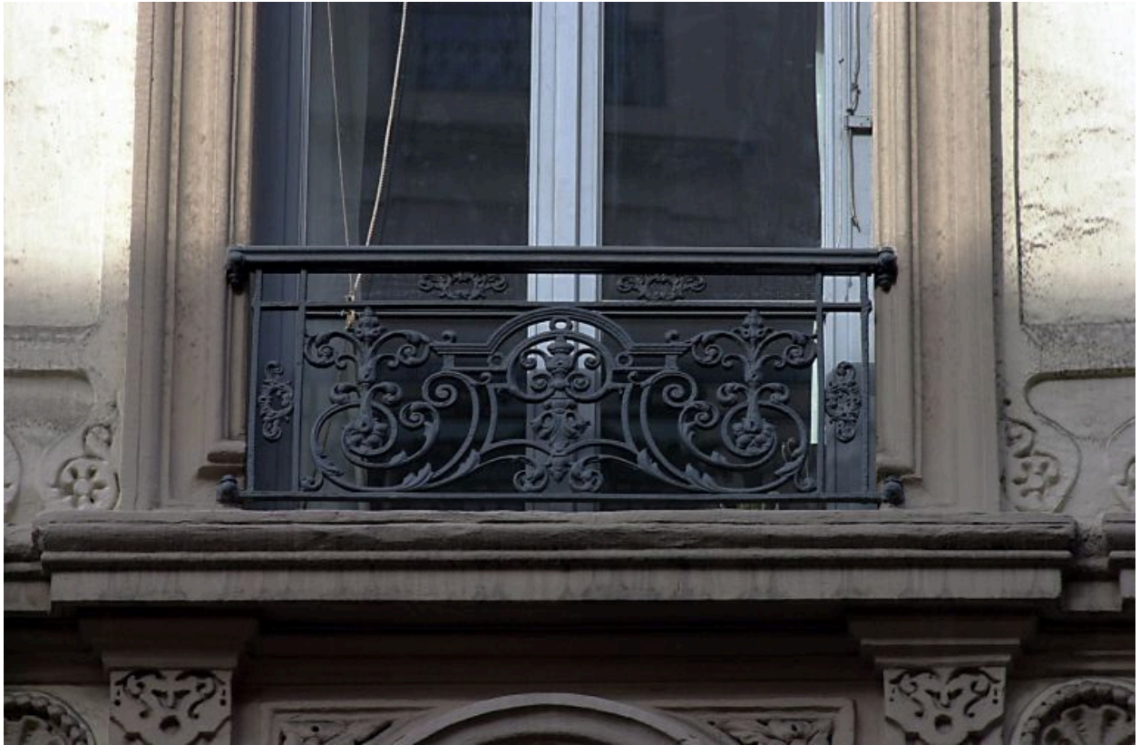
Façade, détail de l'appui d'une fenêtre du 2e étage