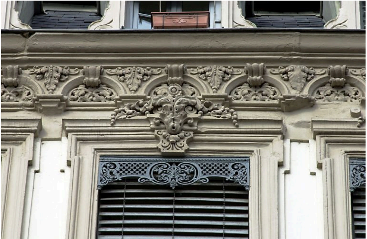
Façade, détail d'une fenêtre du 4e étage et de la corniche