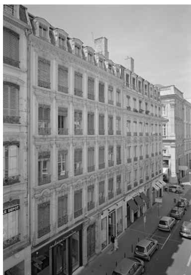
Façade, vue générale IVR82_20056901728P