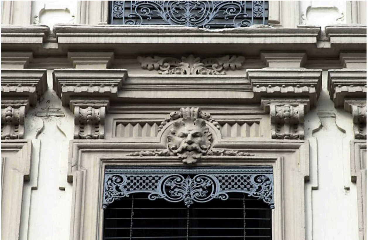
Façade, détail d'une fenêtre du 3e étage