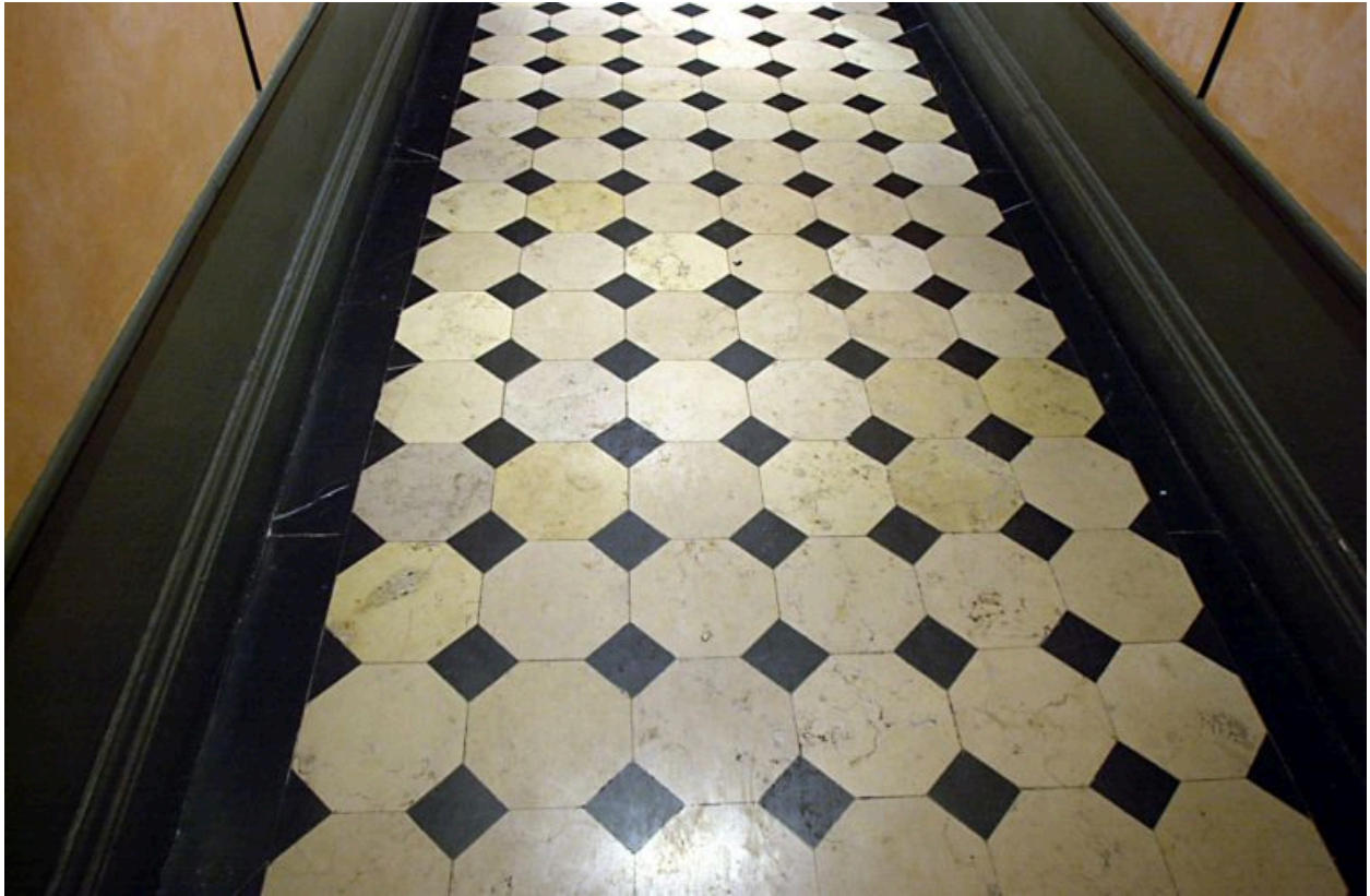
Sol de l'allée