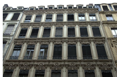
Façade, vue des 4 étages carrés IVR82_20046900254NUCA