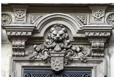
Façade, détail d'une fenêtre du 1er étage IVR82_20046900255NUCA