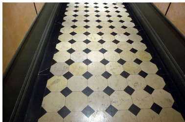
Sol de l'allée IVR82_20046900262NUCA