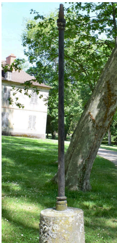
Vue générale d'un candélabre IVR84_20226300796NUCA