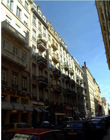
Façade sur rue, vue générale côté gauche