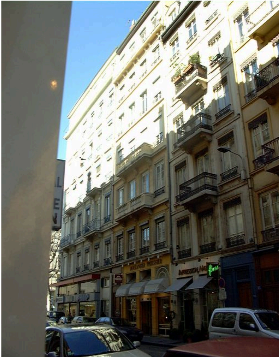
Façade sur rue, vue générale côté droit