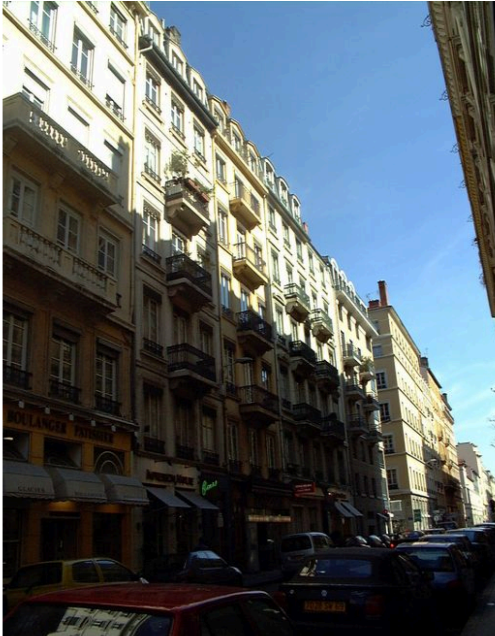
Façade sur rue, vue générale côté gauche