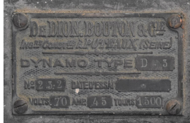
Détail inscriptions IVR84_20226300791NUCA