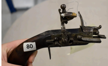
Vue générale IVR84_20226302996NUC4A