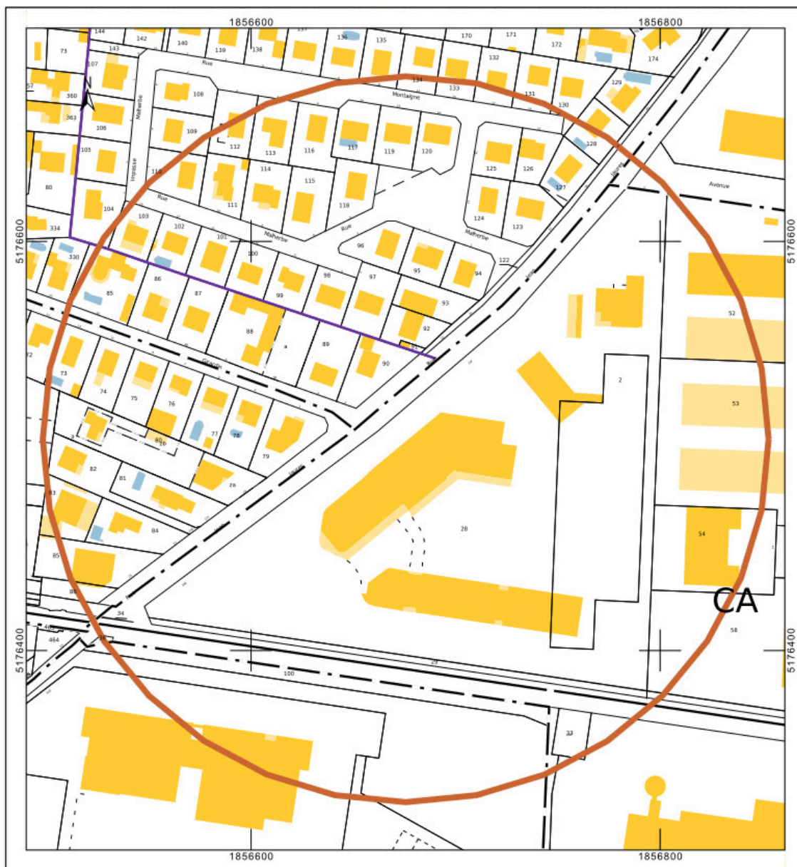
Plan masse et de situation, extrait du plan cadastral