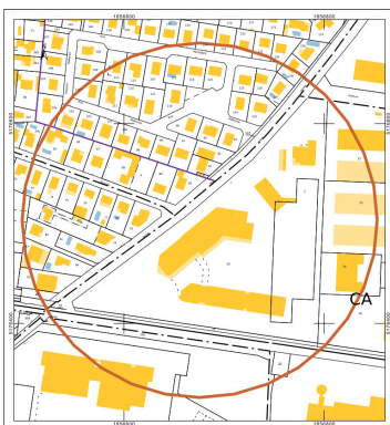
Plan masse et de situation, extrait du plan cadastral IVR84_20246900341NUDA