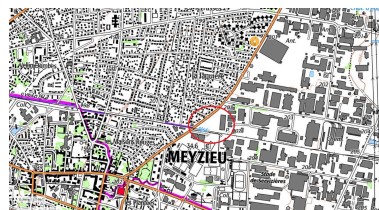
Plan de situation IVR84_20246900342NUDA