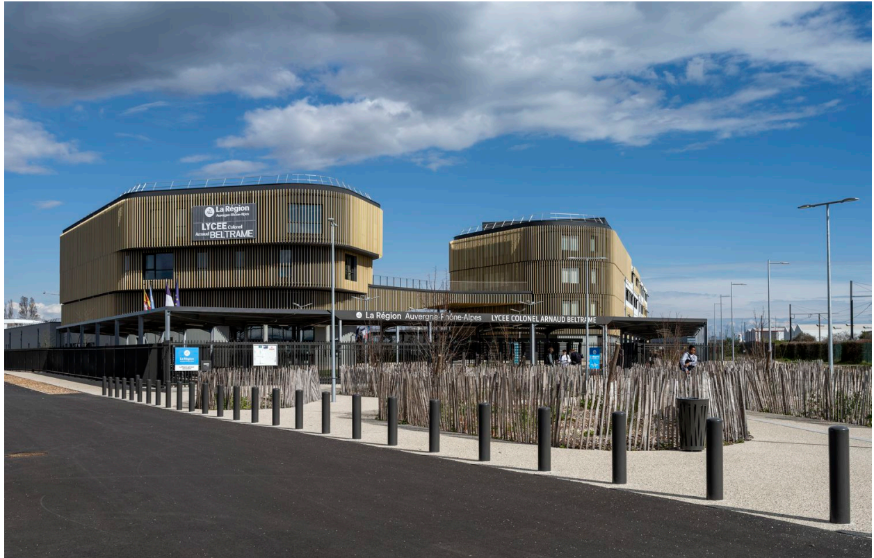
Vue d'ensemble : parvis et entrée