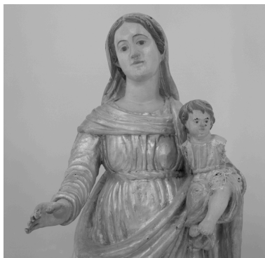
Détail montrant les manques causés par la vermoulure. IVR82_19992600055X