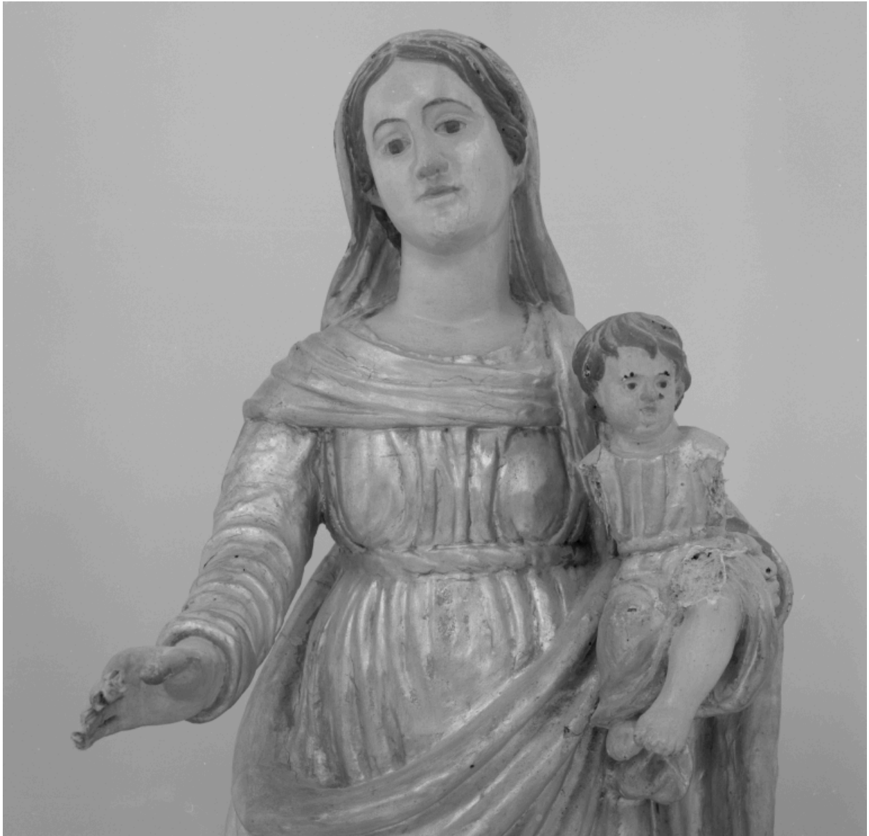
Détail montrant les manques causés par la vermoulure.