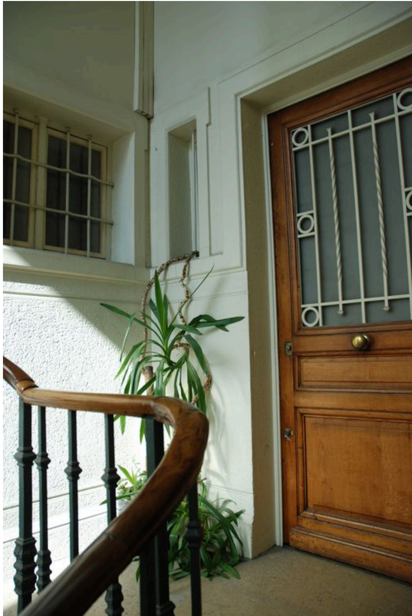
Vue d'un palier