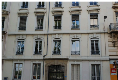
Détail de l'élévation sur rue IVR82_20126900873NUCA