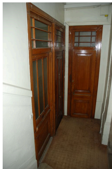
Vue de l'entrée de la loge de concierge au rez-de-chaussée