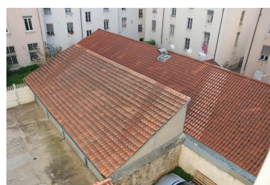
Vue des garages IVR82_20126900877NUCA