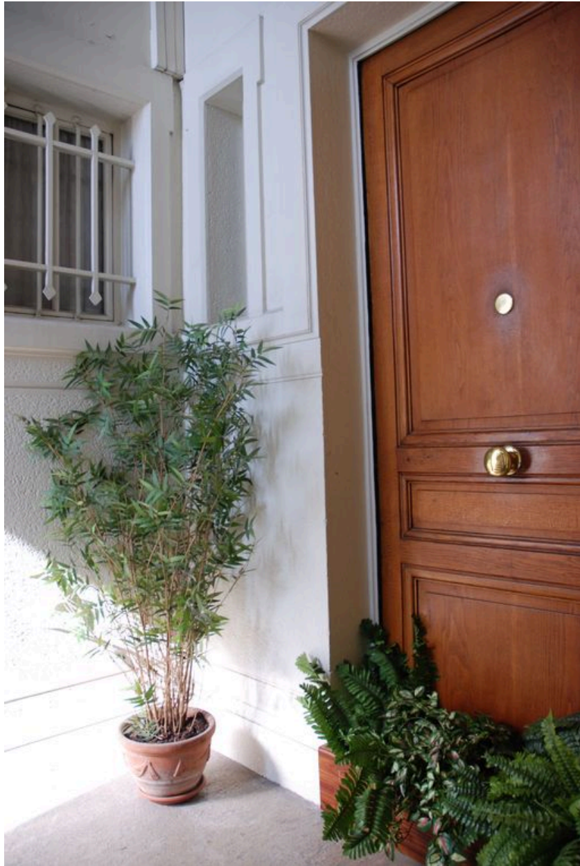
Vue d'un palier