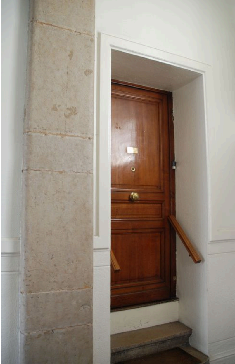
Vue de l'entrée de l'appartement situé au rez-de-chaussée, gauche