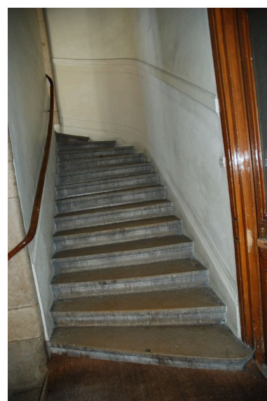
Vue du départ de l'escalier, première volée décalée