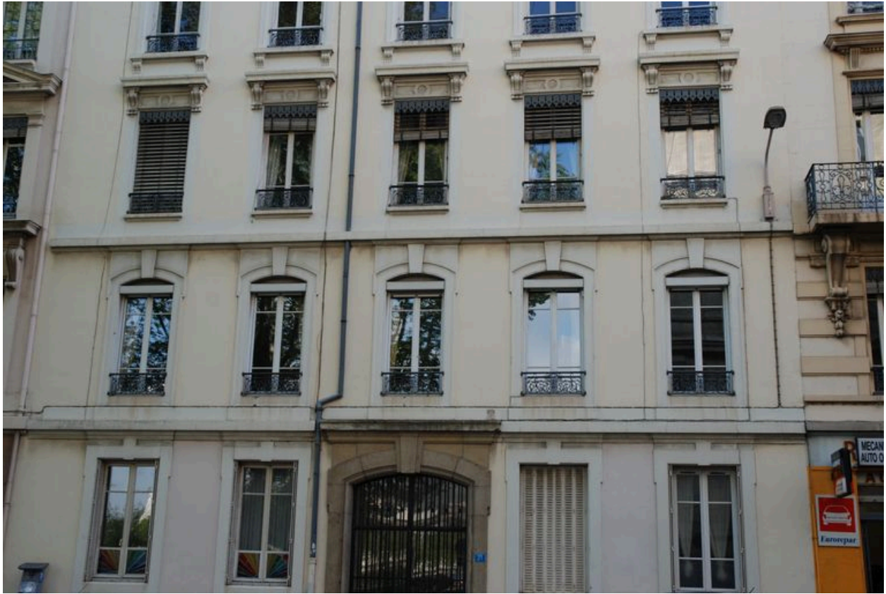
Détail de l'élévation sur rue