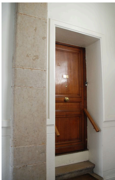
Vue de l'entrée de l'appartement situé au rez-de-chaussée, gauche IVR82_20126900883NUCA