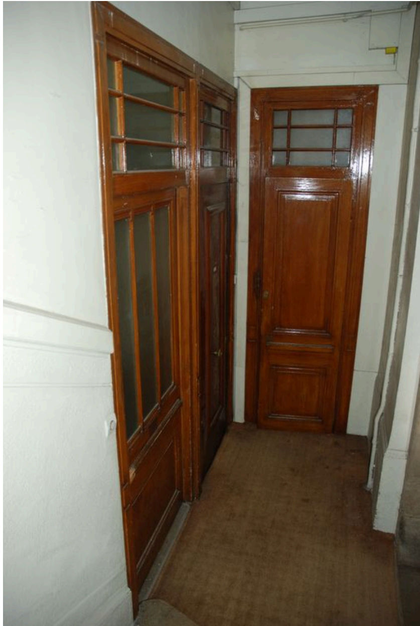
Vue de l'entrée de la loge de concierge au rez-de-chaussée