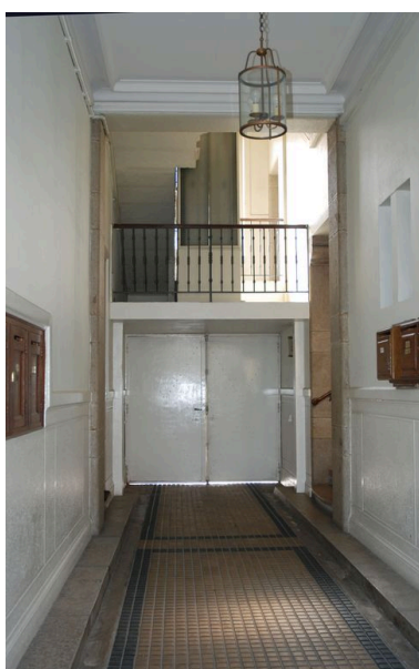
Vue intérieure : le passage cocher