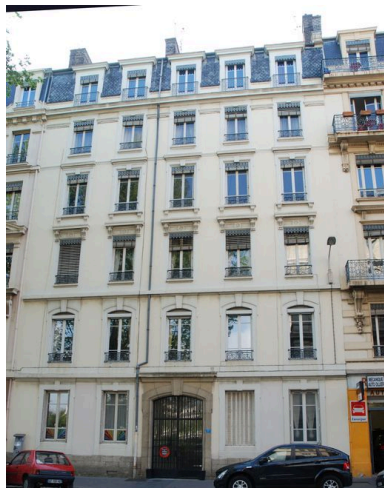
Vue générale IVR82_20126900872NUCA