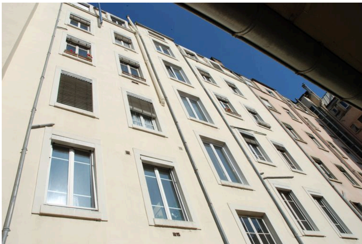
Vue du revers