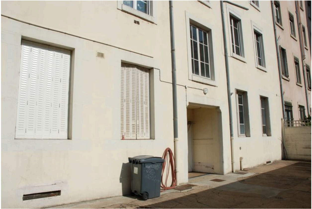
Détail du revers