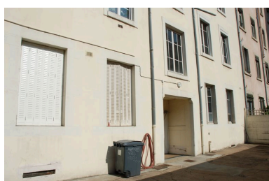
Détail du revers