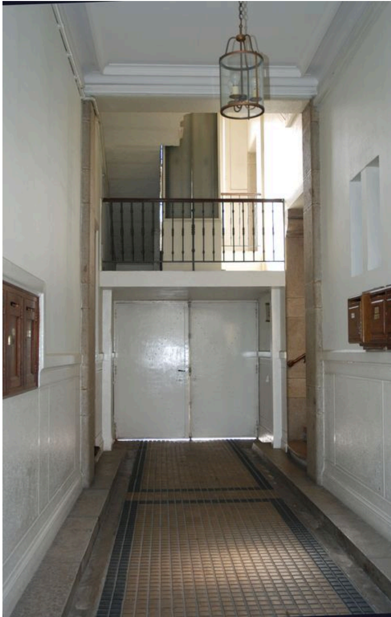
Vue intérieure : le passage cocher