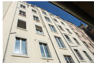
Vue du revers IVR82_20126900875NUCA