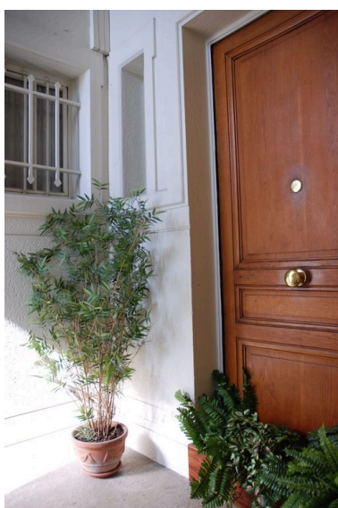
Vue d'un palier