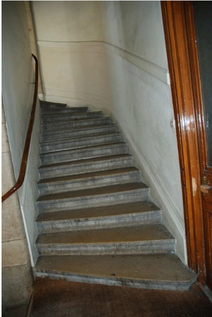
Vue du départ de l'escalier, première volée décalée