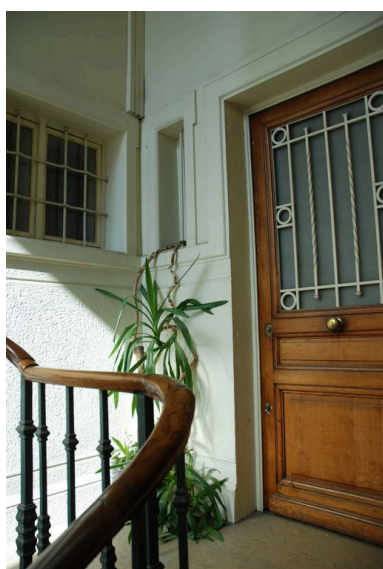
Vue d'un palier IVR82_20126900881NUCA