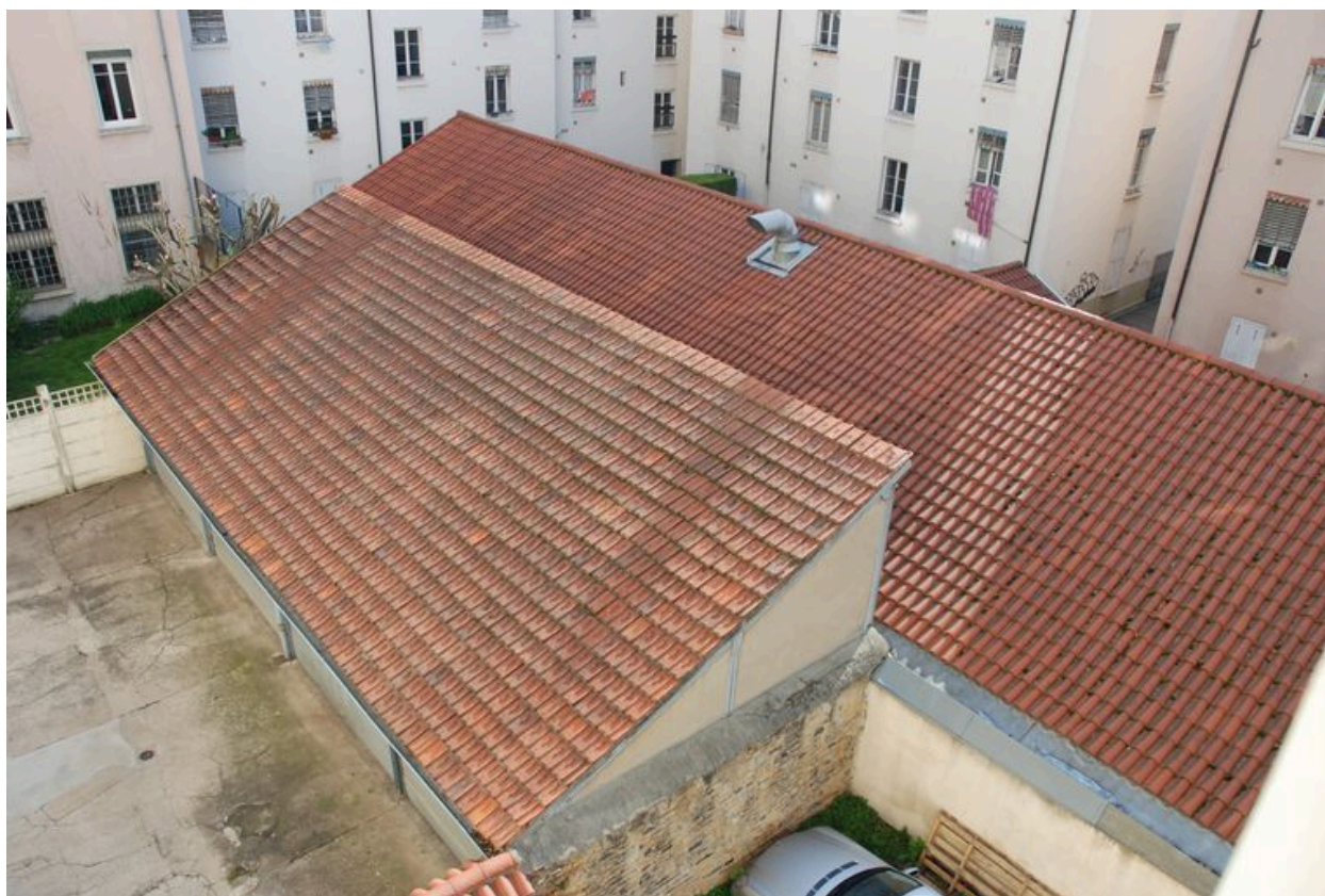
Vue des garages