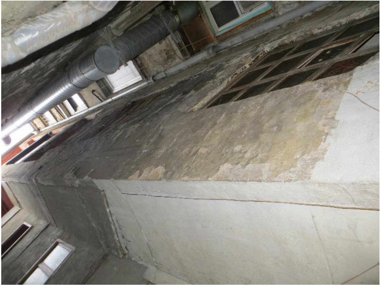
Elévations sur cour