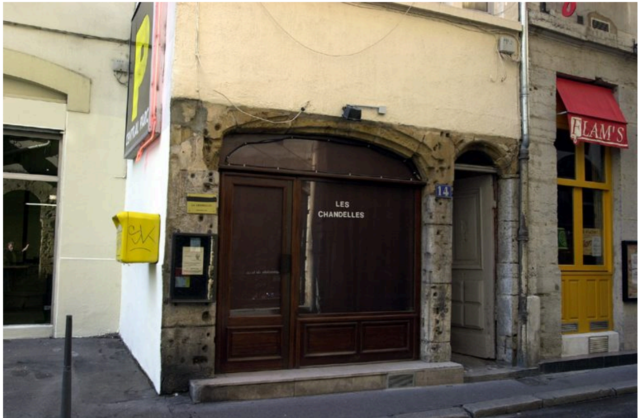
Élévation antérieure : le rez-de-chaussée