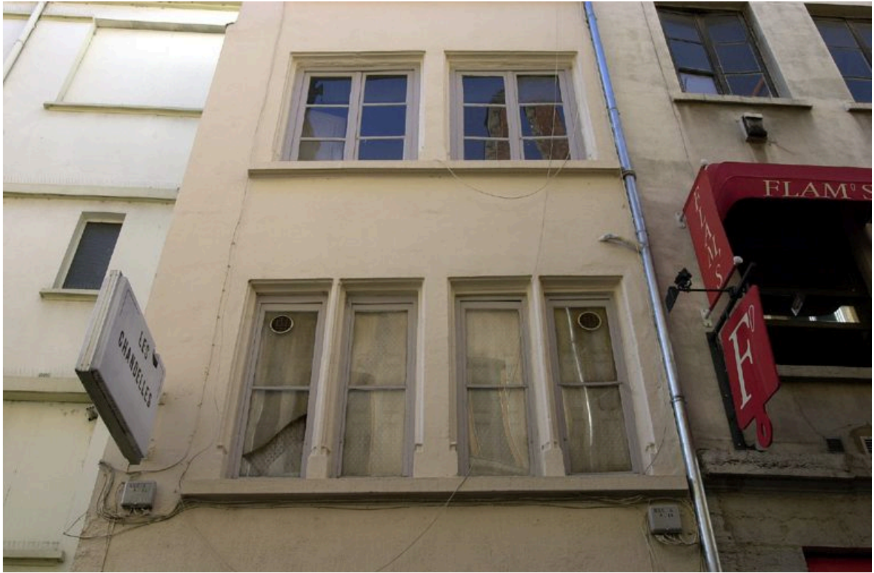
Elévation antérieure : les deux premiers étages carrés