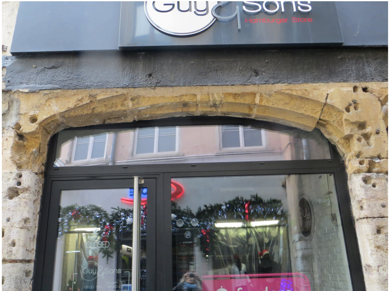
Rez-de-chaussée : détail de l'arc de boutique