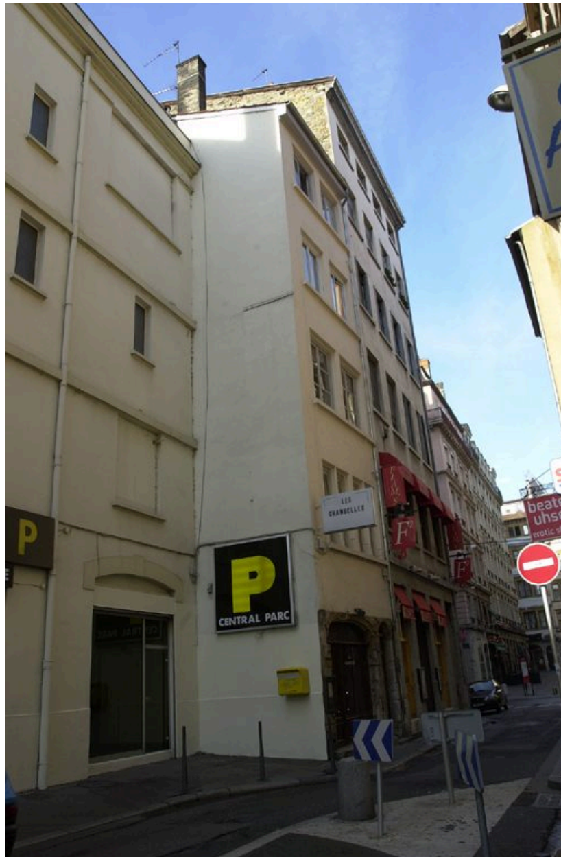
Vue de situation (2e immeuble à partir de la gauche)