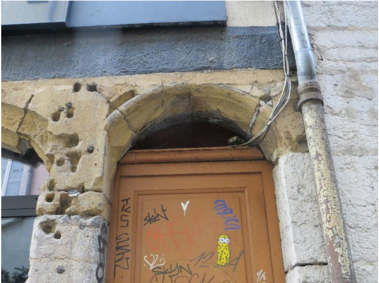
Rez-de-chaussée : détail de l'arc couvrant la porte piétonne