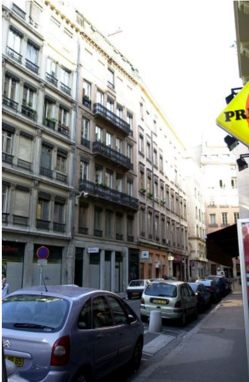
Façade sur rue, vue générale