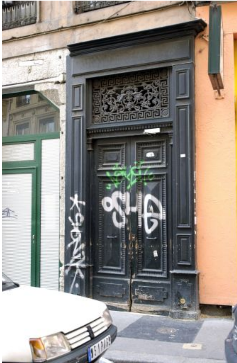
Façade sur rue, détail de la porte de l'allée conduisant à la cour commune