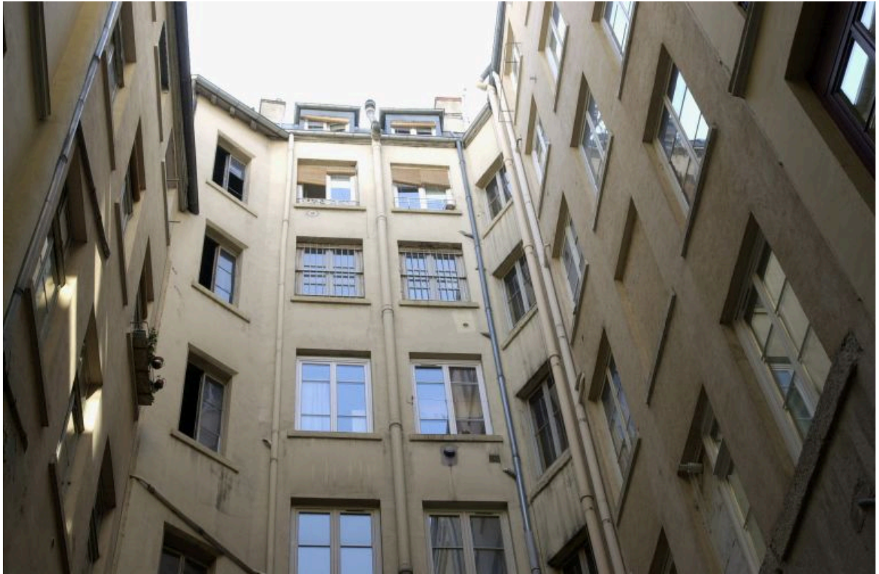
Façade sur la cour commune (au fond)