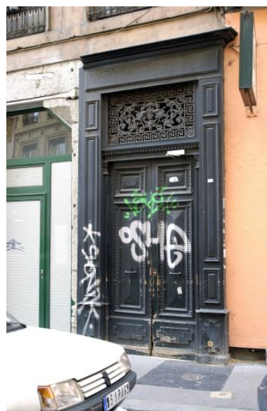
Façade sur rue, détail de la porte de l'allée conduisant à la cour commune