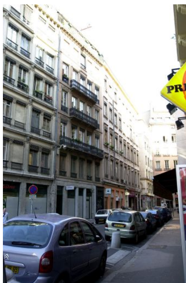
Façade sur rue, vue générale IVR82_20046900405NUCA