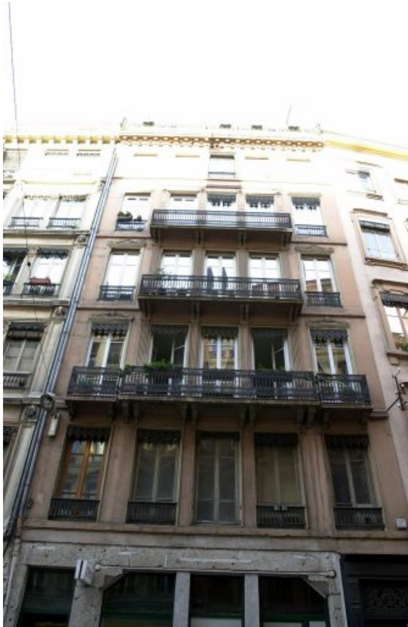
Façade sur rue, vue générale par-dessous