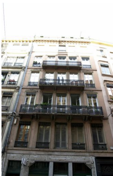
Façade sur rue, vue générale par-dessous IVR82_20046900406NUCA