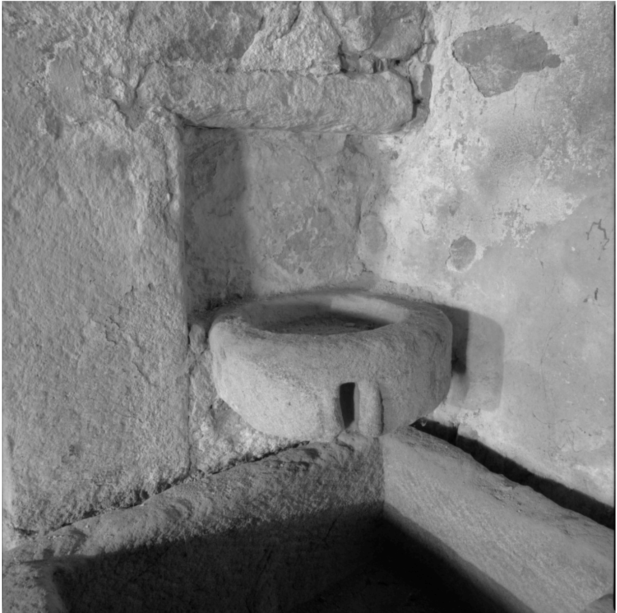
Logis, angle droit de la cheminée : élément de moulin à huile.