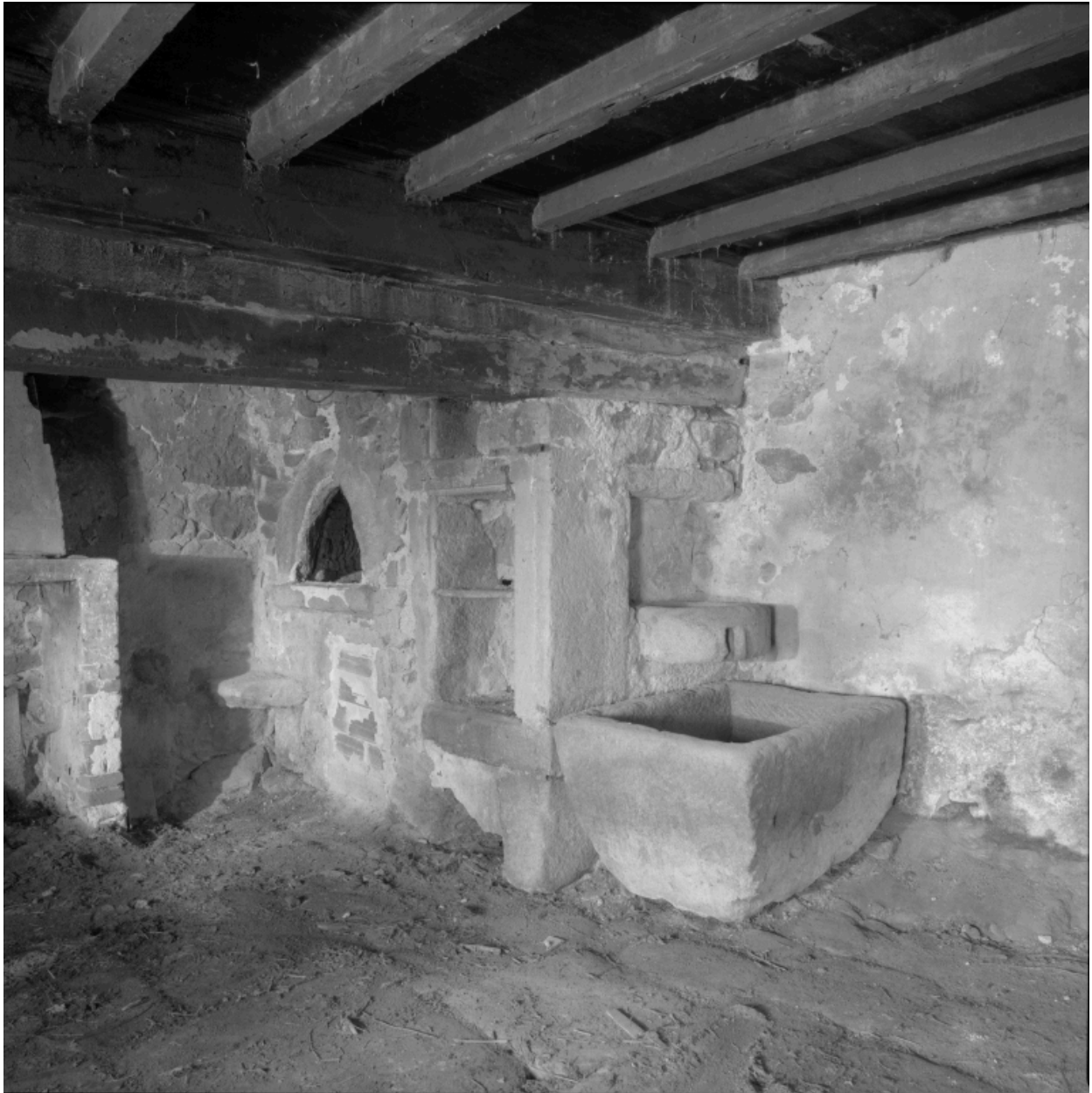
Logis, détail de l'angle droit de la cheminée avec four à pain, vasque en pierre et moulin à huile..