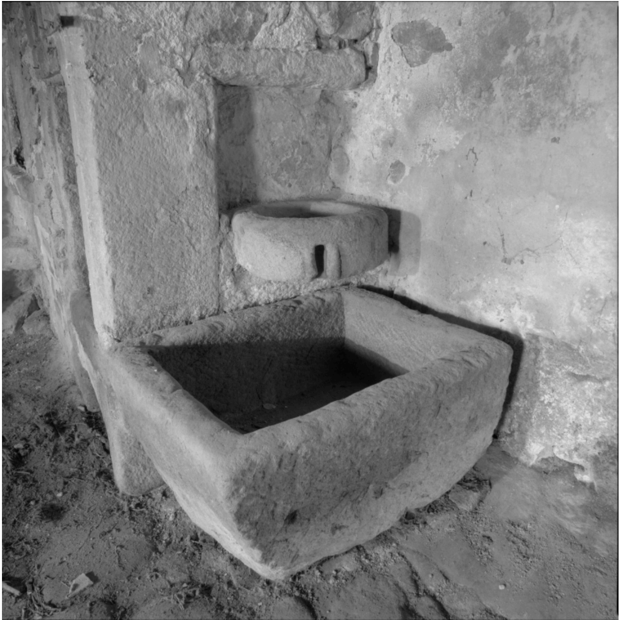
Logis, angle droit de la cheminée : vasque en pierre.