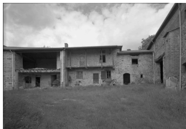
Vue d'ensemble de l'ancienne ferme. IVR82_20024200981P