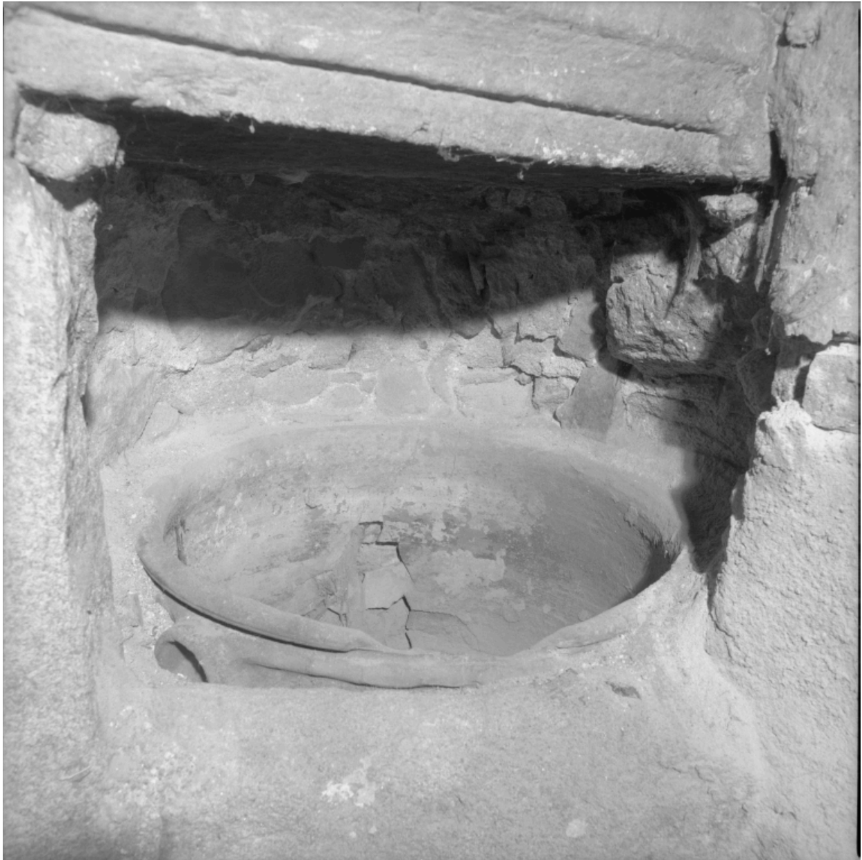
Logis, angle gauche de la cheminée, vasque en terre cuite.