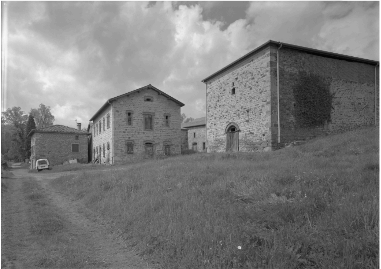
Vue d'ensemble d'une partie des communs (bâtiment à droite sur la photo), écuries à cheval et étables.