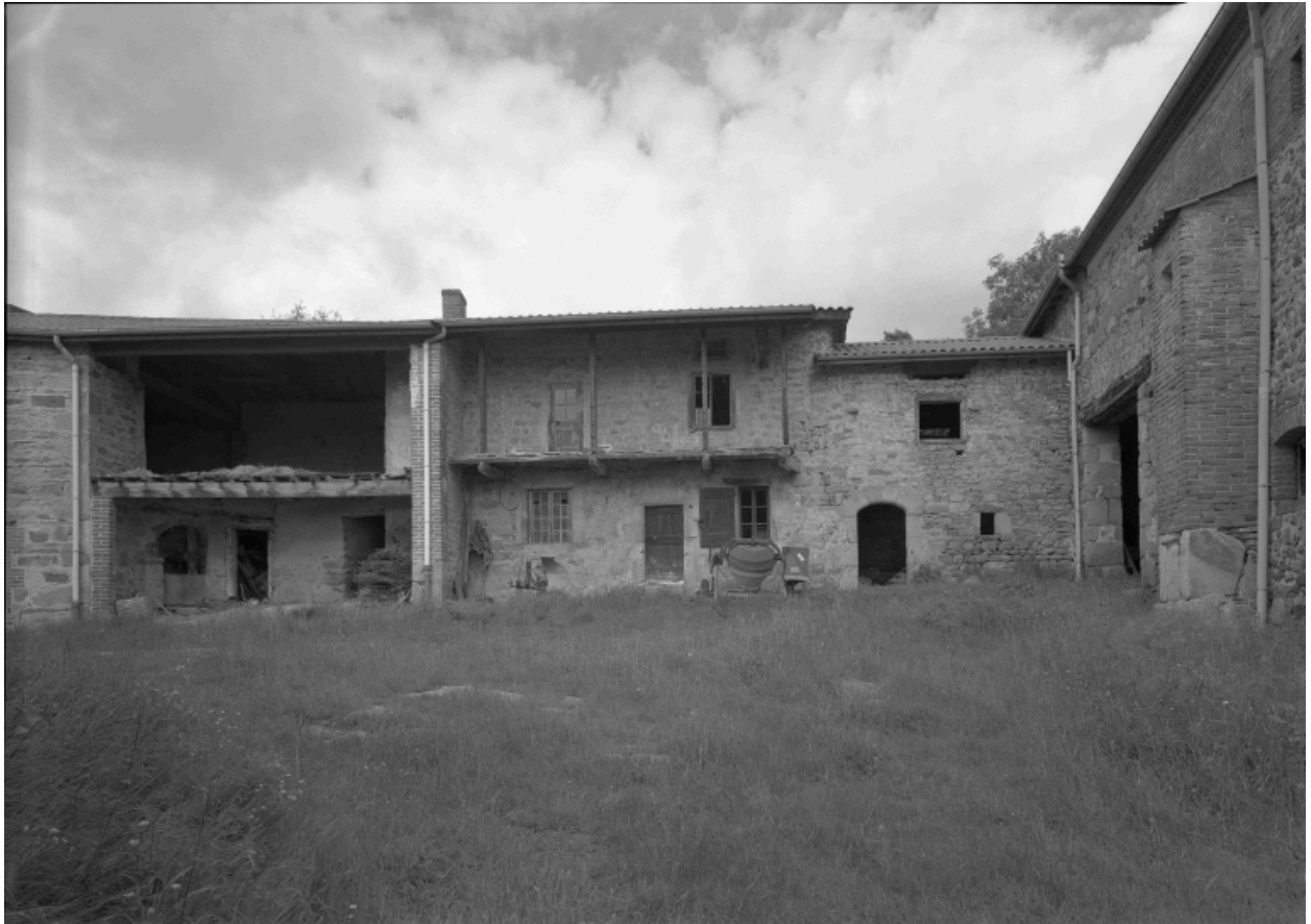
Vue d'ensemble de ll'ancienne ferme.