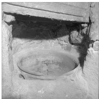
Logis, angle gauche de la cheminée, vasque en terre cuite.