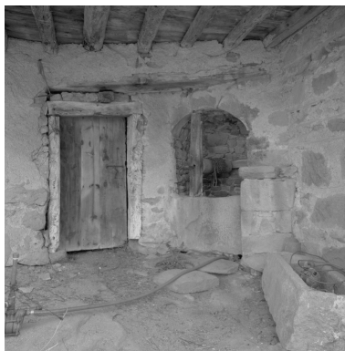
Partie annexe de la ferme. Détail de l'entrée avec son puits.