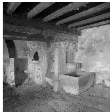
Logis, détail de l'angle droit de la cheminée avec four à pain, vasque en pierre et moulin à huile.. IVR82_20024200982X