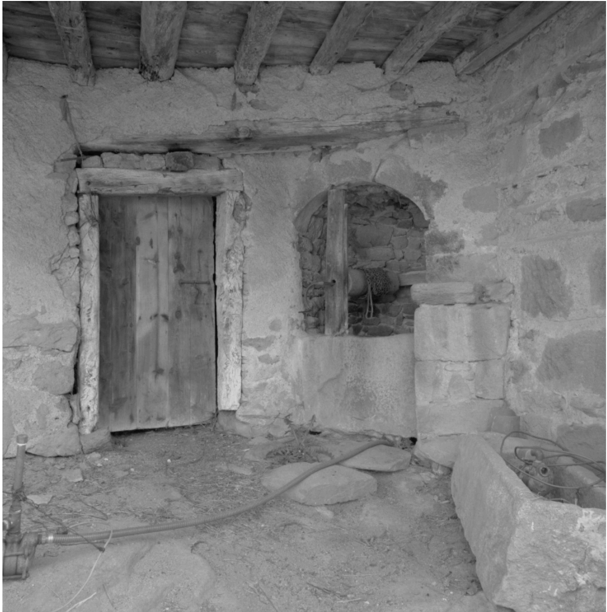
Partie annexe de la ferme. Détail de l'entrée avec son puits.