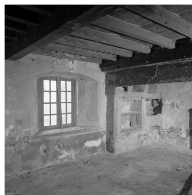
Logis, angle gauche de la cheminée : avec placard mural et vasque en terre cuite.