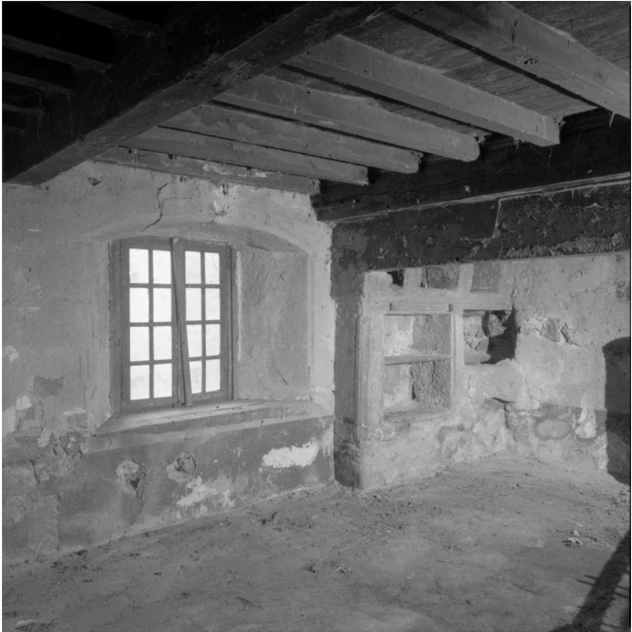
Logis, angle gauche de la cheminée, avec placard mural et vasque en terre cuite.