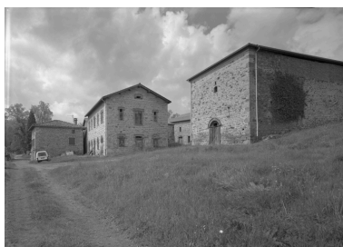
Vue d'ensemble d'une partie des communs (bâtiment à droite sur la photo), écuries à cheval et étables.