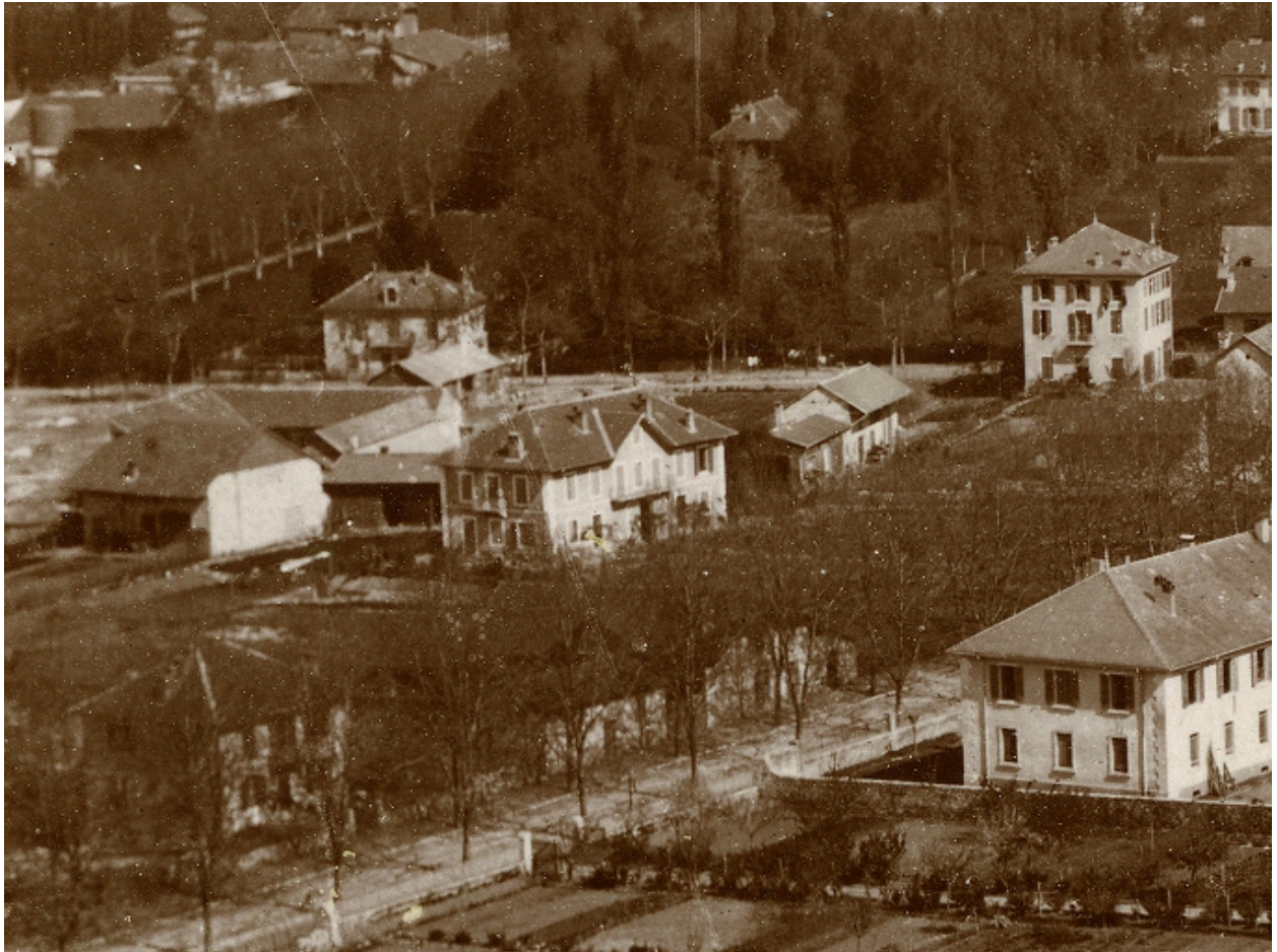
Vue aérienne de la villa au centre, vers 1885