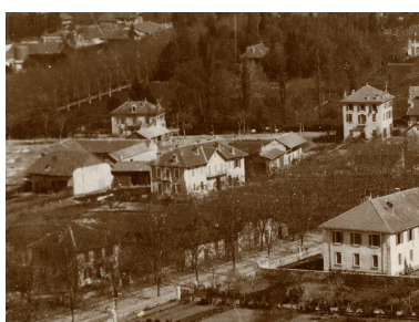
Vue aérienne de la villa au centre, vers 1885