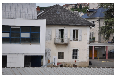
Élévation latérale IVR82_20127301098NUCA