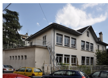
Vue générale IVR82_20127301099NUCA