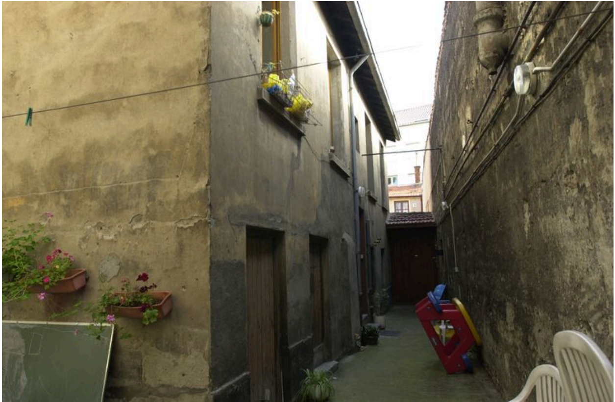
La cour étroite entre la maison en milieu de parcelle et l'atelier depuis le sud