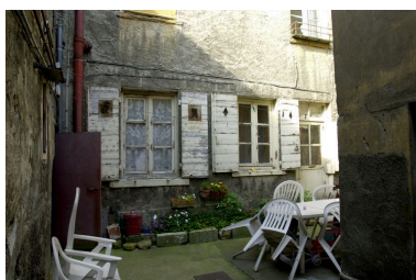
Elévation est de la 1ère maison en milieu de parcelle IVR82_20106903481NUCA