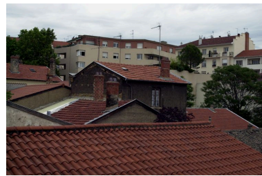
Vue d'ensemble de la maison en milieu de parcelle depuis le nord ; à droite l'atelier