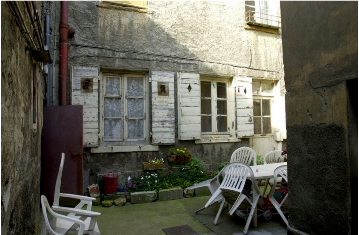
Elévation est de la 1ère maison en milieu de parcelle