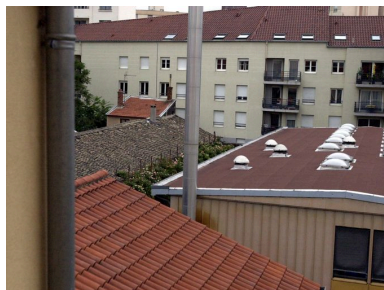
Le toit de l'atelier et la maison en fond de parcelle IVR82_20106903480NUCA