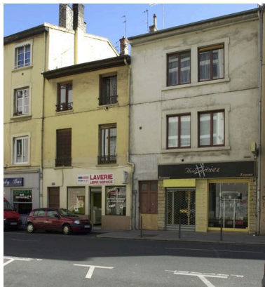
Elévation sur rue IVR82_20106903476NUCA