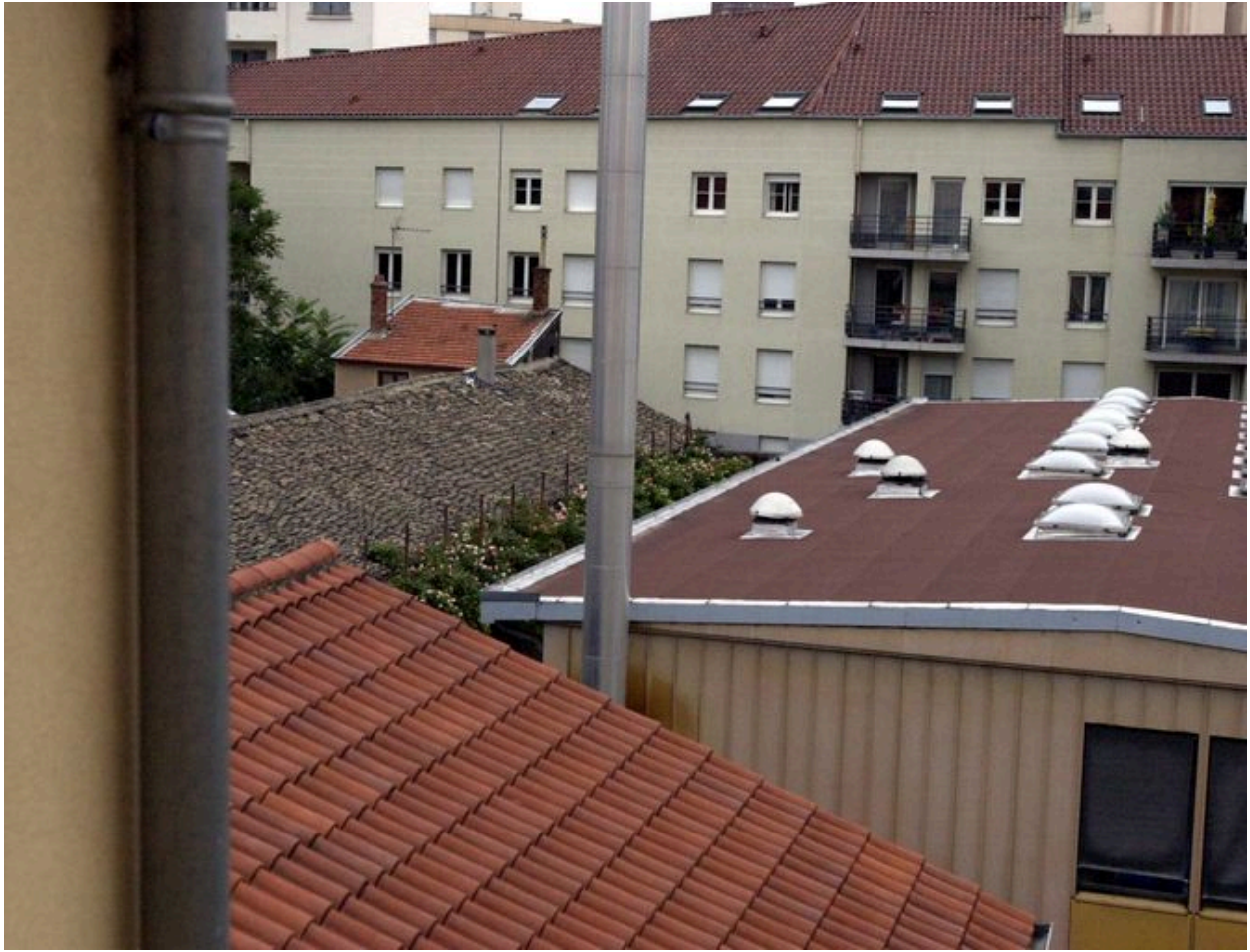
Le toit de l'atelier et la maison en fond de parcelle