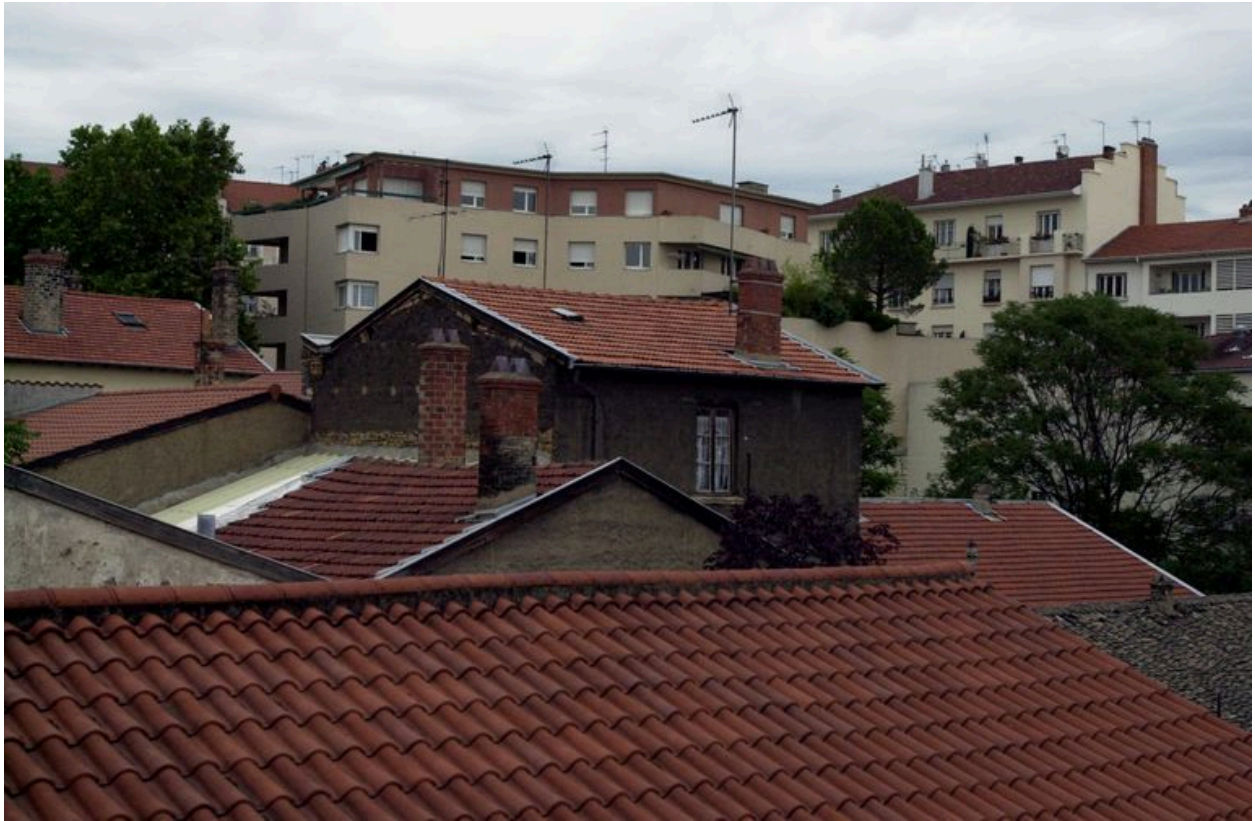
Vue d'ensemble de la maison en milieu de parcelle depuis le nord ; à droite l'atelier