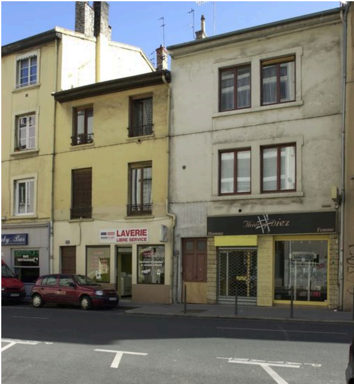
Elévation sur rue