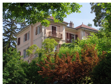
Vue prise du sud-ouest IVR82_20067300486NUCA