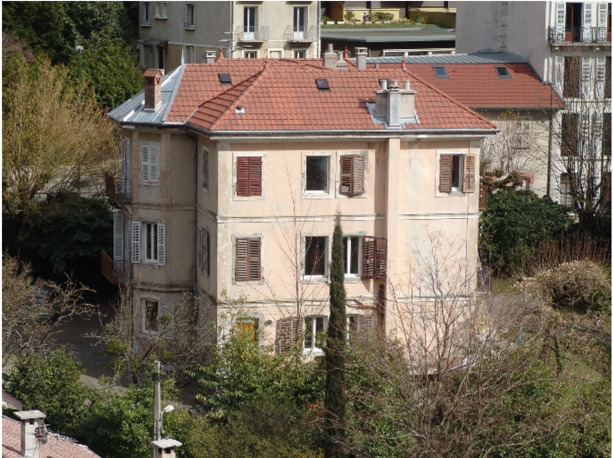
Elévation latérale gauche