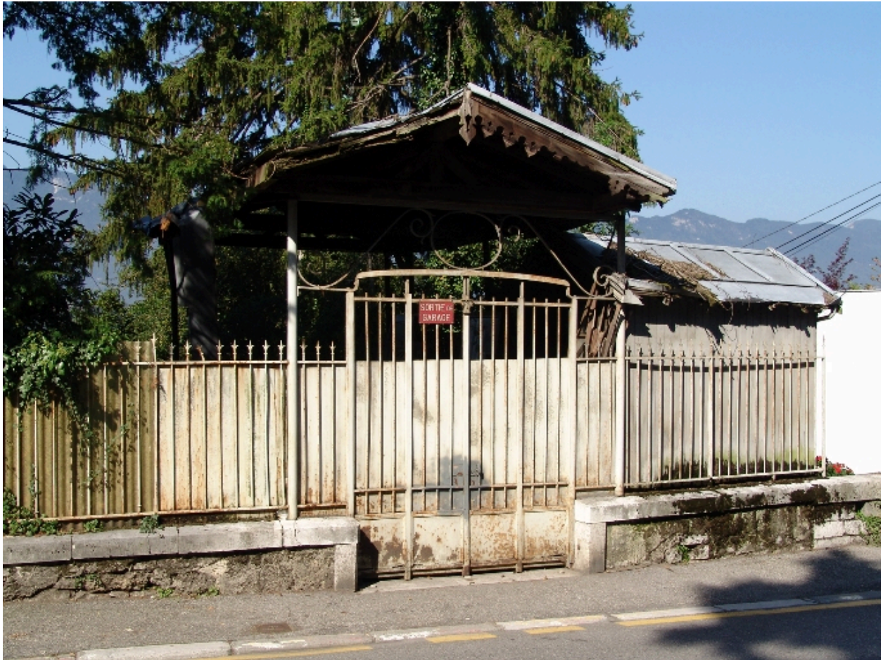
Entrée sur le boulevard