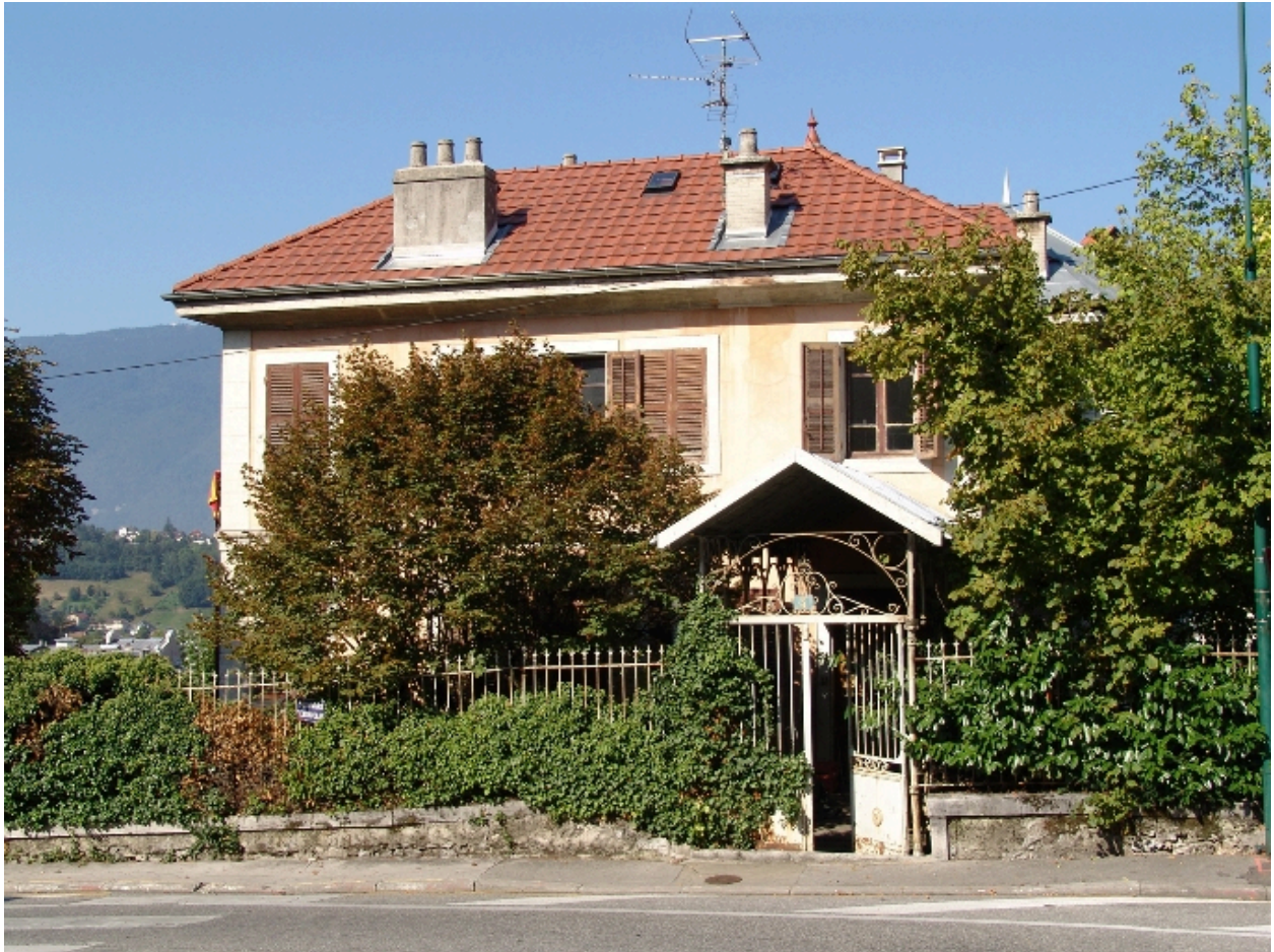
Elévation latérale droite