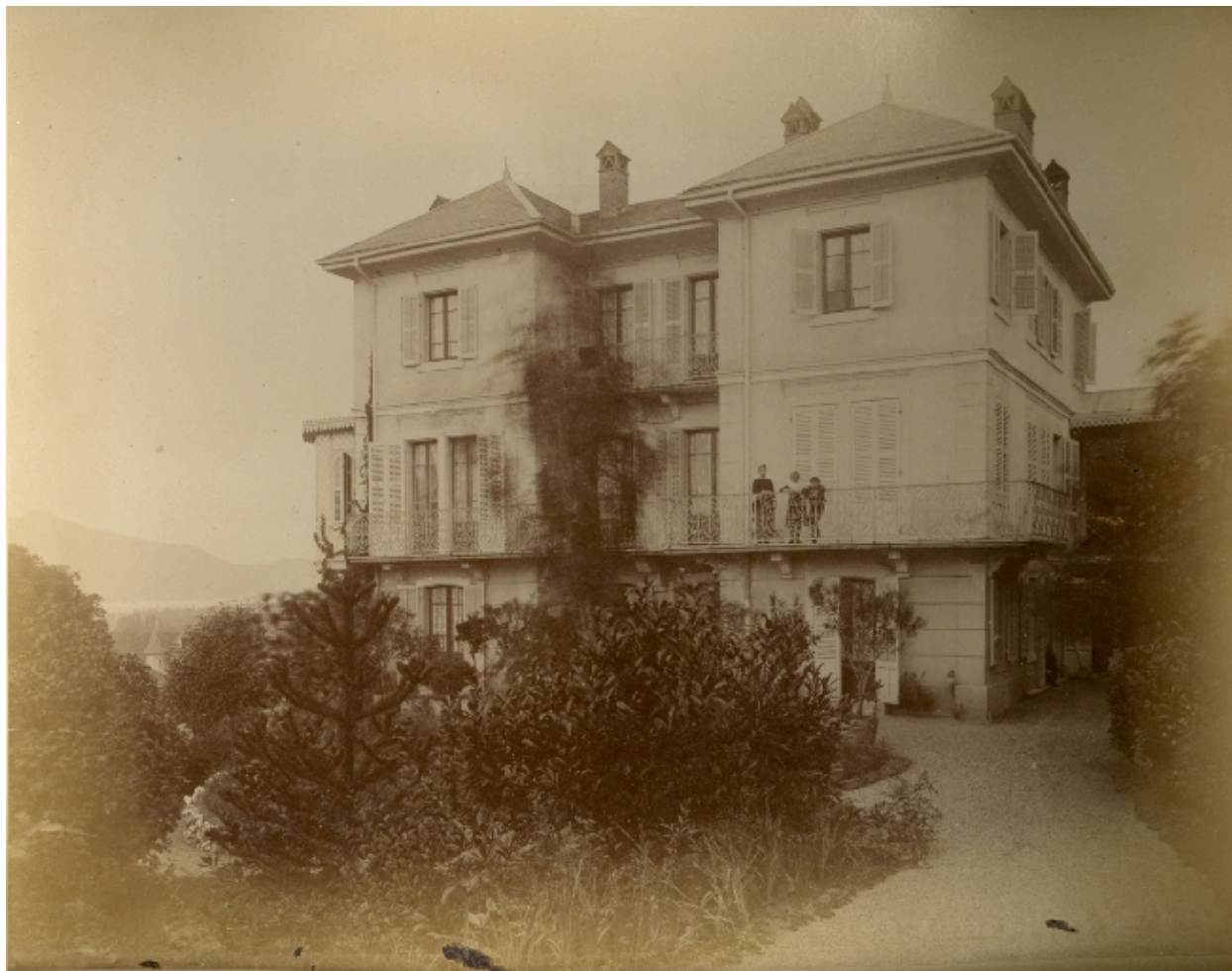
Vue générale, fotogr. ancienne