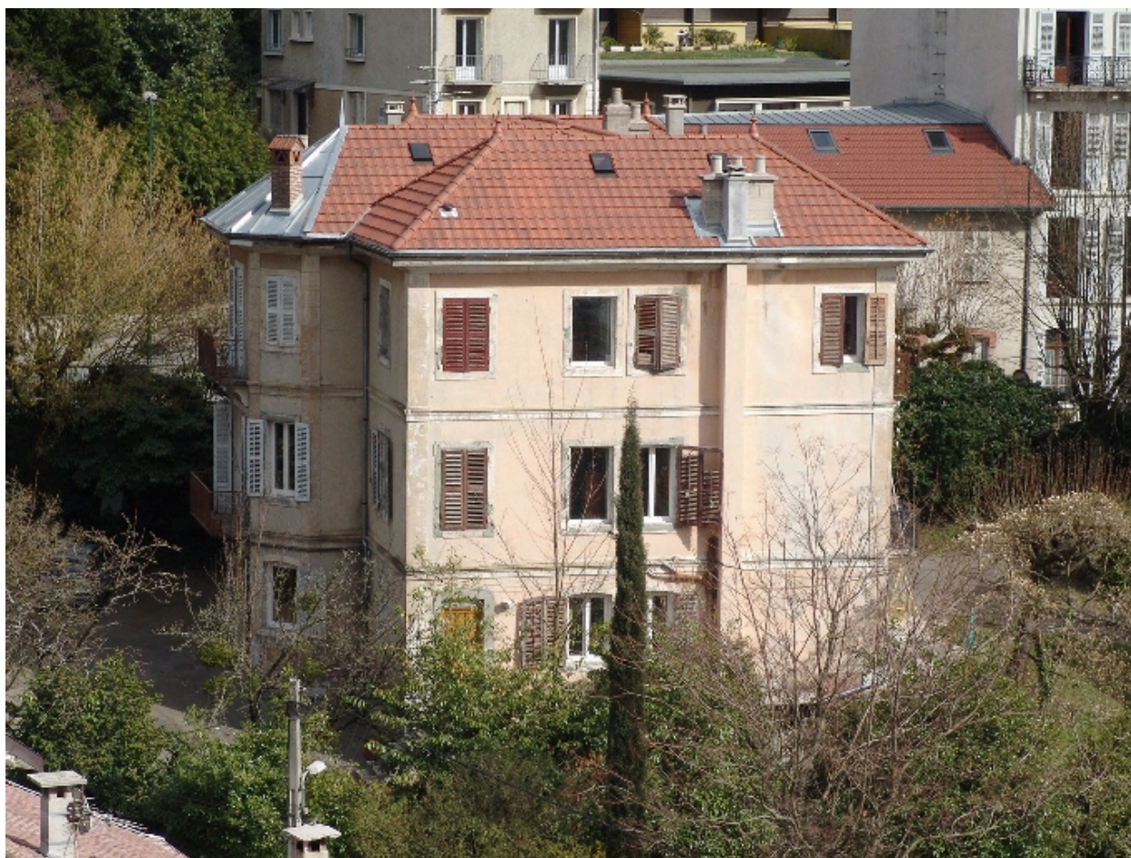
Elévation latérale gauche