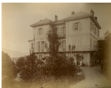
Vue générale, fotogr. ancienne