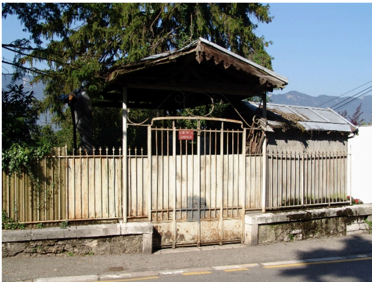
Entrée sur le boulevard