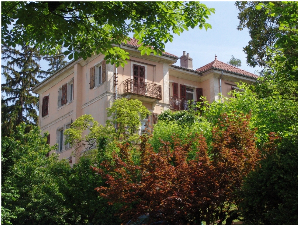
Vue prise du sud-ouest