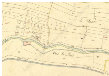
Premier cadastre français, 1892 IVR82_20127301777NUCA