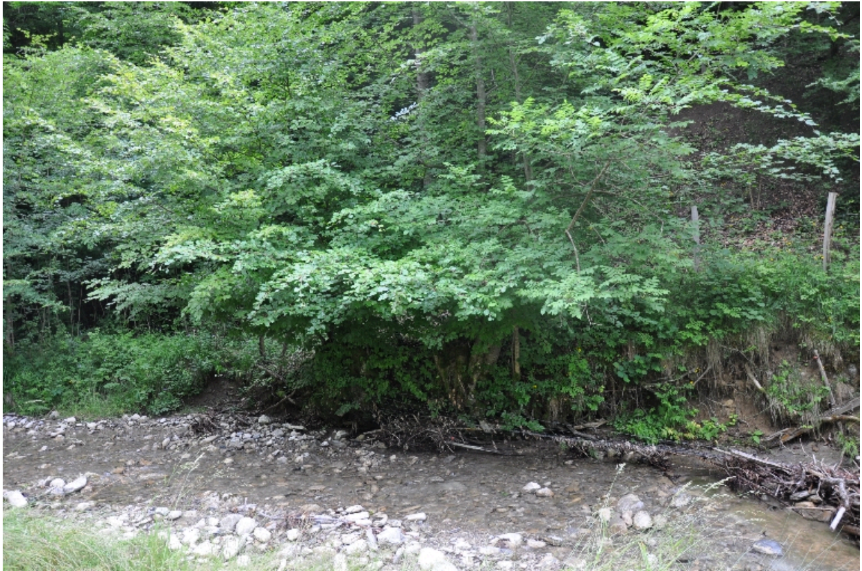
Emplacement de l'ancienne scierie Dunand