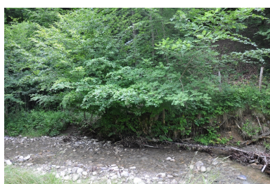
Emplacement de l'ancienne scierie Dunand