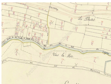
Cadastre rénové, 1964 IVR82_20127301778NUCA