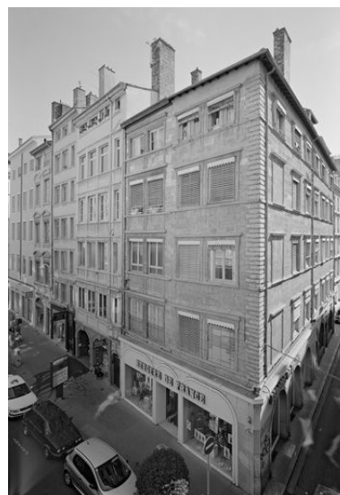
Façade rue de Brest, vue générale

Dess. Paul Cherblanc IVR82_20056902785NUD