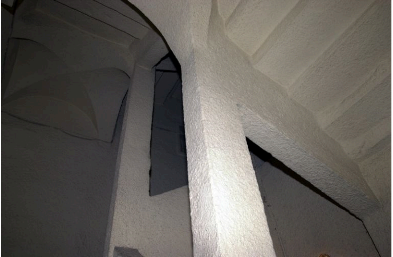
Deuxième étage d'escalier, vue prise depuis le premier repos