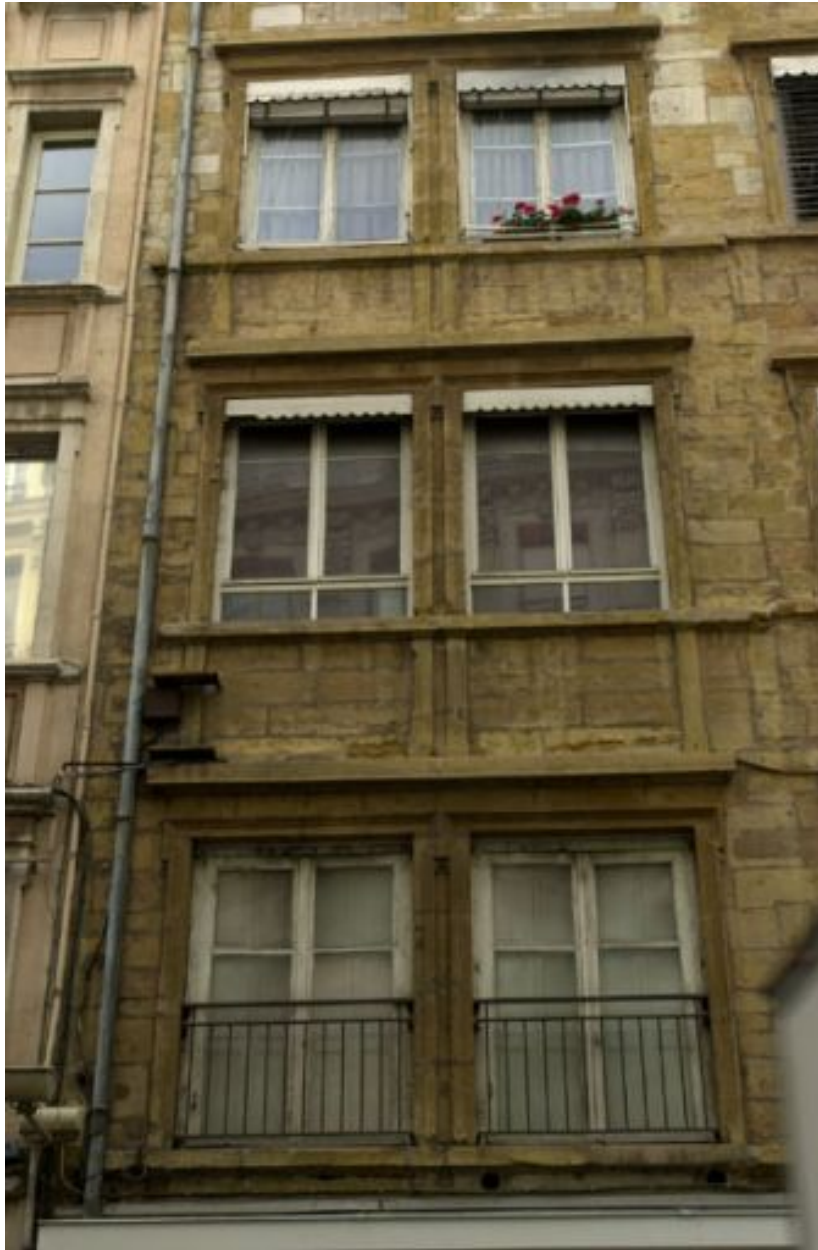
Façade rue de Brest, niveaux 2 à 4