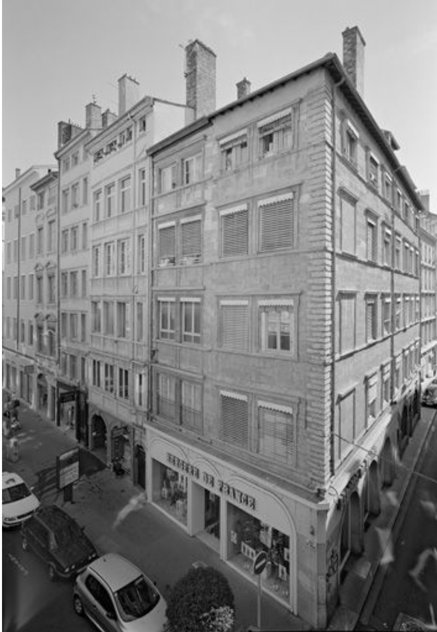
Façade rue de Brest, vue générale