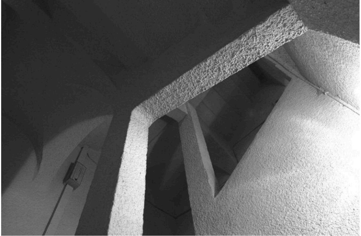
Deuxième étage d'escalier, vue prise depuis la première volée