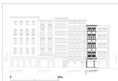
Elévation de la façade, d'après un relevé photogrammétrique par A. Bensaci, 2003

Dess. Paul Cherblanc IVR82_20056902734NUDA