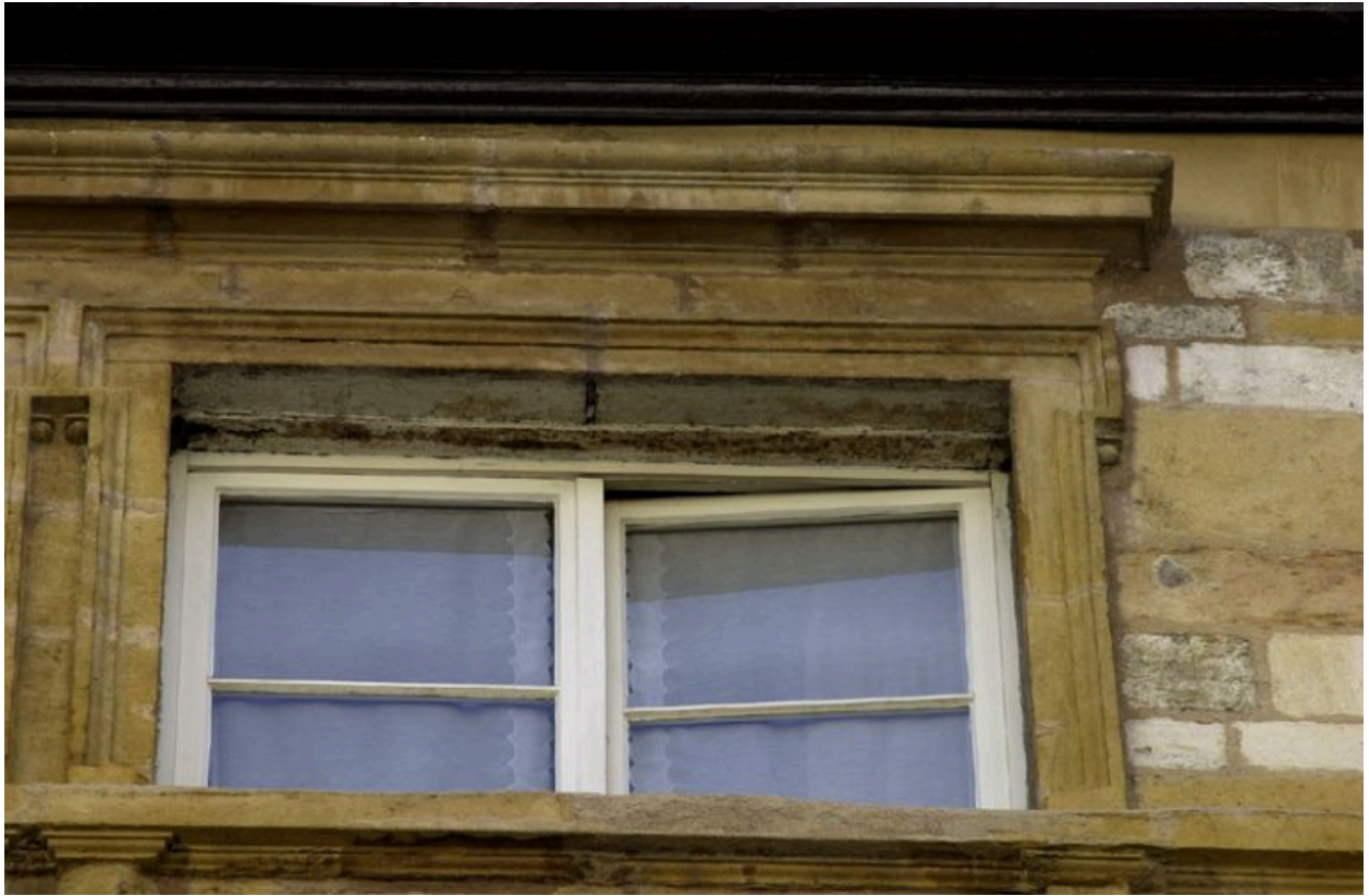
Façade rue de Brest, 5e niveau, détail d'une fenêtre