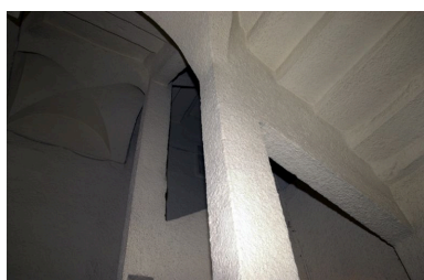
Deuxième étage d'escalier, vue prise depuis le premier repos IVR82_20056900423NUCA