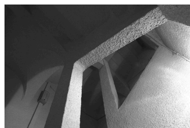
Deuxième étage d'escalier, vue prise depuis la première volée IVR82_20056900422NUC