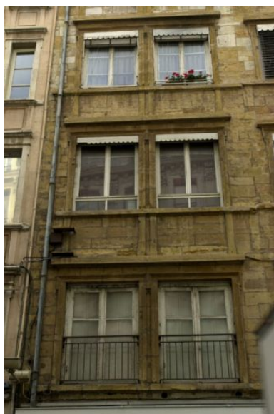
Façade rue de Brest, niveaux 2 à 4 IVR82_20046900751NUCA