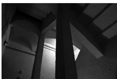
Deuxième étage d'escalier, autre vue prise depuis le premier repos IVR82_20056900424NUC