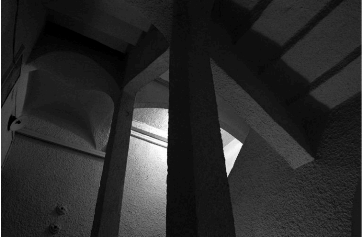
Deuxième étage d'escalier, autre vue prise depuis le premier repos