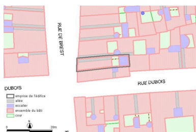
Plan-masse, d'après le système urbain de référence, version 1999

Dess. Paul Cherblanc IVR82_20056902734NUDA