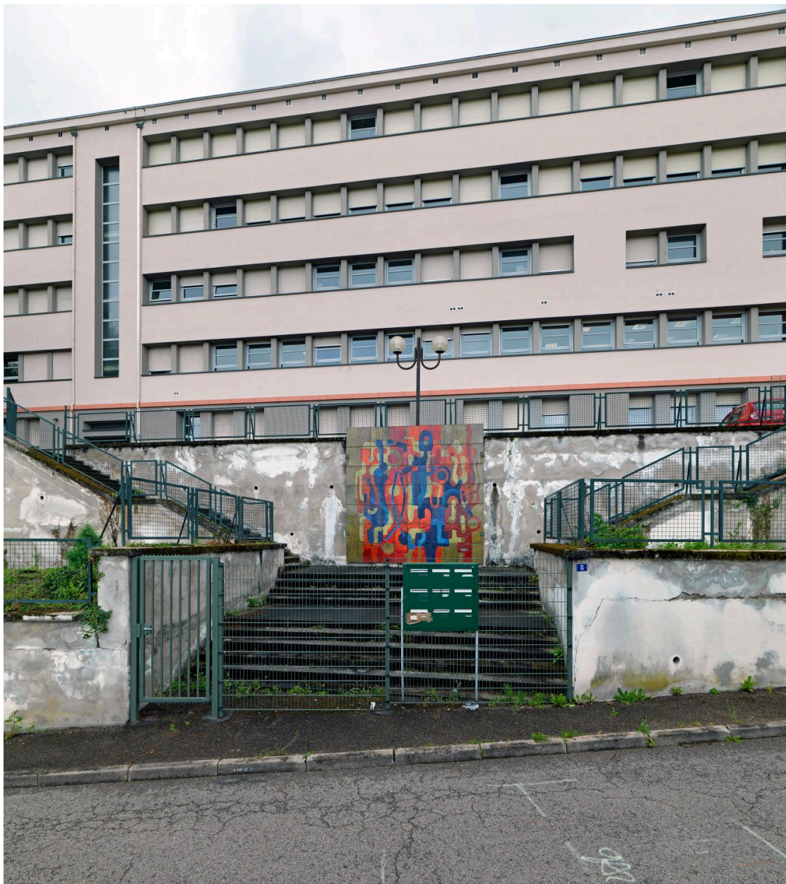
L'oeuvre dans son environnement