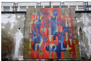
Autre vue d'ensemble (2007) IVR84_20206900714NUCAB