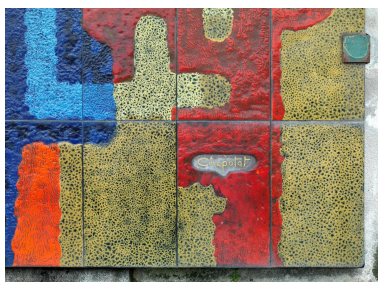
Détail de la signature IVR84_20216900680NUCA