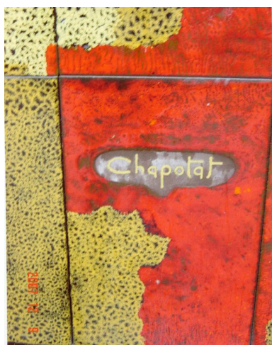
Signature (2007).