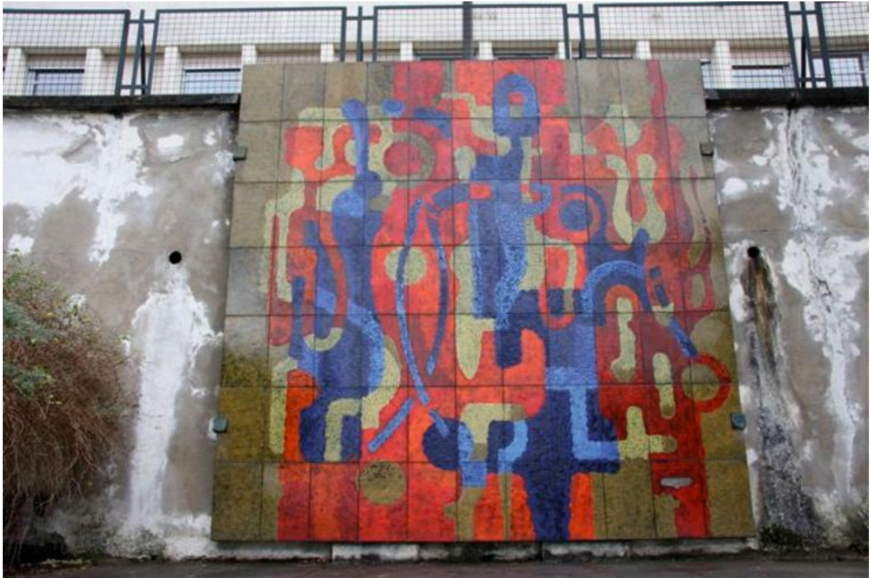
Autre vue d'ensemble (2007)