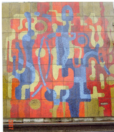
Vue d'ensemble (2007) IVR84_20206900715NUCAB