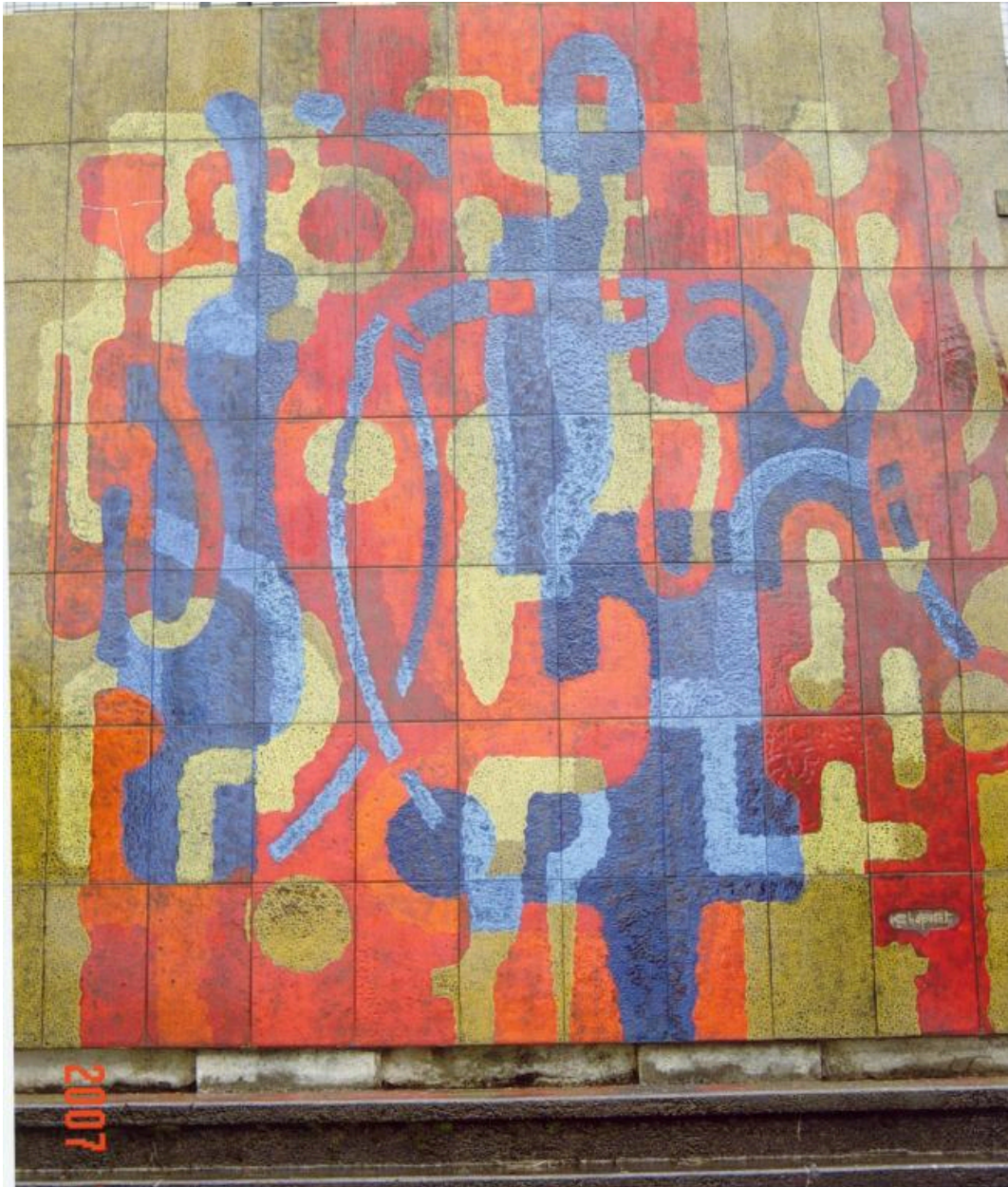
Vue d'ensemble (2007)