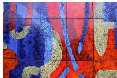
Détail (2007) IVR84_20206900713NUCAB