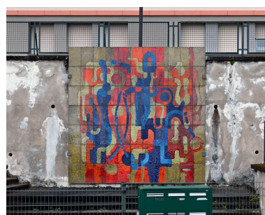
Vue d'ensemble IVR84_20216900677NUCAQ