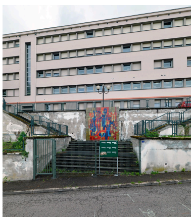
L'oeuvre dans son environnement IVR84_20216900676NUCAQ