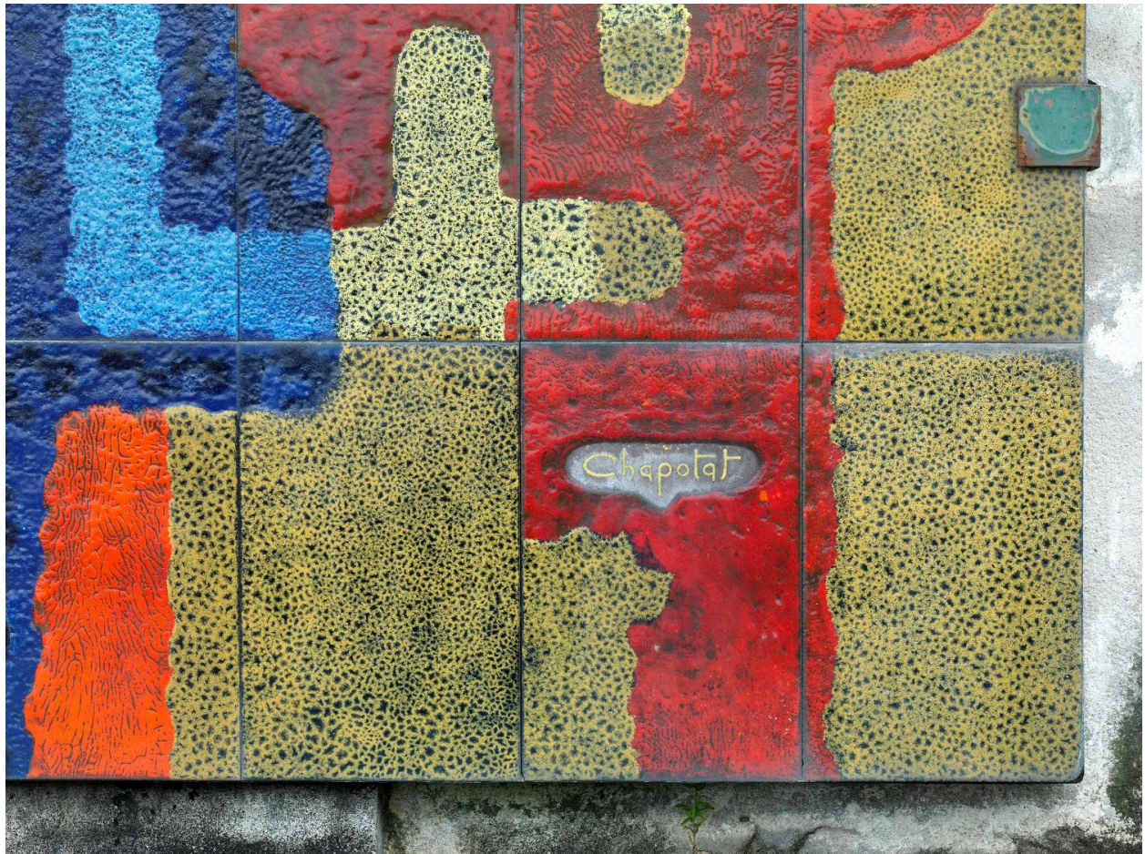
Détail de la signature