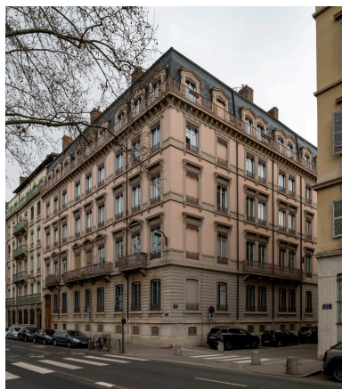
Vue générale IVR84_20216900387NUCA

Vitet, puis P. Vitet successeur, puis Vitet-Charbonnel, puis Charbonnel IVR84_20206900956NUCA