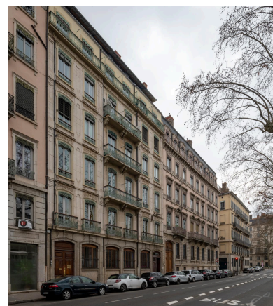
Vue de situation depuis le nord IVR84_20216900388NUCA