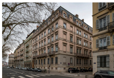
Vue de situation IVR84_20216900386NUCA