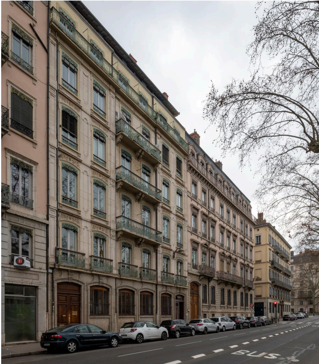
Vue de situation depuis le nord