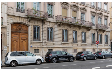
Le rez-de-chaussée