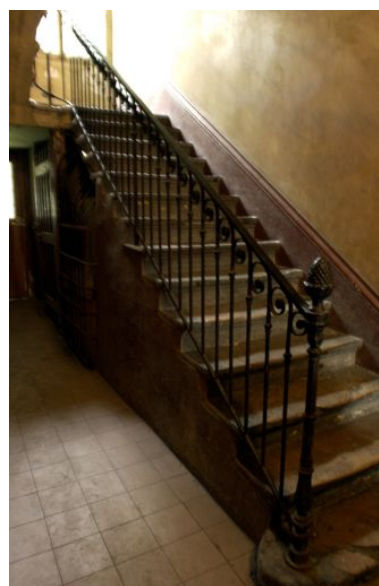
Vue de la montée d'escalier IVR82_20016900232NUCA