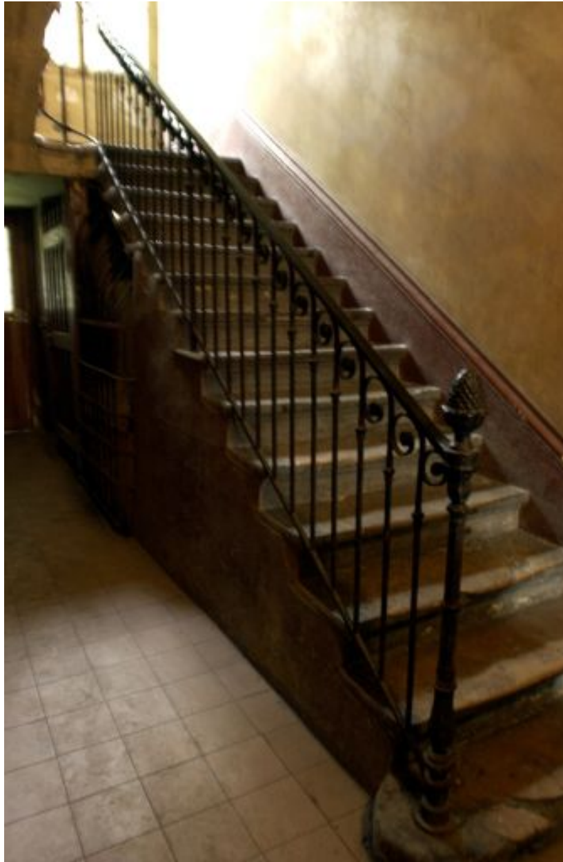
Vue de la montée d'escalier