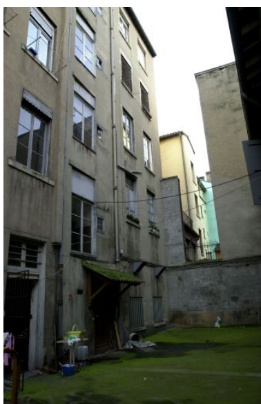
Elévation postérieure IVR82_20016900231NUCA