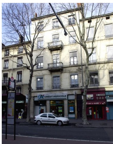
Elévation principale IVR82_20016900230NUCA