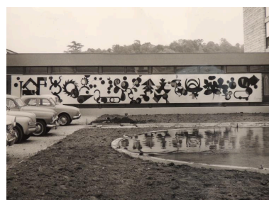
Vue d'ensemble de l'œuvre en 1963 (AN 20020101/64).