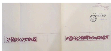
Frise décorative : "Techniques nouvelles" : schémas de principe et maquettes, 1961 (AN 19880466/33).

Autr. Jacques Lagrange, Repro. Valérie Pamart IVR84_20207300006NUCA