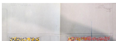
Frise décorative : "Techniques nouvelles" : schémas de principe et maquettes, 1961 (AN 19880466/33)

Autr. Jacques Lagrange IVR84_20207300008NUCB