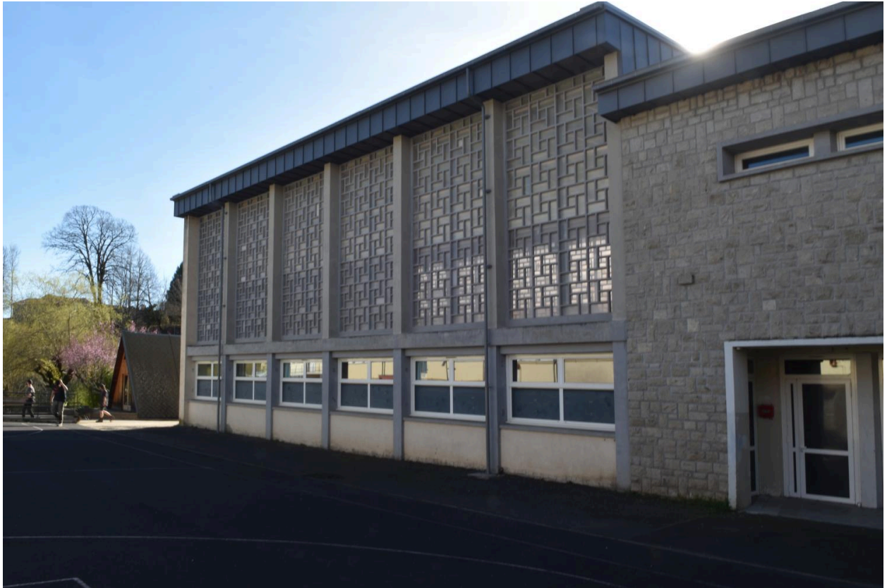
Le gymnase, depuis le nord