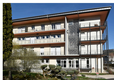
Bâtiment de l'administration, depuis l'ouest IVR84_20241500056NUCA