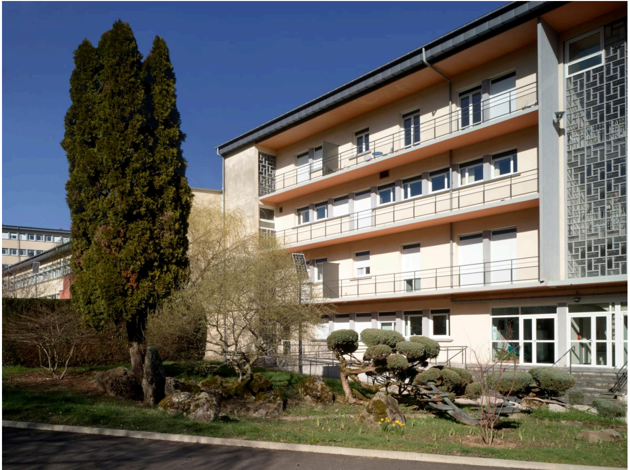
Bâtiment de l'administration, depuis le sud-ouest