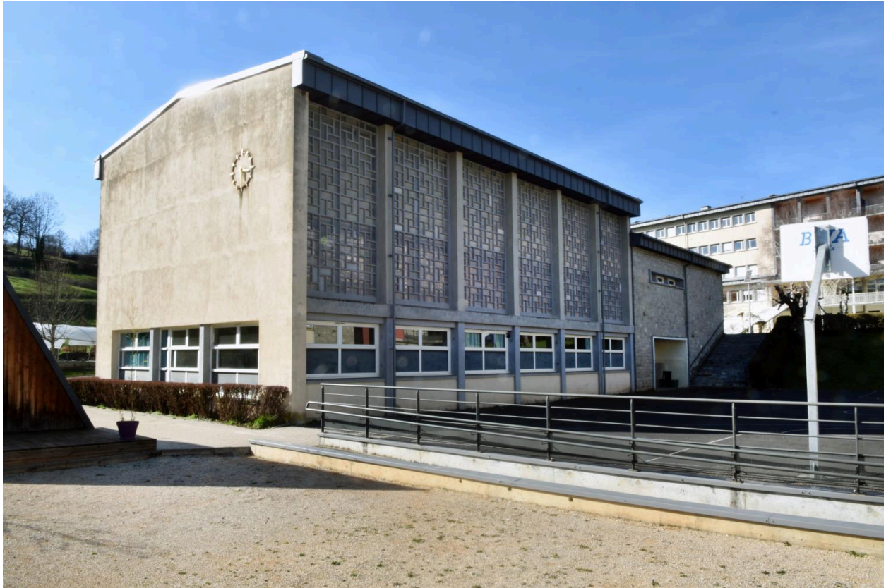
Le gymnase, depuis le sud