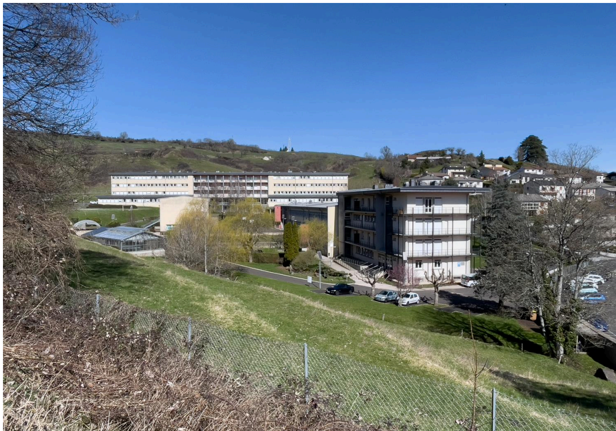
Vue générale, depuis le sud-ouest