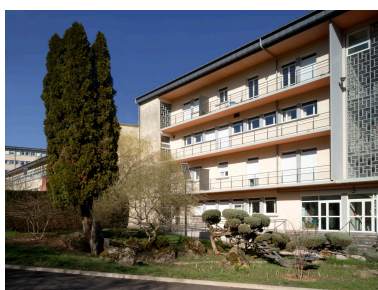
Bâtiment de l'administration, depuis le sud-ouest IVR84_20241500108NUCA