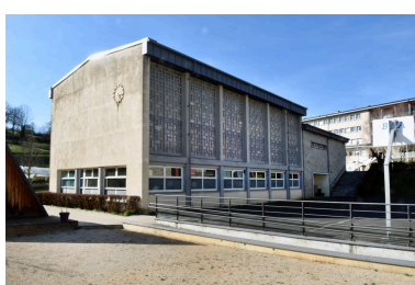
Le gymnase, depuis le sud IVR84_20241500053NUCA