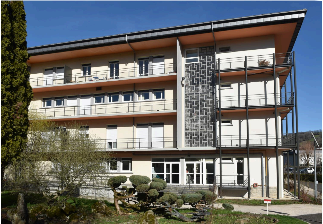
Bâtiment de l'administration, depuis l'ouest