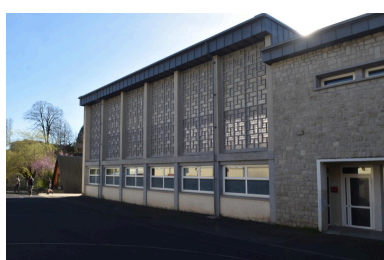
Le gymnase, depuis le nord IVR84_20241500052NUCA