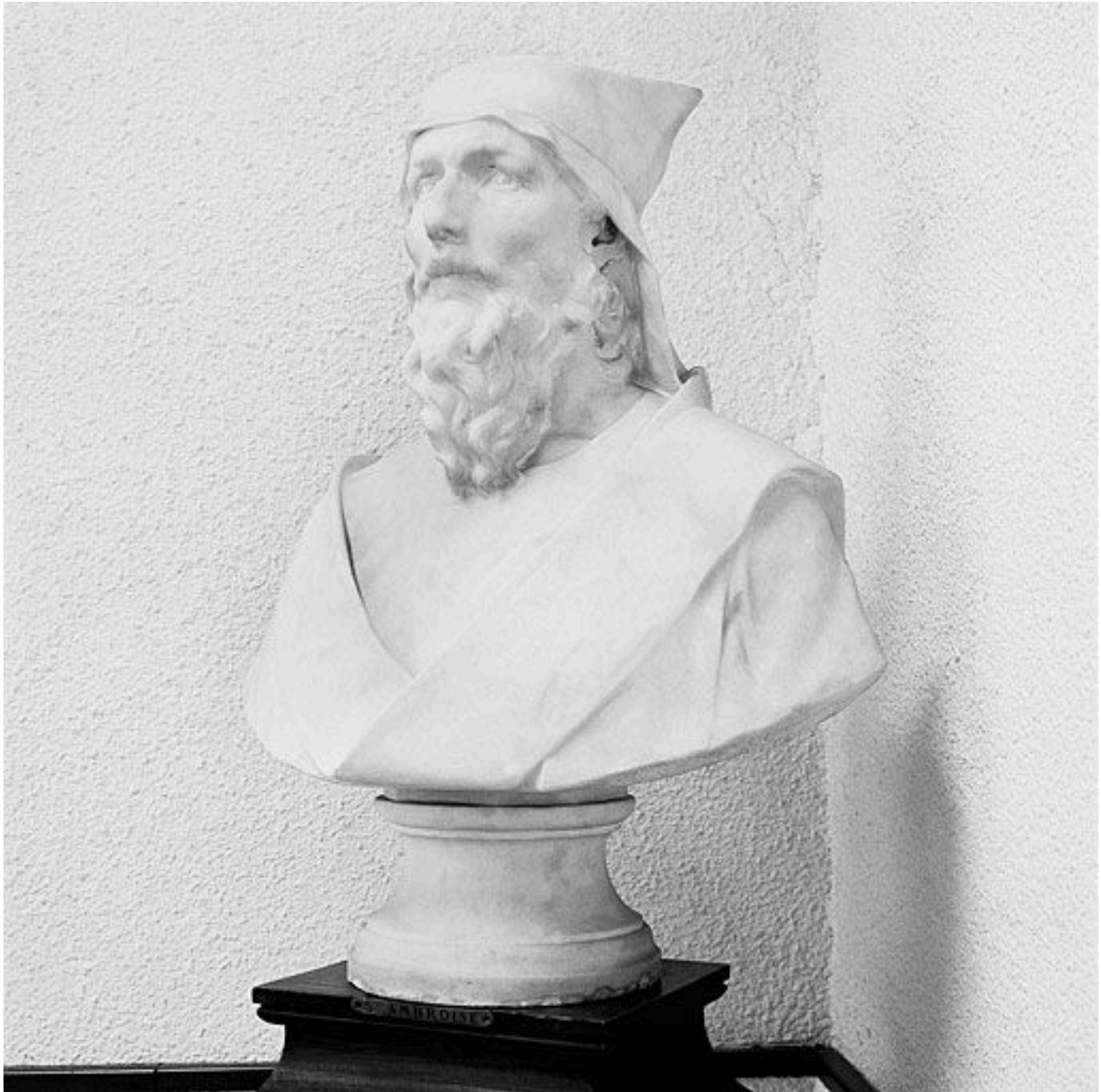
Vue de trois-quarts avant gauche