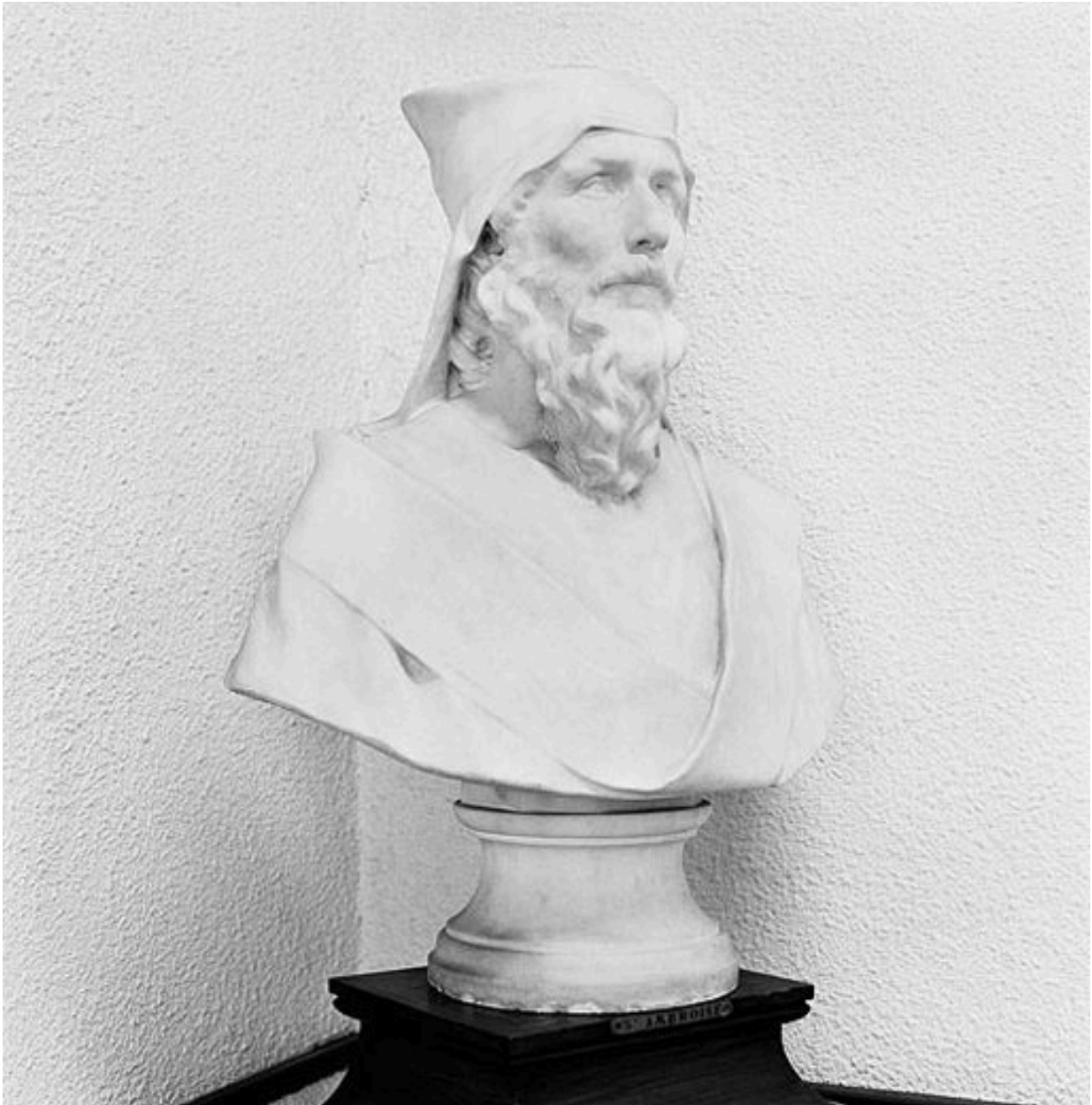
Vue de trois-quarts avant droit