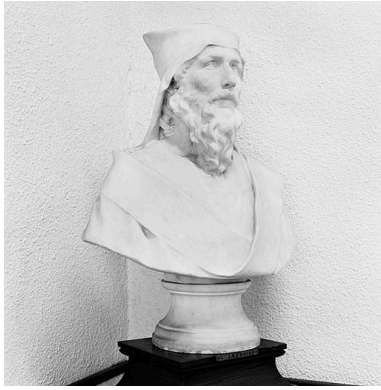
Vue de trois-quarts avant droit IVR82_20036903742X