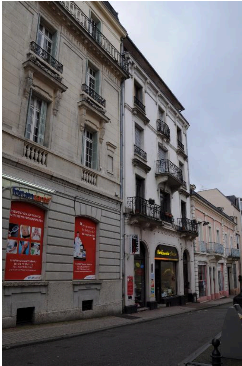
Immeuble à droite : façade sur rue