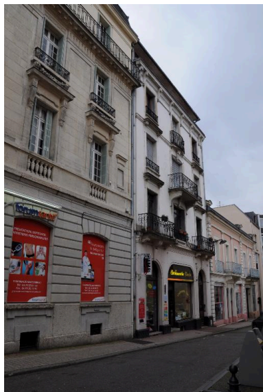
Immeuble à droite : façade sur rue IVR82_20147300339NUCA