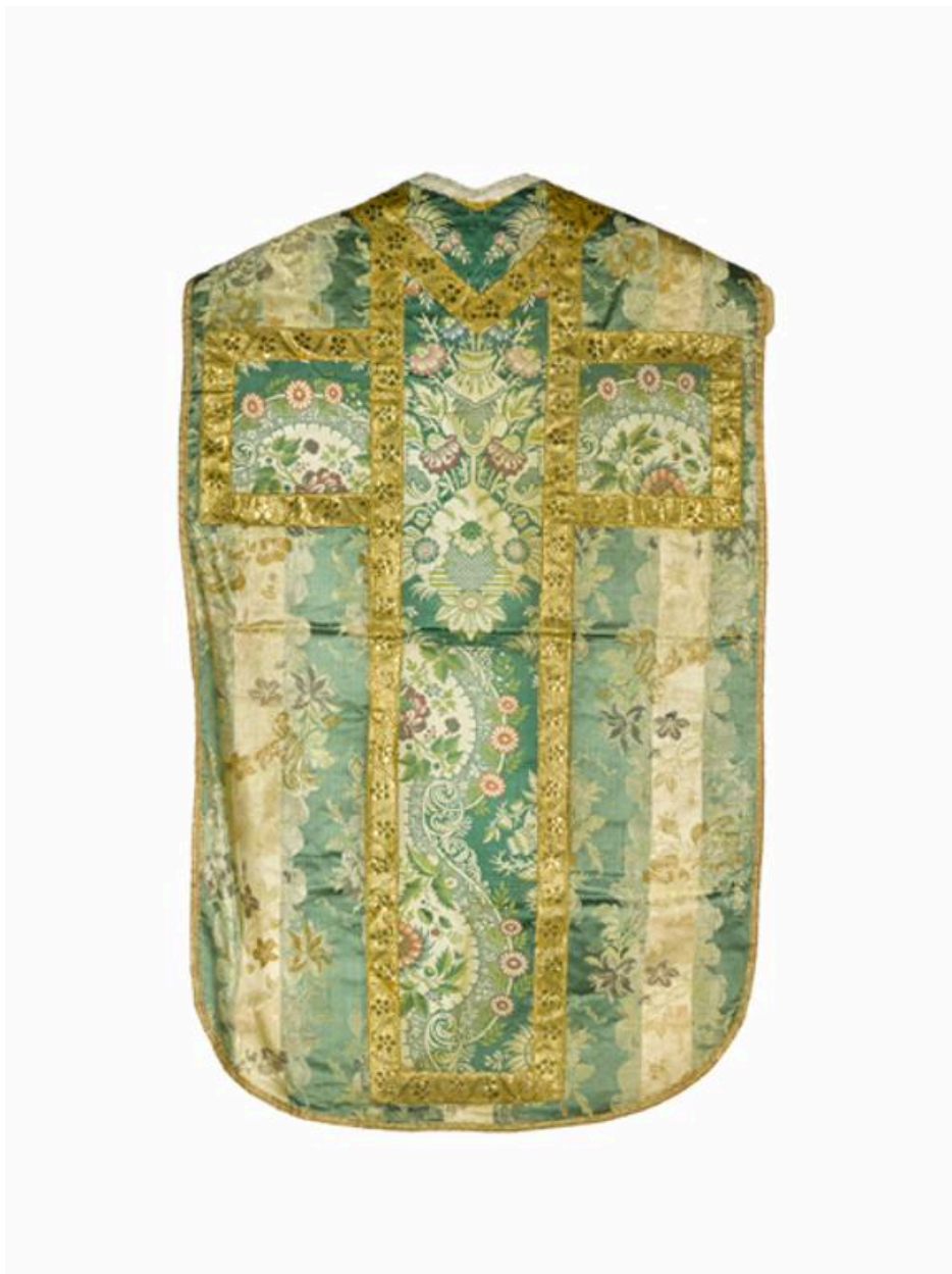
Vue du dos de la chasuble