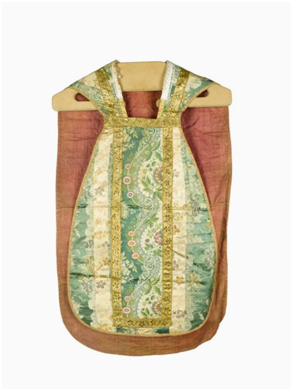
Vue du devant de la chasuble