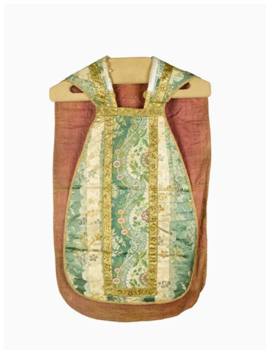
Vue du devant de la chasuble IVR84_20181500122NUC4A