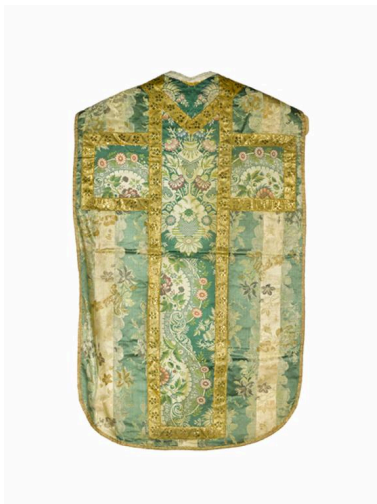
Vue du dos de la chasuble