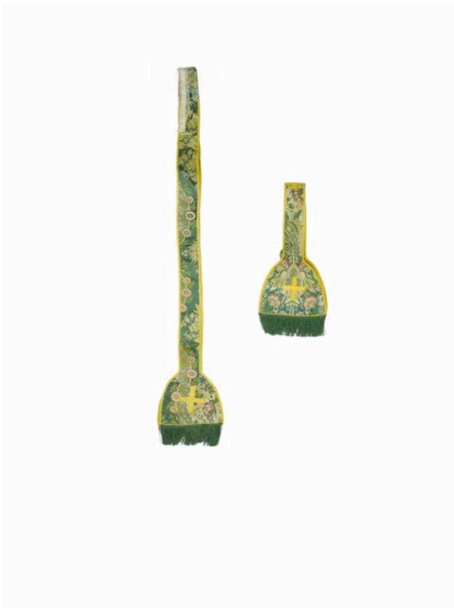
Vue de l'étole et du manipule