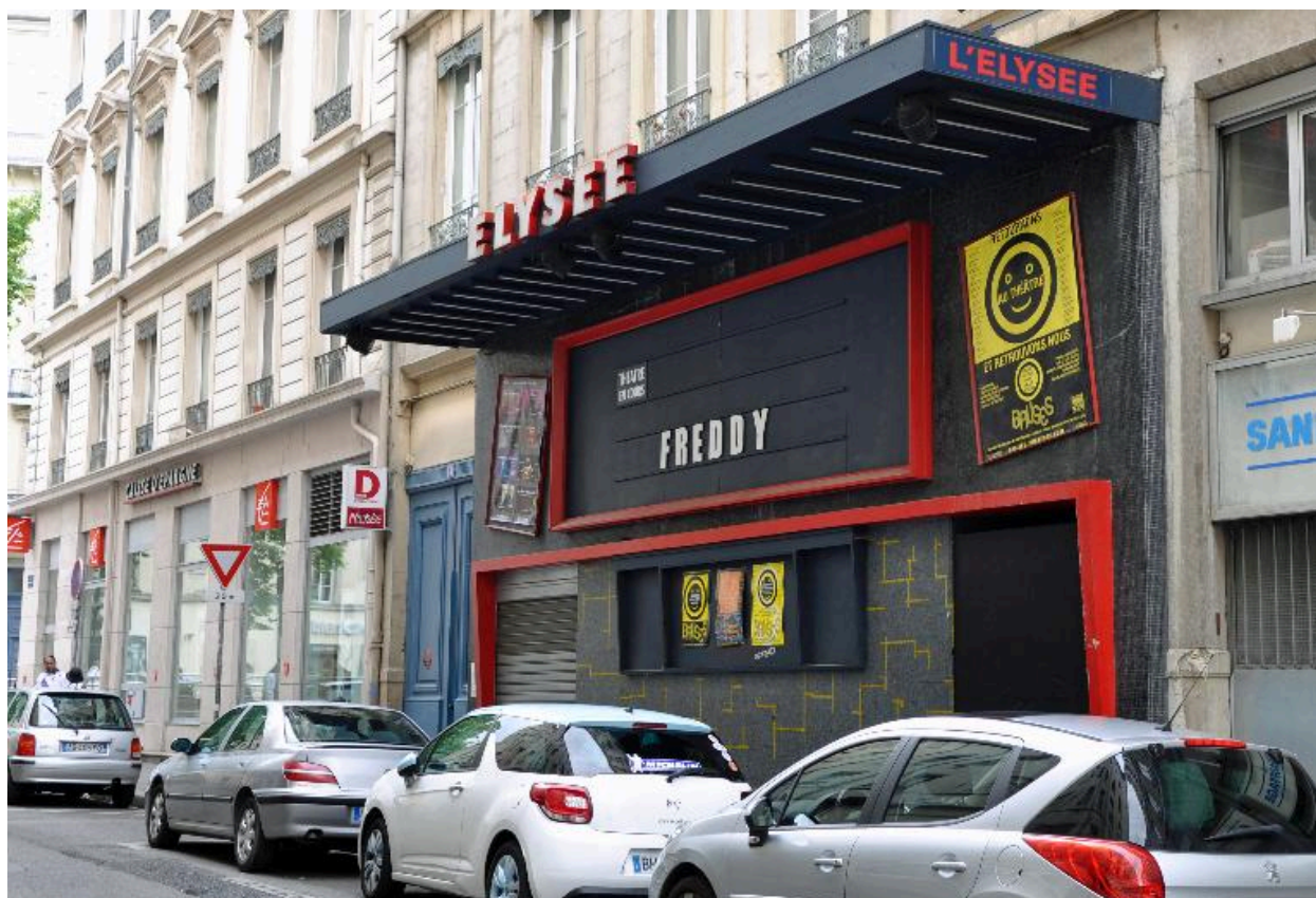
Vue rapprochée de l'élévation sur rue : devanture de la salle de spectacle