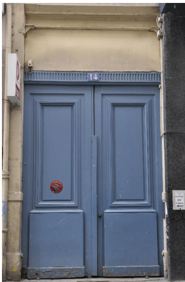
Vue rapprochée de la porte cochère

IVR82_20156901030NUCA