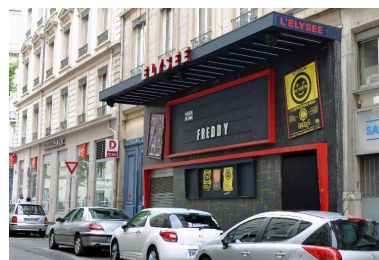
Vue rapprochée de l'élévation sur rue : devanture de la salle de spectacle