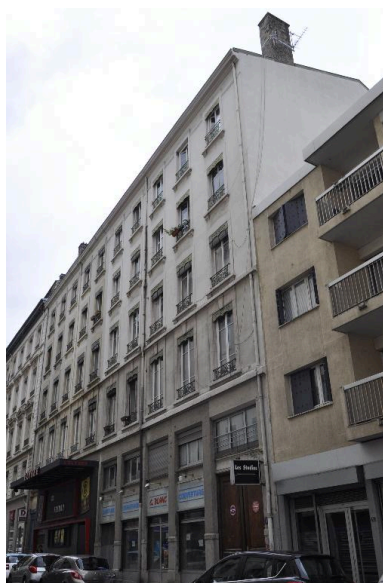
Vue d'ensemble des deux immeubles jumelés