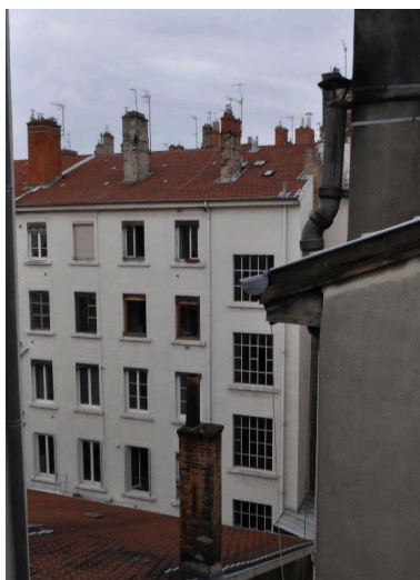
Vue générale de l'élévation sur cour IVR82_20156901032NUCA