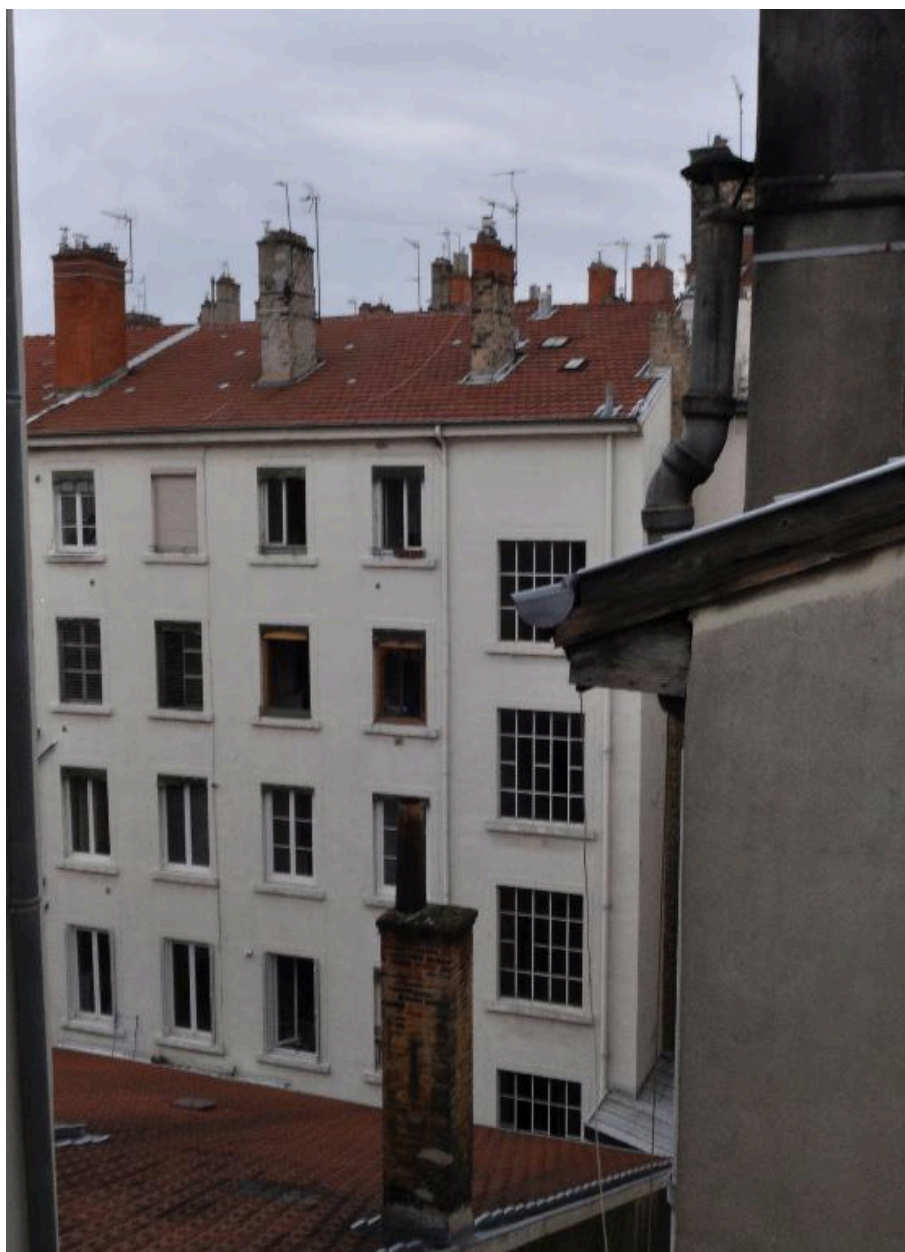
Vue générale de l'élévation sur cour