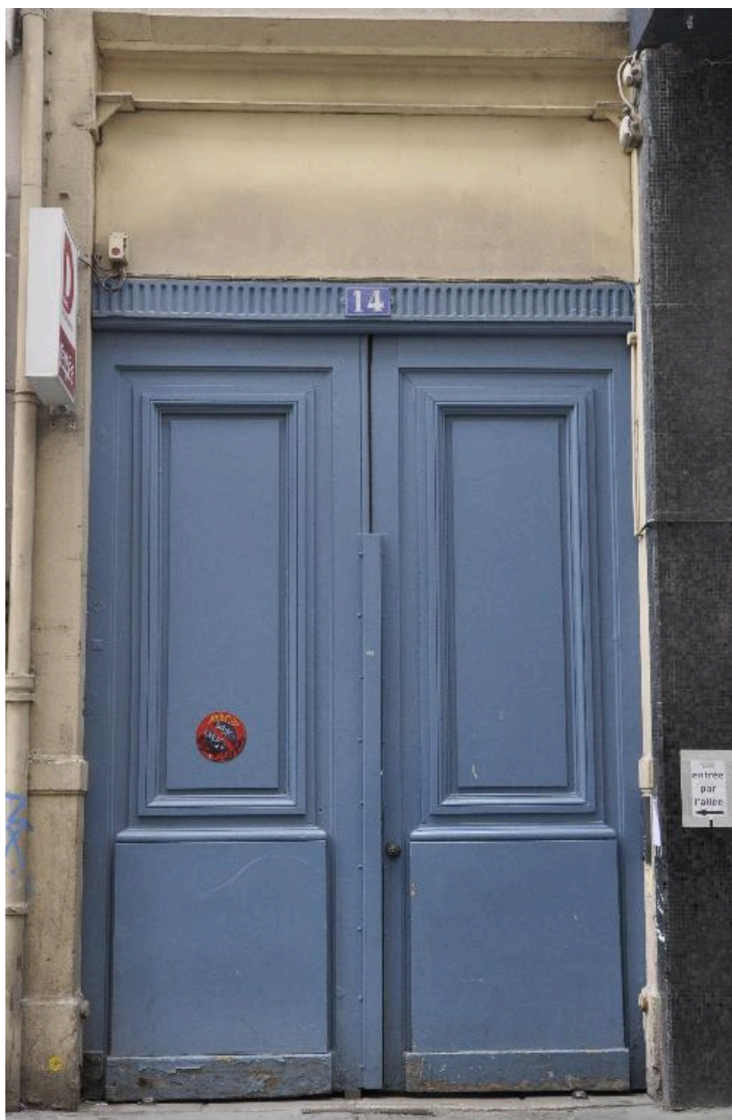
Vue rapprochée de la porte cochère