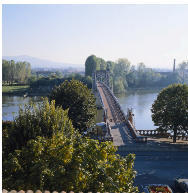
Vue axiale, depuis la rive gauche