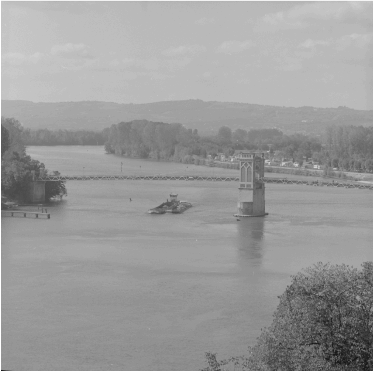
Vue d'ensemble depuis la rive gauche de la Saône