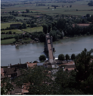
Vue prise depuis le château fort IVR82_19920100870XA