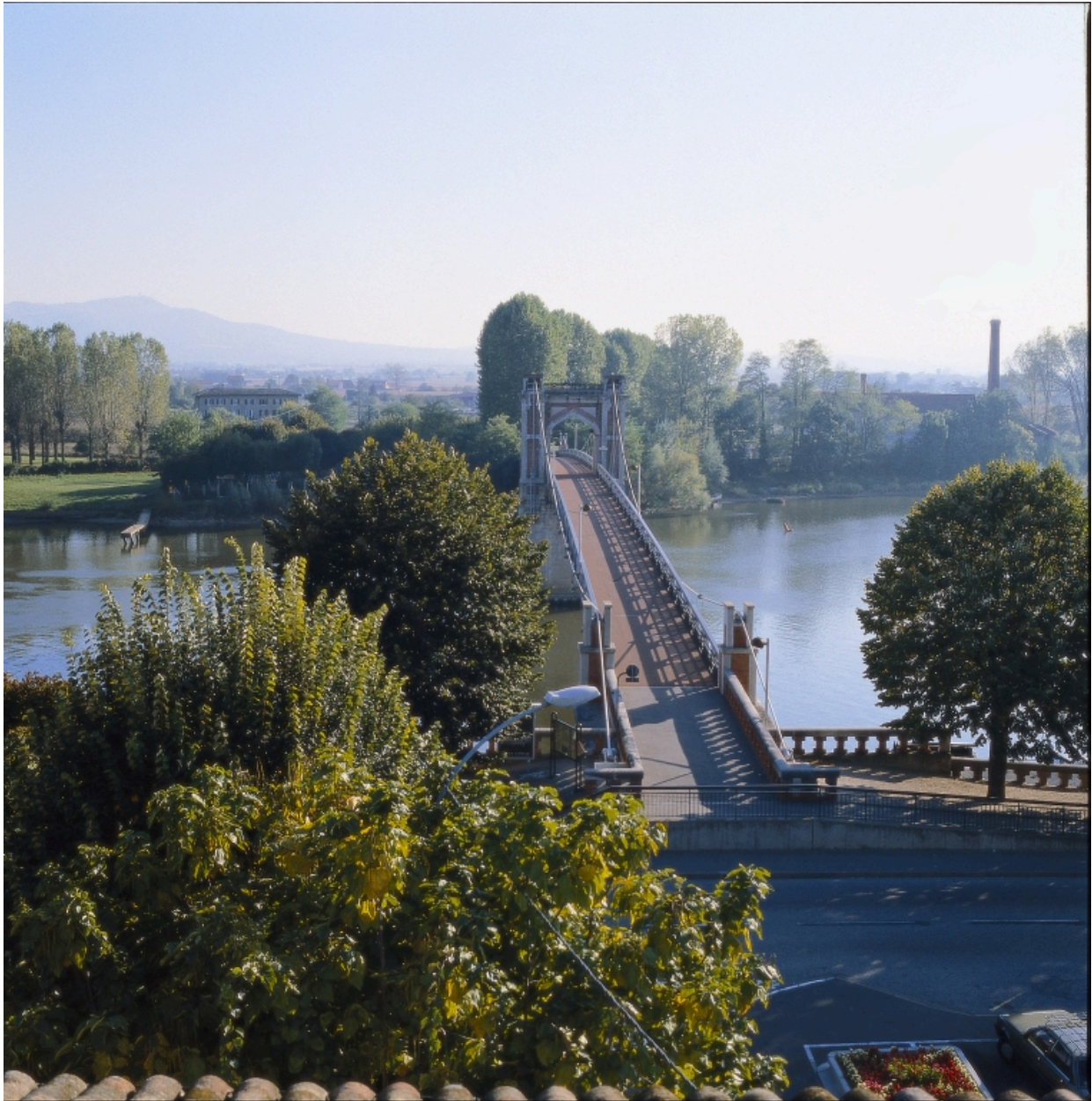
Vue axiale, depuis la rive gauche