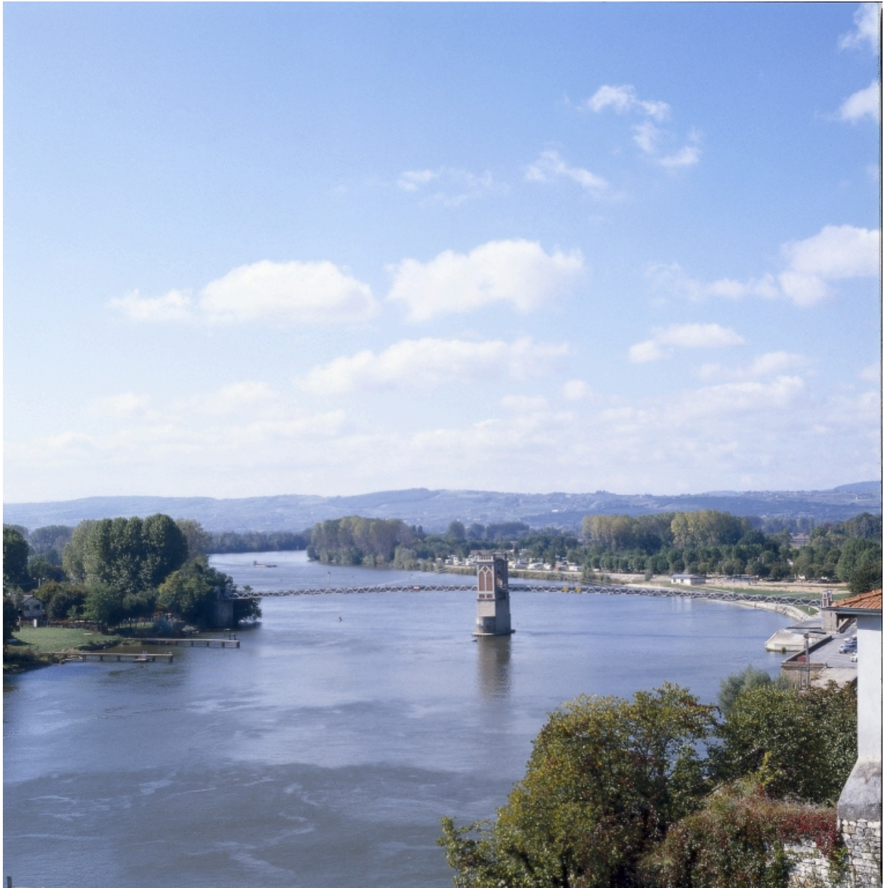
Vue prise depuis l'aval de la Saône