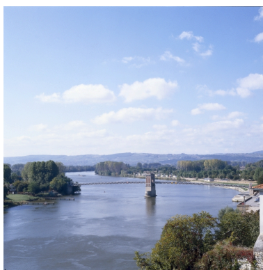
Vue prise depuis l'aval de la Saône