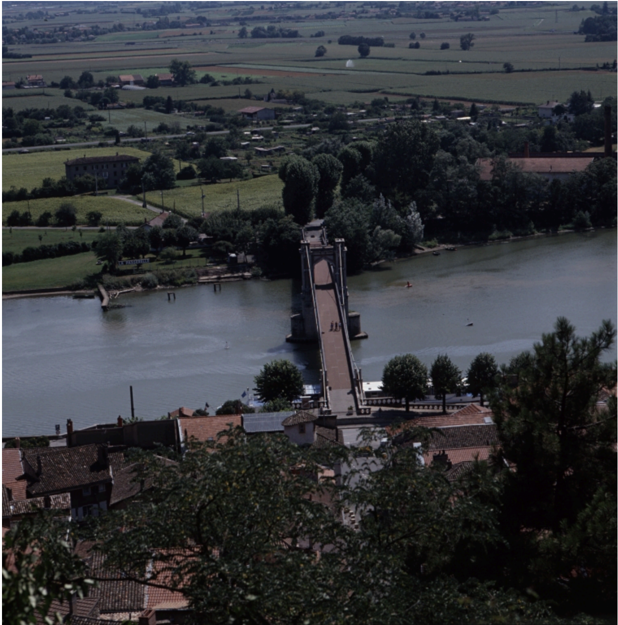
Vue prise depuis le château fort