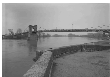
Vue prise depuis le quai, rive gauche.