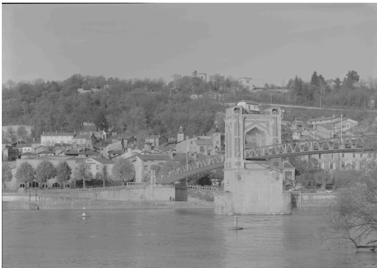
Vue prise de l'amont, rive droite.