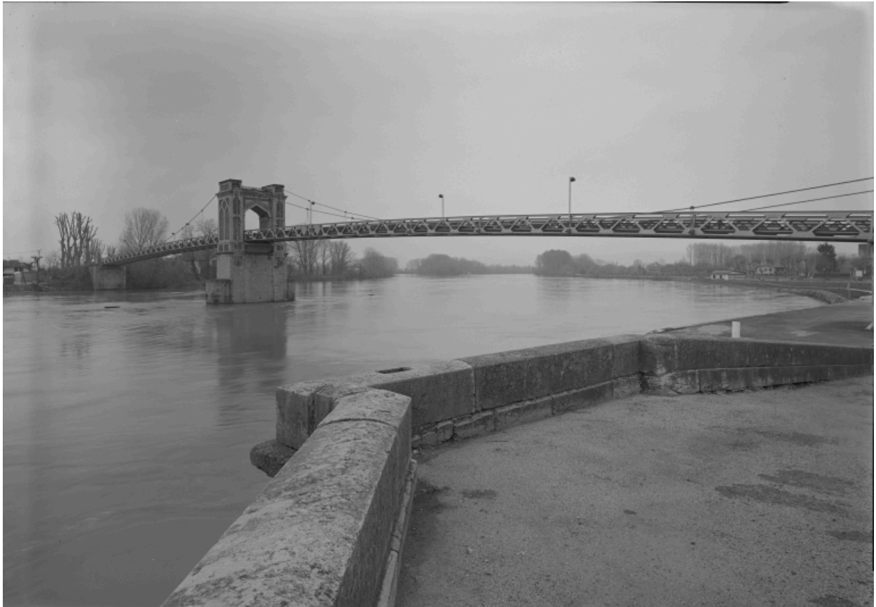
Vue prise depuis le quai, rive gauche.