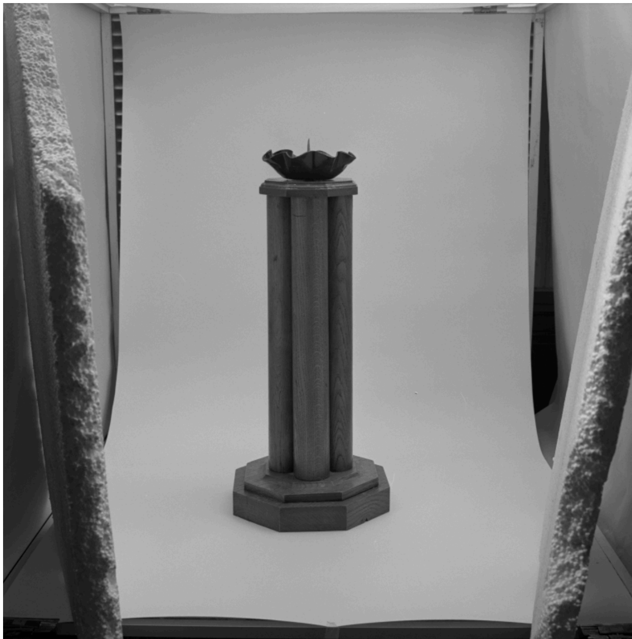
Un des cinq chandeliers (réalisé avec les colonnettes d'encadrement du chemin de croix), assorti à la tour eucharistique.