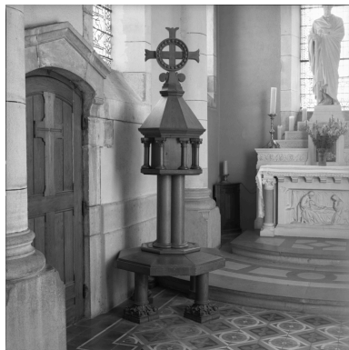
Tour eucharistique (réalisée à partir d'éléments de la chaire à prêcher).

IVR82_19910100821X