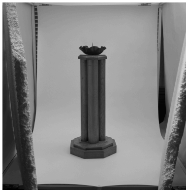
Un des cinq chandeliers (réalisé avec les colonnettes d'encadrement du chemin de croix), assorti à la tour eucharistique.

IVR82_19910100821X