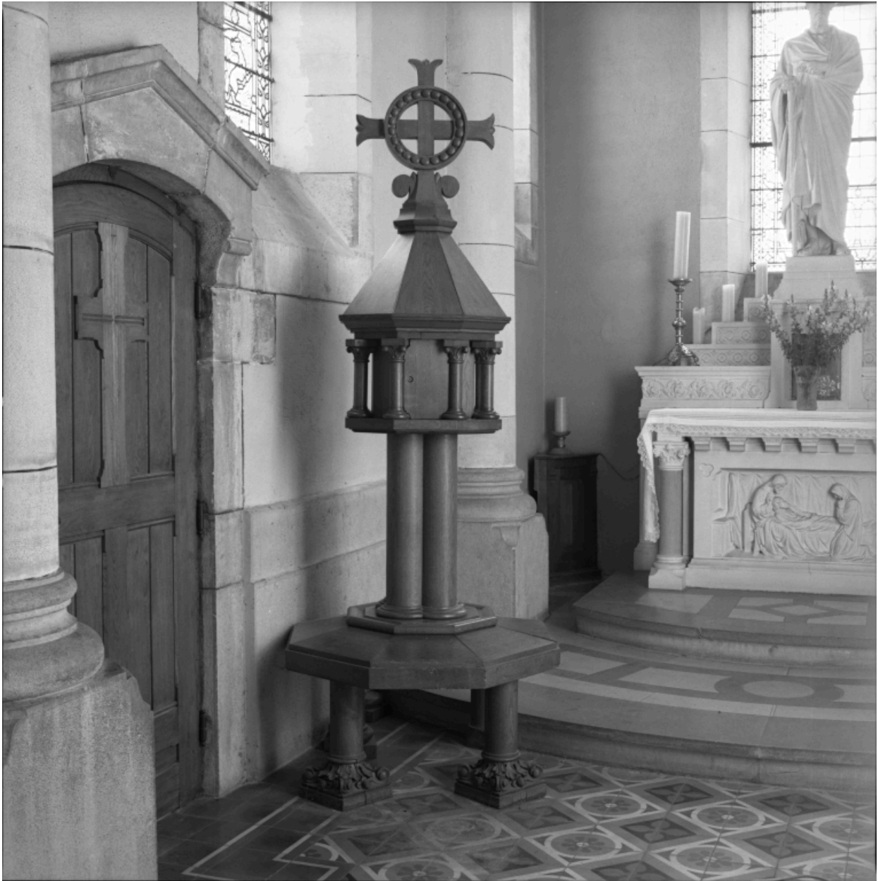
Tour eucharistique (réalisée à partir d'éléments de la chaire à prêcher).