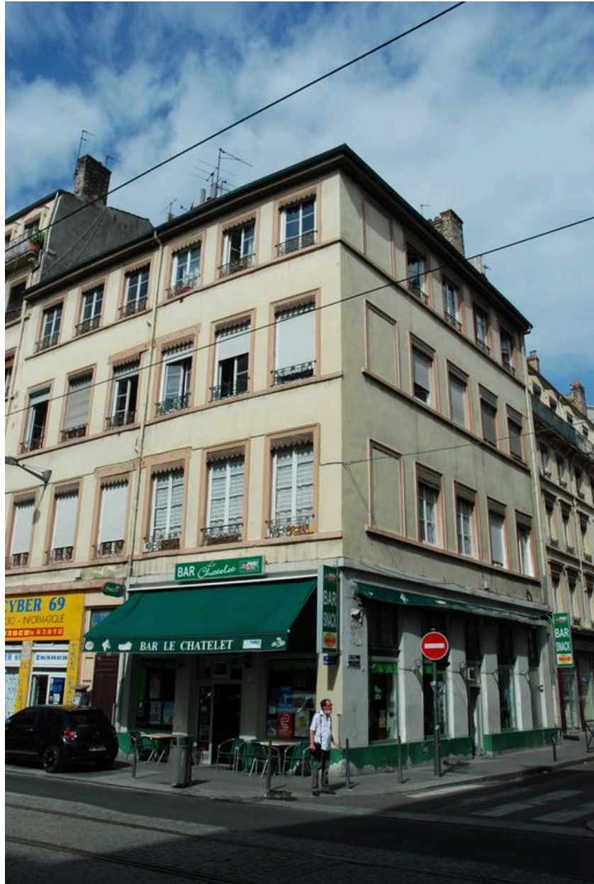
Vue générale, prise du nord