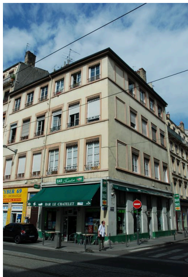
Vue générale, prise du nord IVR82_20126901024NUCA