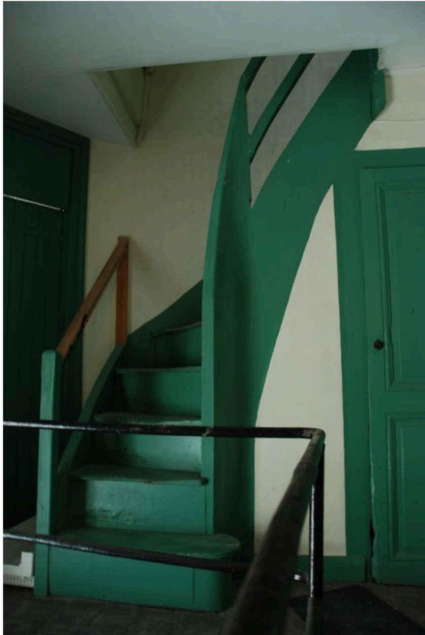
Vue intérieure : escalier en bois donnant accès aux combles