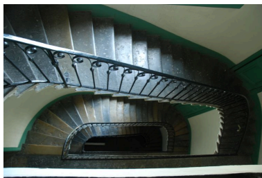
Vue intérieure : l'escalier vu en plongée