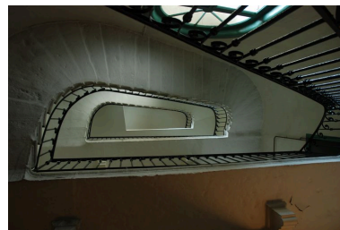
Vue intérieure : l'escalier vu en contre-plongée