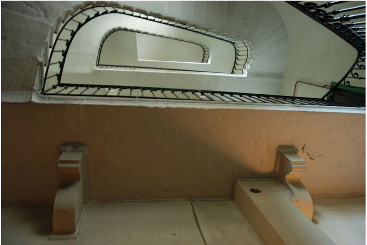
Vue intérieure : consoles soutenant le palier