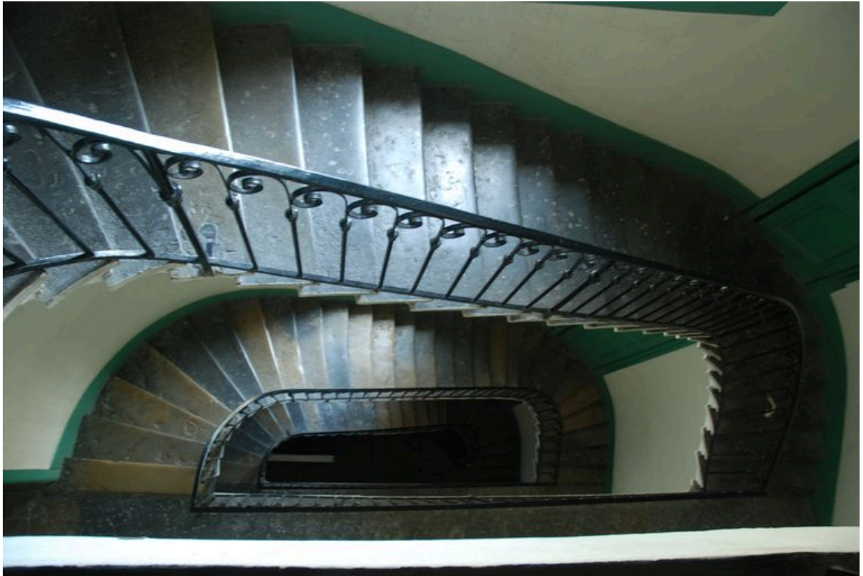
Vue intérieure : l'escalier vu en plongée