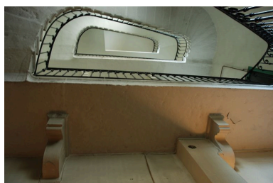
Vue intérieure : consoles soutenant le palier