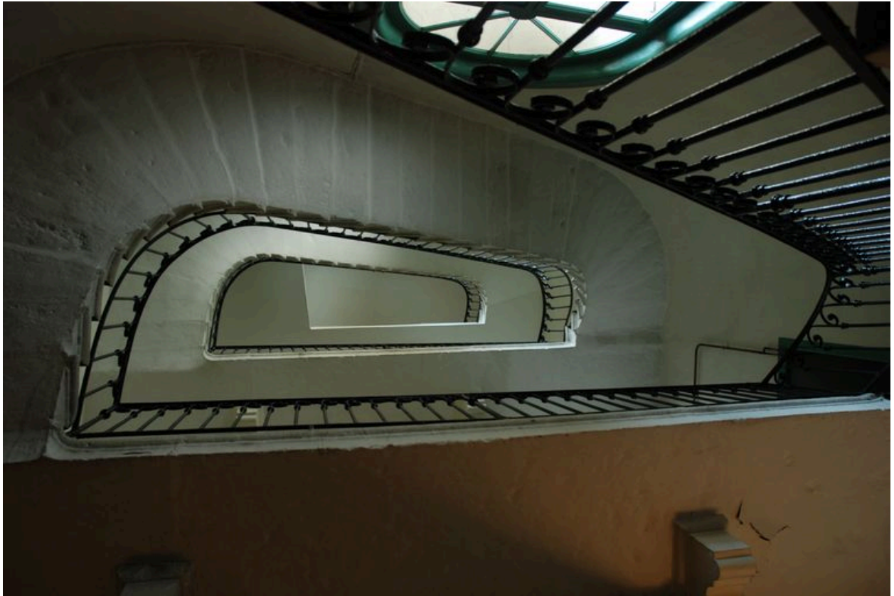
Vue intérieure : l'escalier vu en contre-plongée