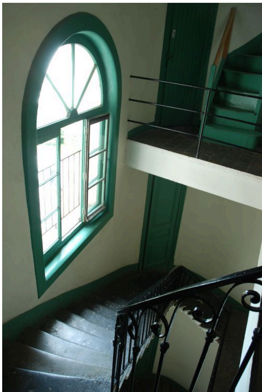
Vue intérieure : baie cintrée éclairant la cage d'escalier