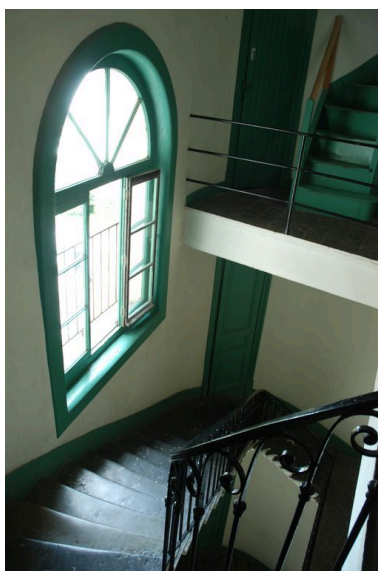
Vue intérieure : baie cintrée éclairant la cage d'escalier IVR82_20126901029NUCA