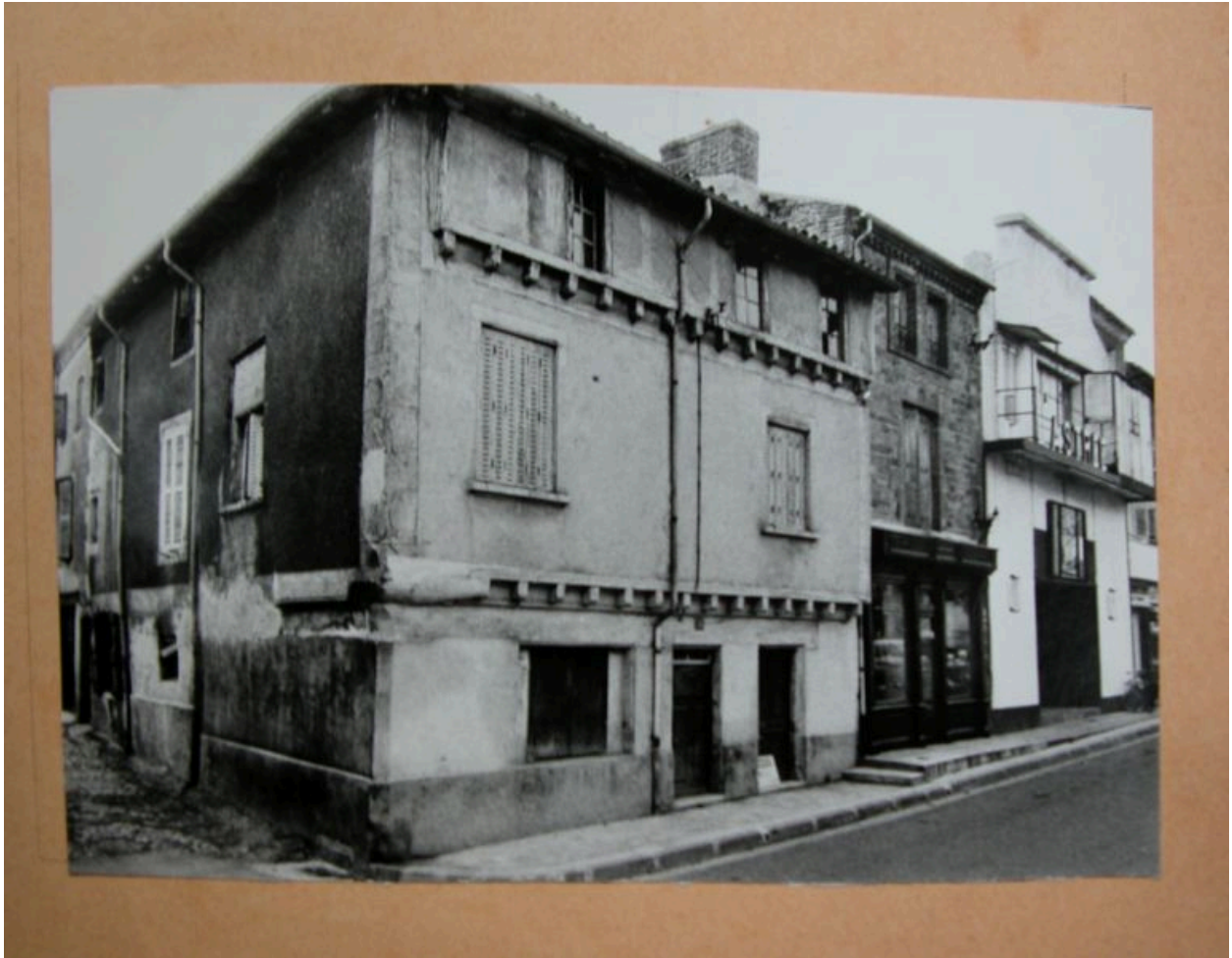
Vue avant restauration, photographie Louis Bernard, 1972. reproduction photographique AD Loire. 1111 VT 128