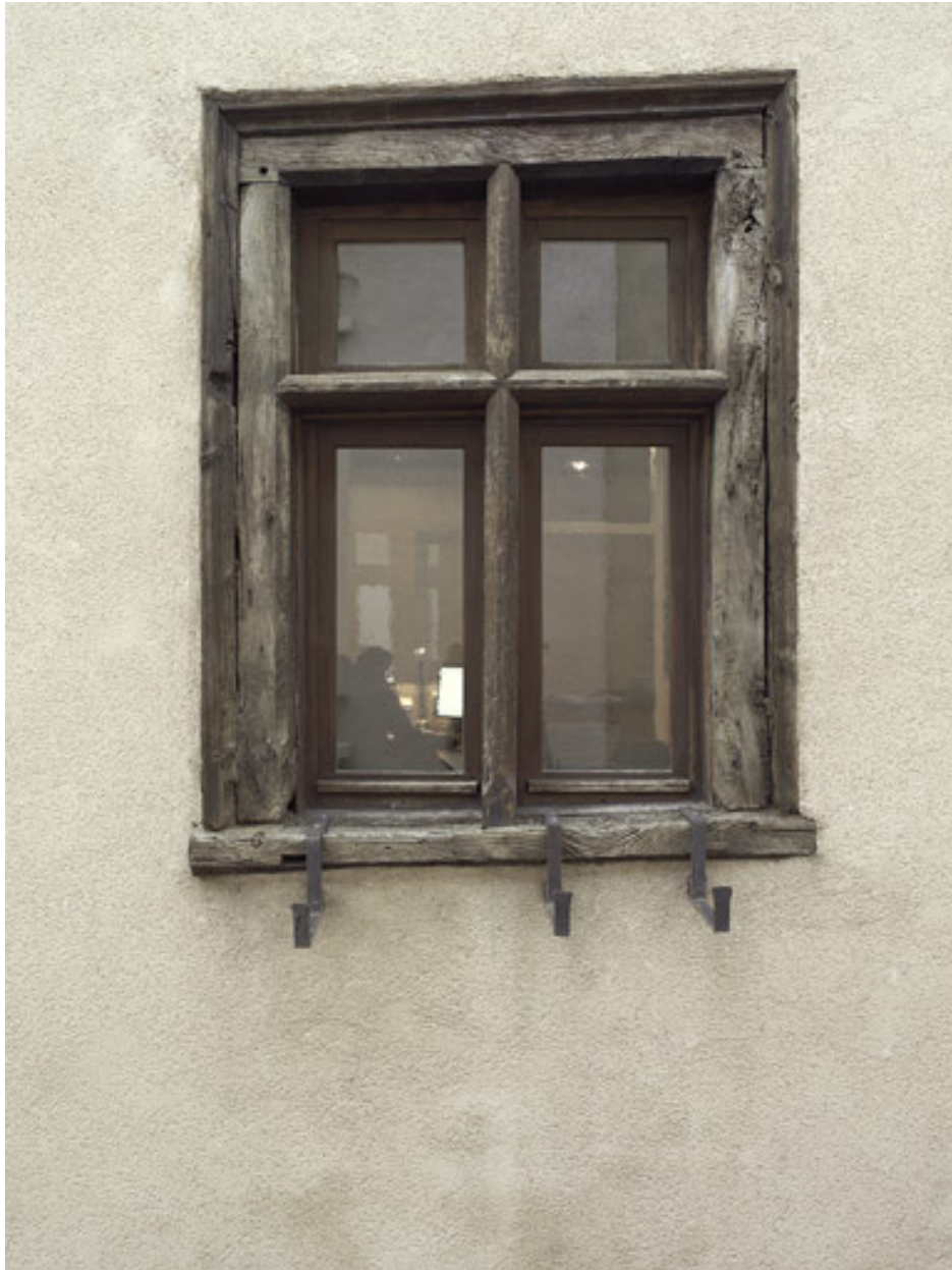
Fenêtres à croisées en bois sur l'élévation latérale.