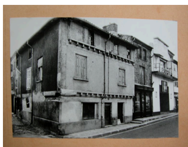
Vue avant restauration