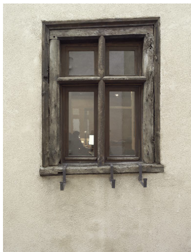
Fenêtres à croisées en bois sur l'élévation latérale. IVR82_20074201276NUCA