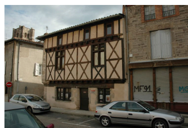
Vue générale IVR82_20114201342NUCA