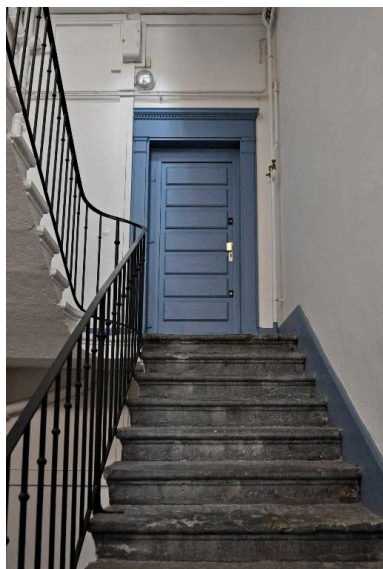
Vue intérieure, porte du premier palier : encadrement de menuiserie ancien IVR84_20176901353NUCA