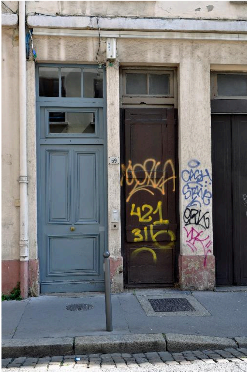
Elévation sur rue, portes jumelées