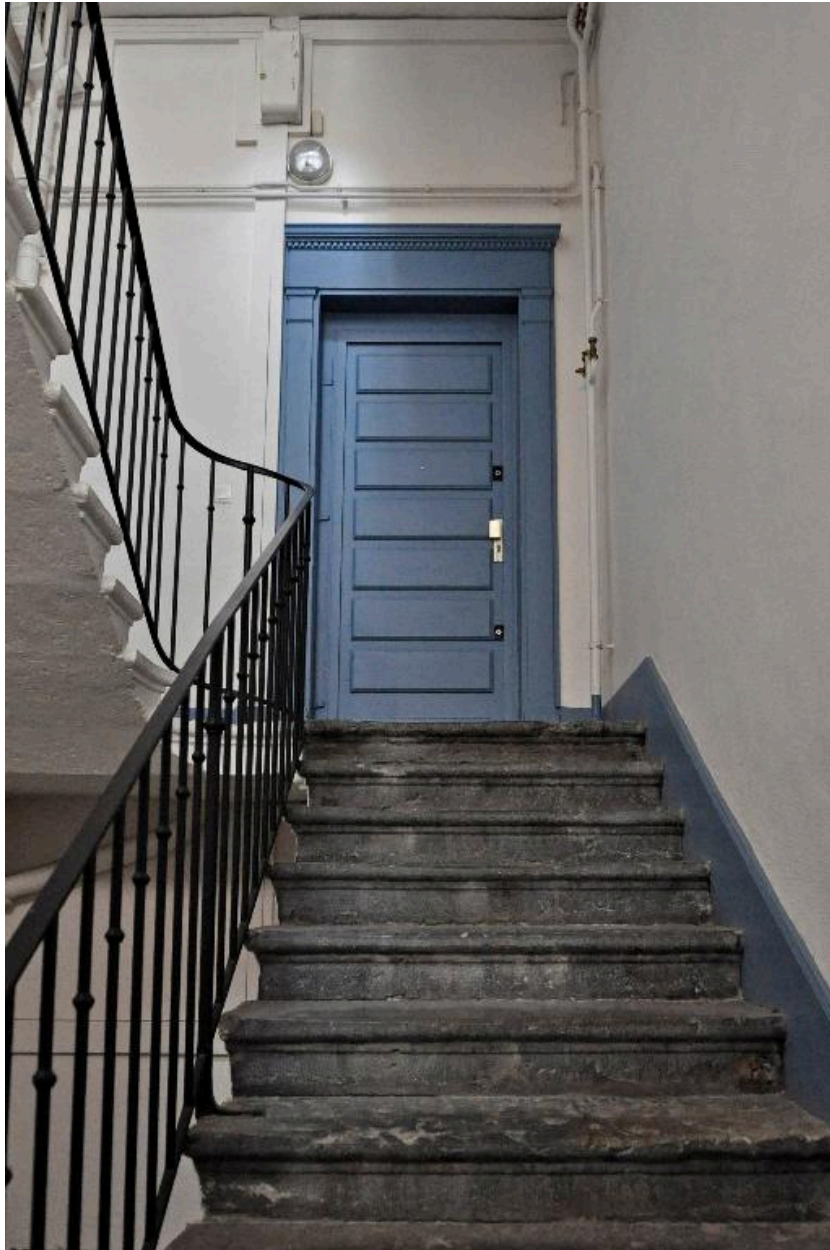
Vue intérieure, porte du premier palier : encadrement de menuiserie ancien