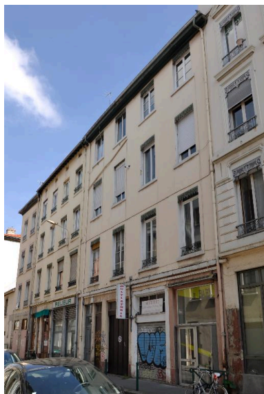
Vue générale IVR84_20176901350NUCA