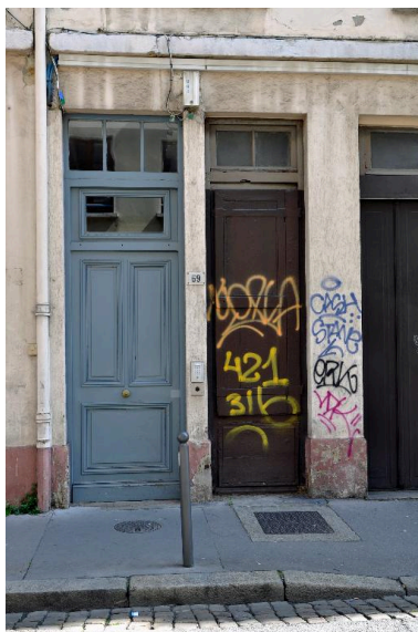
Elévation sur rue, portes jumelées