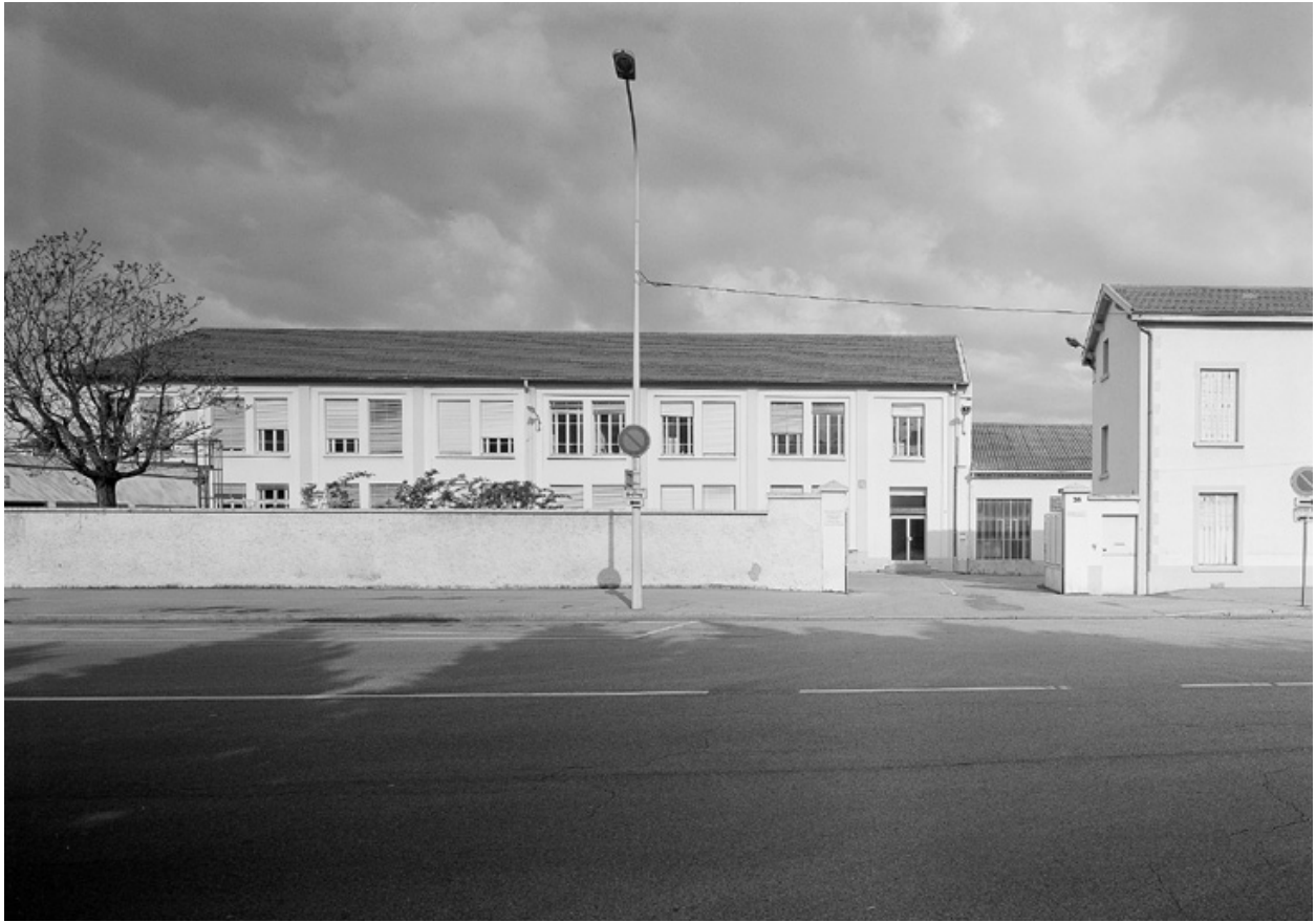
Vue générale, entrée principale vue est