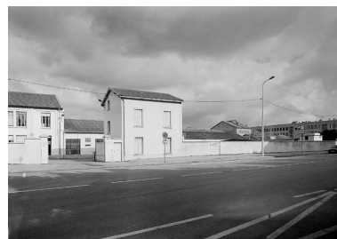
Vue d'ensemble sud-est