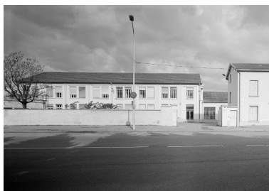
Vue générale, entrée principale vue est IVR82_20016903152P

IVR82_20046906330NUCB