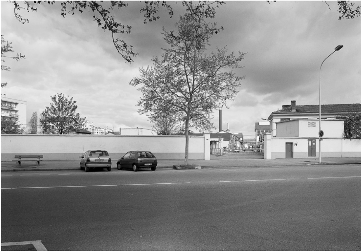
Entrée livraison, vue est