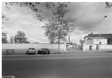
Entrée livraison, vue est IVR82_20016903154P