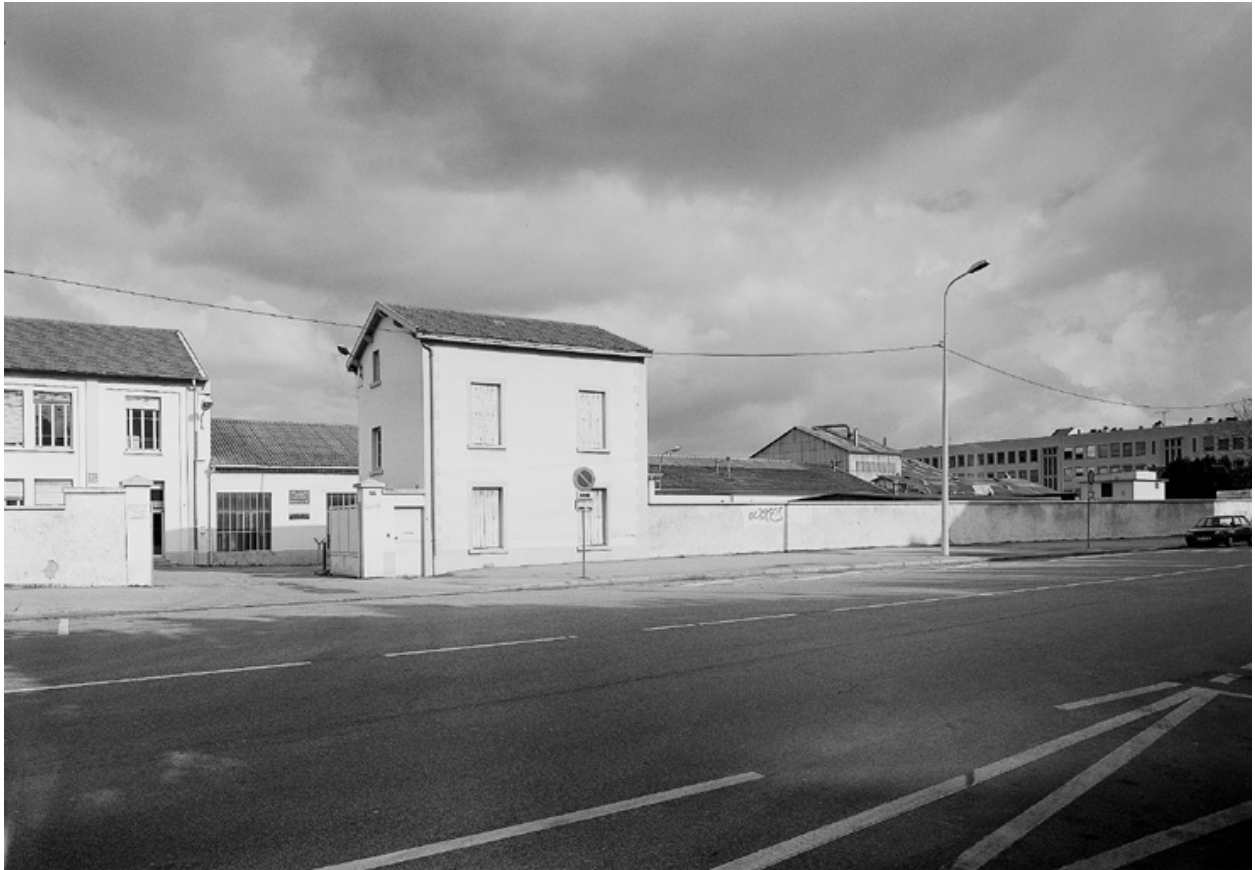
Vue d'ensemble sud-est