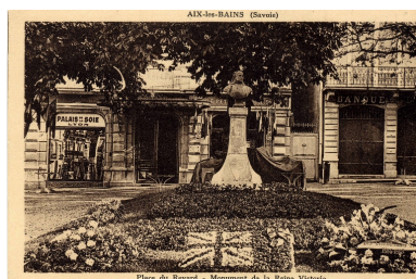
Vue du monument