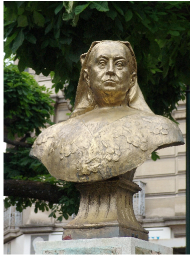
Buste IVR82_20057300524NUCA