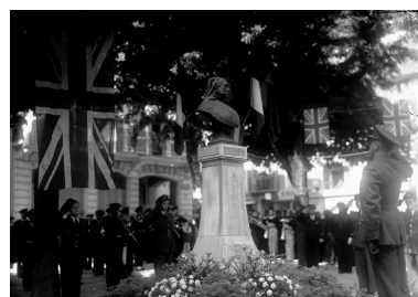
Inauguration du monument