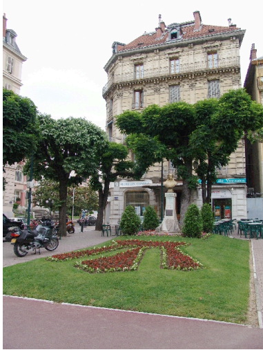
Vue d'ensemble IVR82_20057300525NUCA