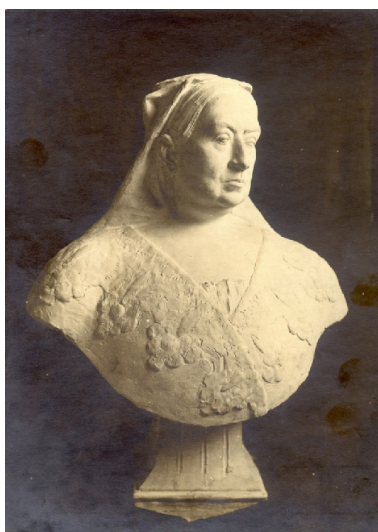
Plâtre IVR82_20057300947NUCB