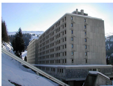
Vue d'ensemble depuis le nord-ouest IVR82_20117402250NUCA