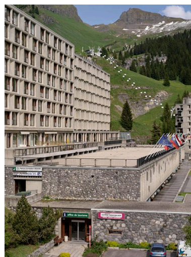
Élévation sud