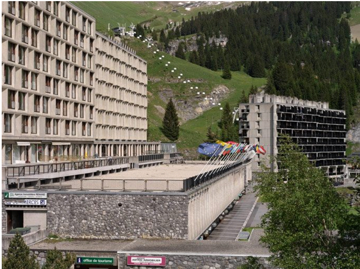
Elévation sud sur la terrasse