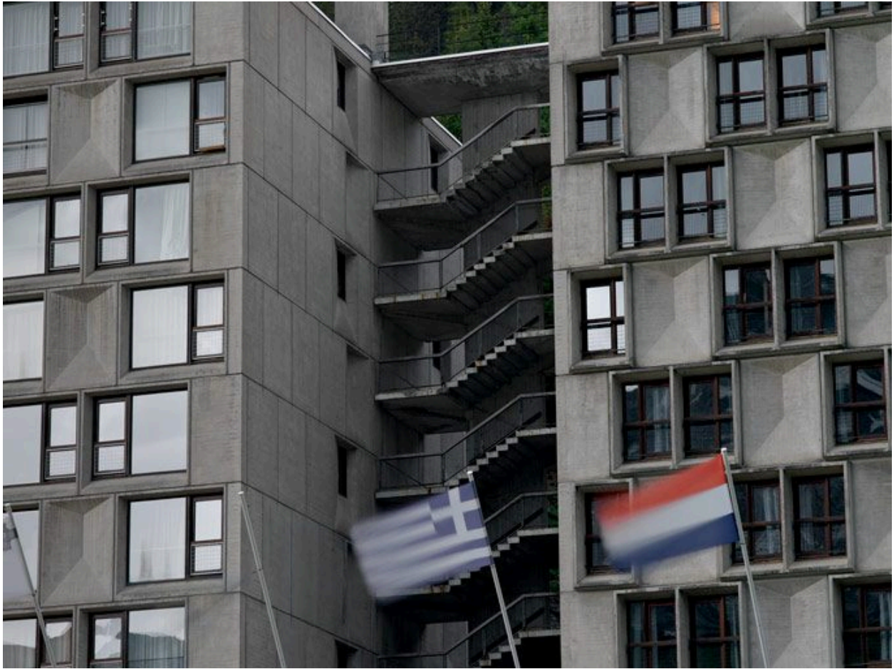
L'escalier entre la résidence Cassiopée et l'hôtel les Lindars