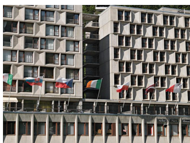
L'escalier entre la résidence Cassiopée et l'hôtel les Lindars ; détail des baies et des panneaux de ciment moulé de la façade principale