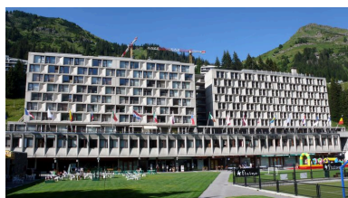
Vue d'ensemble depuis le sud IVR82_20127401503NUCA