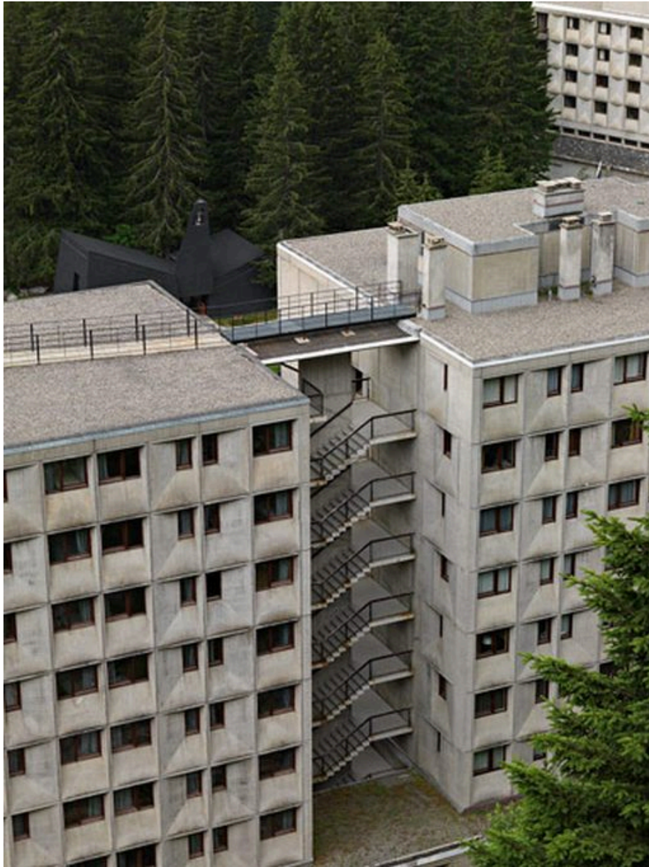
Vue de l'escalier reliant la résidence et l'hôtel depuis Flaine Forêt, au nord