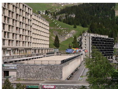
Elévation sud sur la terrasse