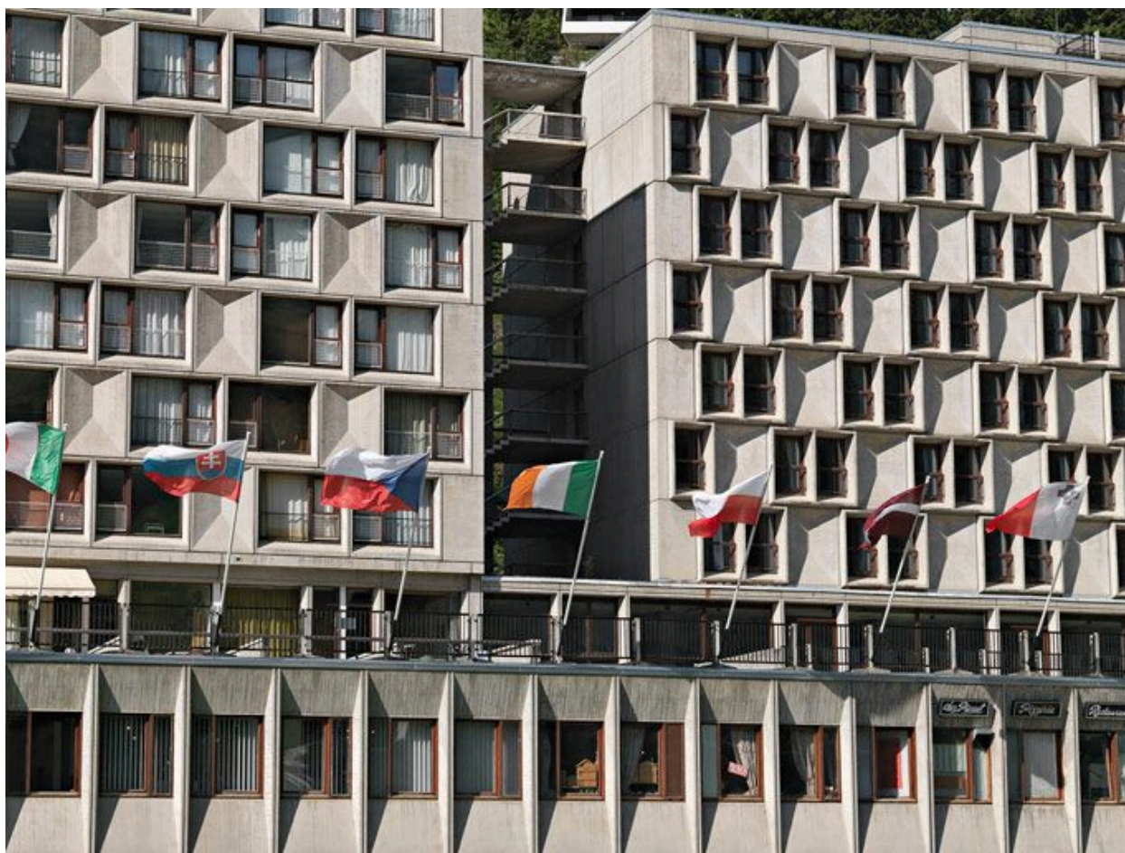
L'escalier entre la résidence Cassiopée et l'hôtel les Lindars ; détail des baies et des panneaux de ciment moulé de la façade principale