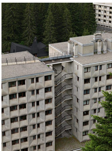
Vue de l'escalier reliant la résidence et l'hôtel depuis Flaine Forêt, au nord IVR82_20097400399NUCA