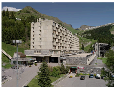
Vue générale depuis le sud-ouest IVR82_20097400255NUCA