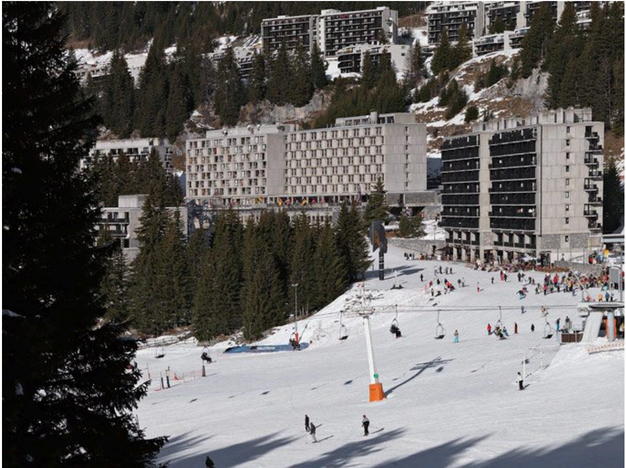
Vue générale depuis le sud-est, au premier plan l'Aldébaran