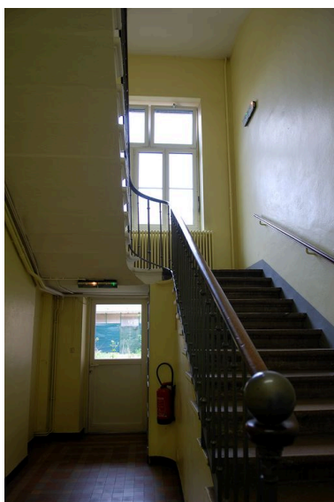
Corps de bâtiment principal : escalier nord-est IVR82_20096900792NUCA