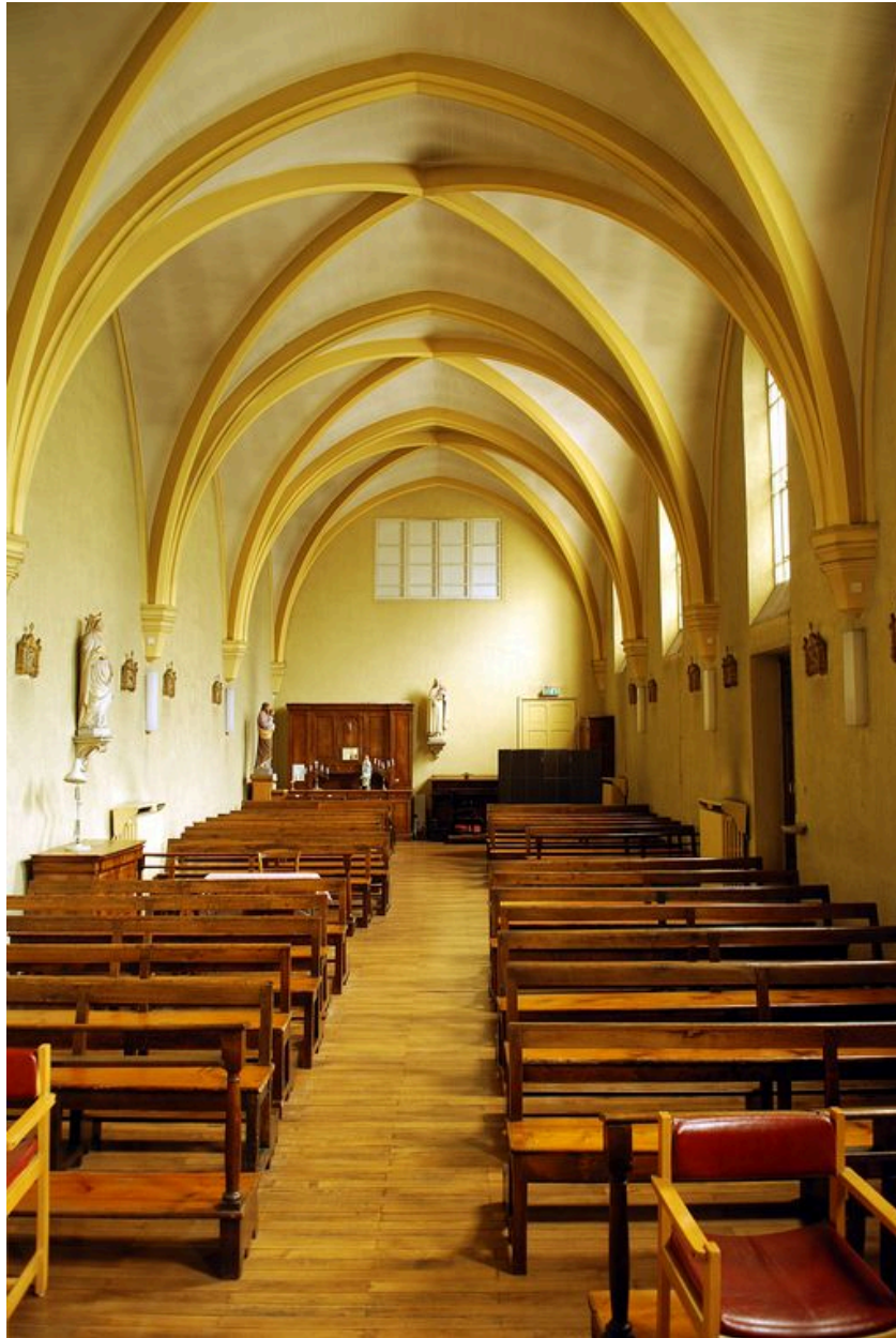
Chapelle : vue intérieure vers la nef