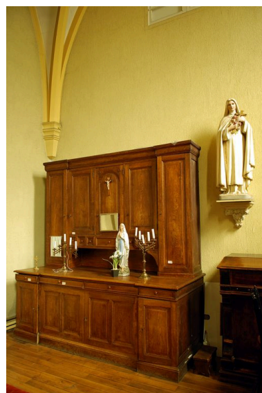
Chapelle : meuble de sacristie IVR82_20096900798NUCA