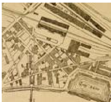
Plan du quartier de Vaise et de l'Industrie, vers 1877, détail