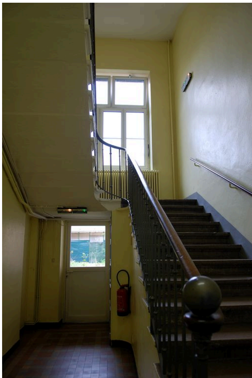
Corps de bâtiment principal : escalier nord-est