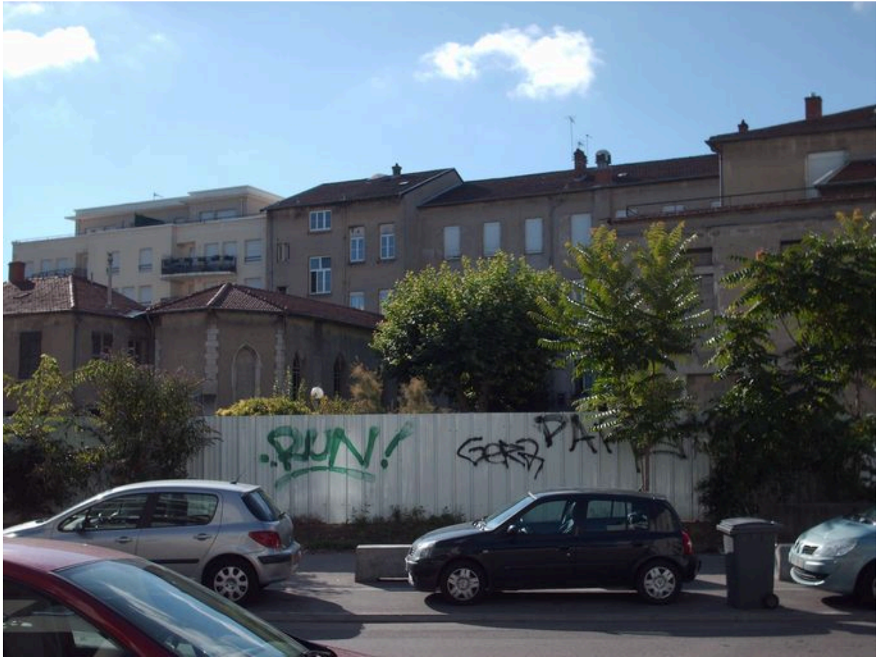
Elévations rue du 24-mars-1852 : vue de situation