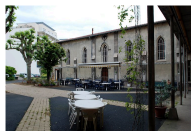
Chapelle : élévation latérale IVR82_20096900787NUCA