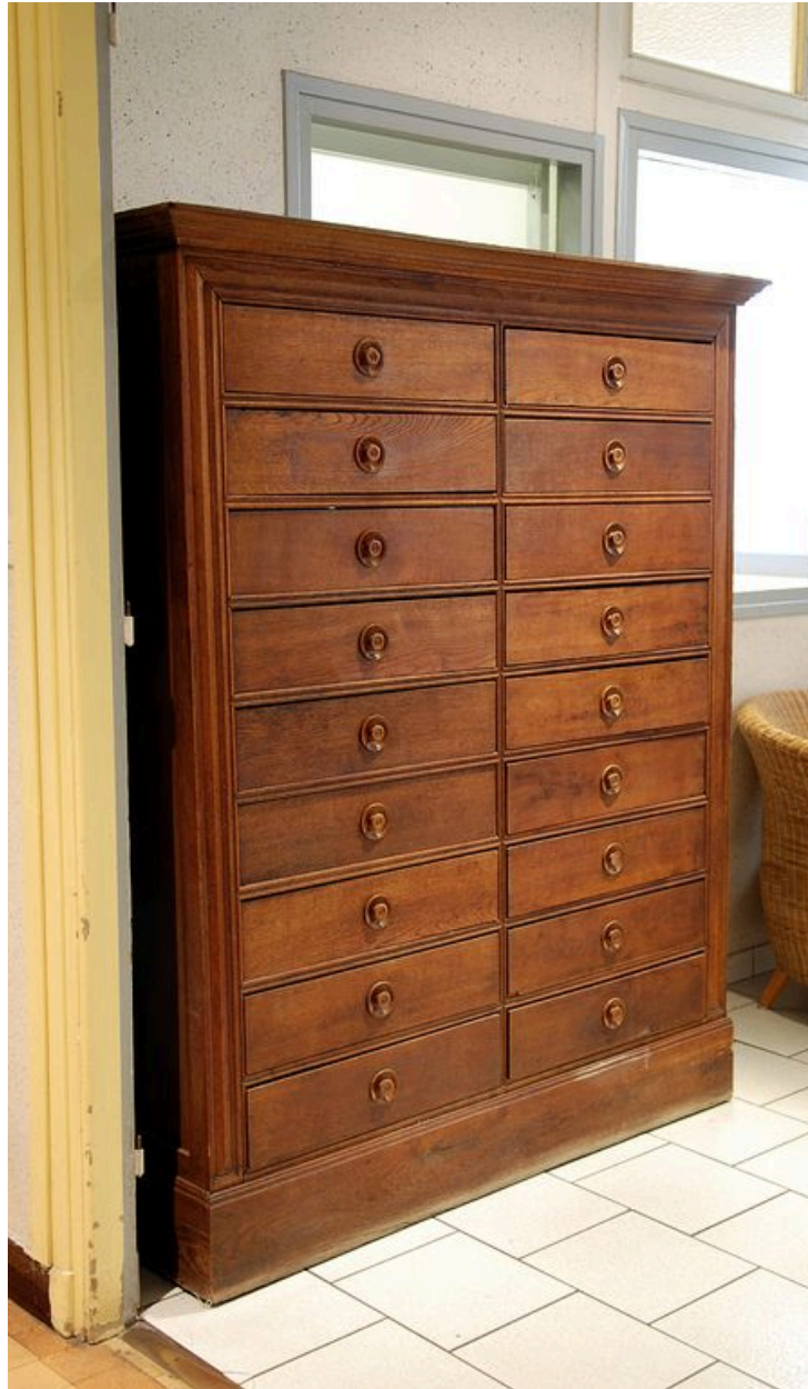
Meuble où les religieuses rangeaient leurs bobines de fil