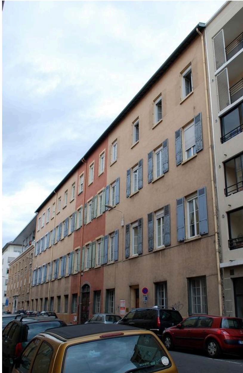
Elévation rue de la Claire : vue générale