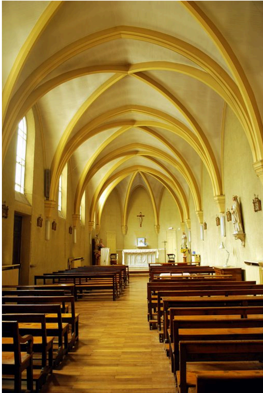
Chapelle : vue intérieure vers le chœur