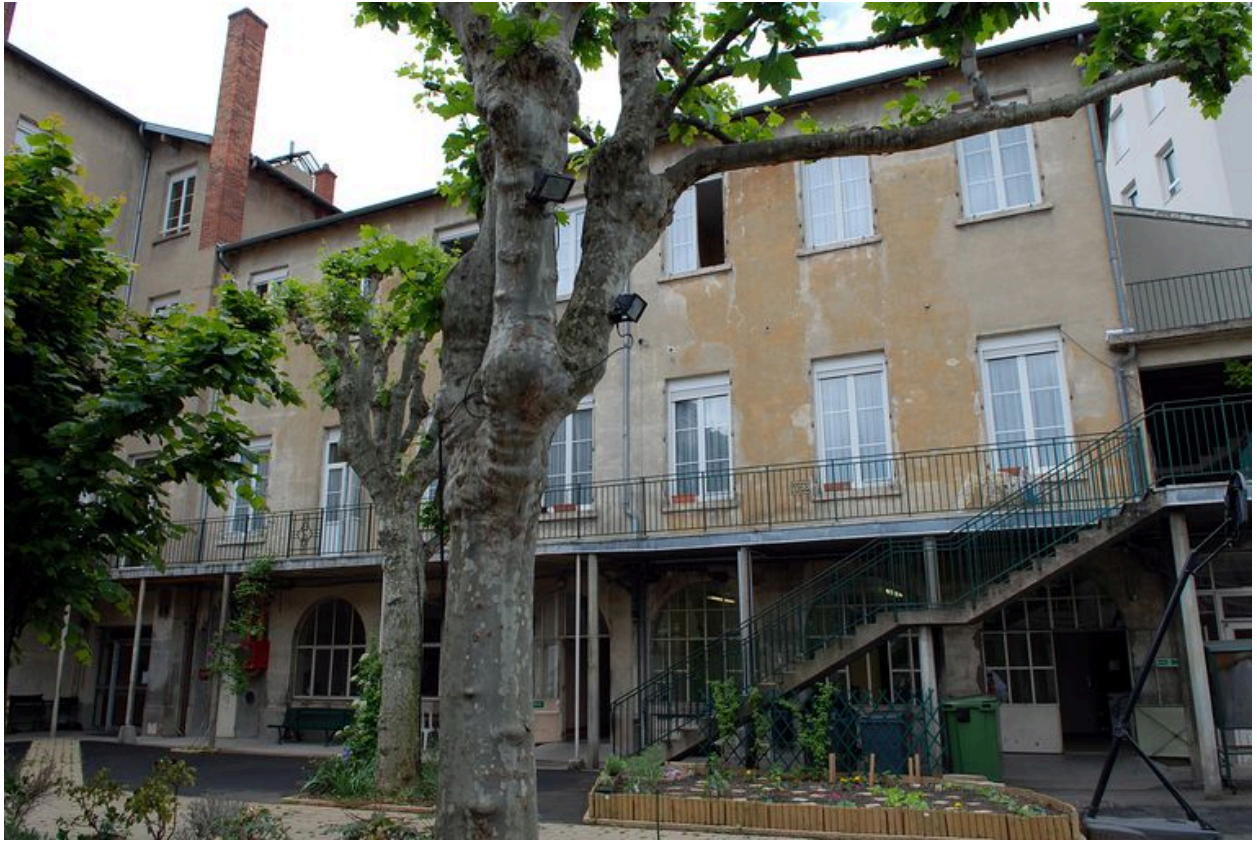
Corps de bâtiment perpendiculaire à la rue de la Claire : vue générale