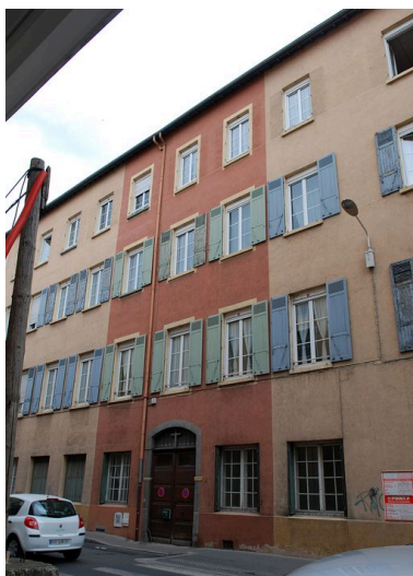
Elévation rue de la Claire : travées axiales et portail