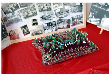
Coussin piqué d'épingles fabriquées par les résidentes IVR82_20096900801NUCA