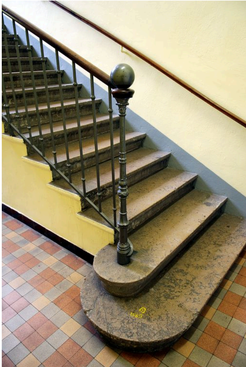
Corps de bâtiment principal : départ de l'escalier nord-est