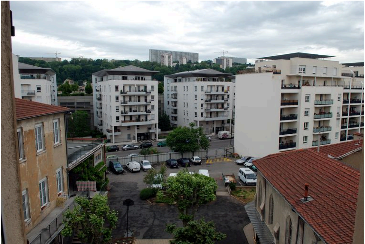
Le jardin et la rue du 24-Mars-1852 depuis le corps de bâtiment principal