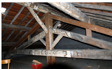
Corps de bâtiment principal : charpente, détail d'une ferme IVR82_20096900799NUCA