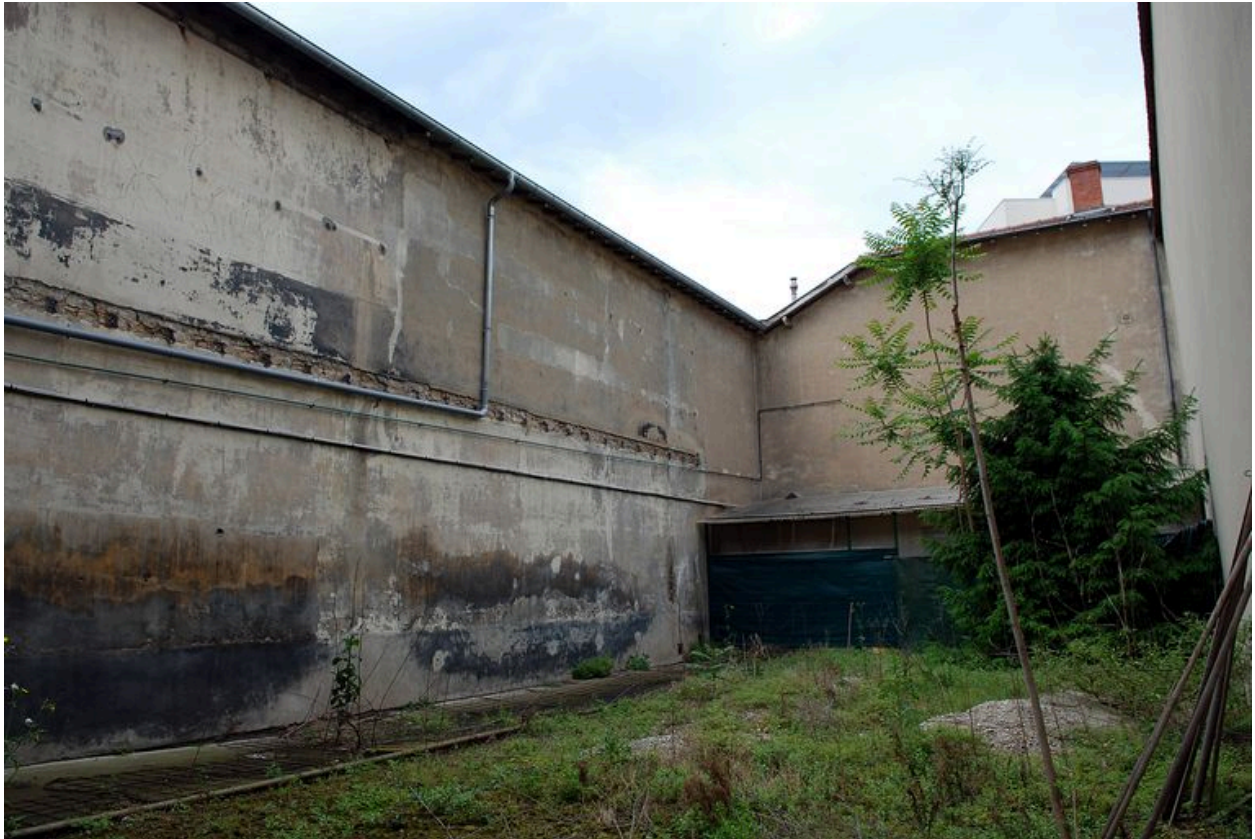
Cour fermée par la chapelle et la maison