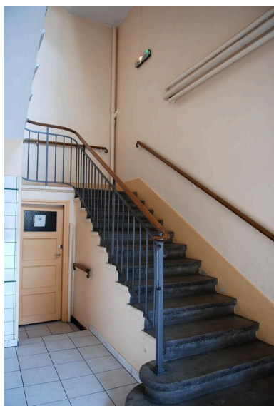
Corps de bâtiment principal : escalier sud-ouest