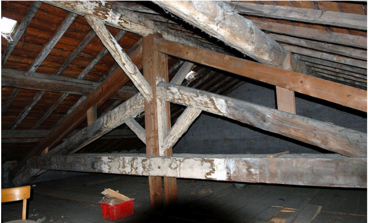
Corps de bâtiment principal : charpente, détail d'une ferme