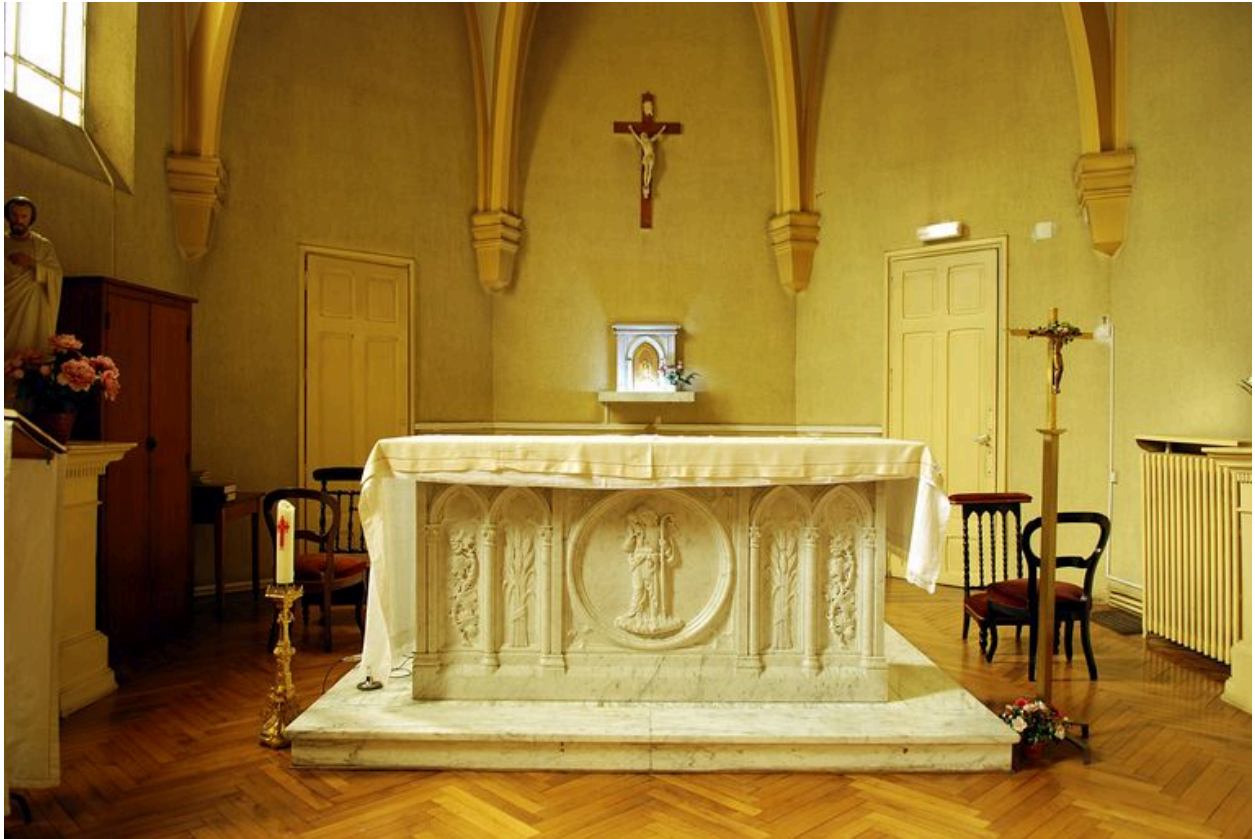
Chapelle : l'autel et, derrière, le tabernacle dont la porte est ornée d'un pélican symbolique