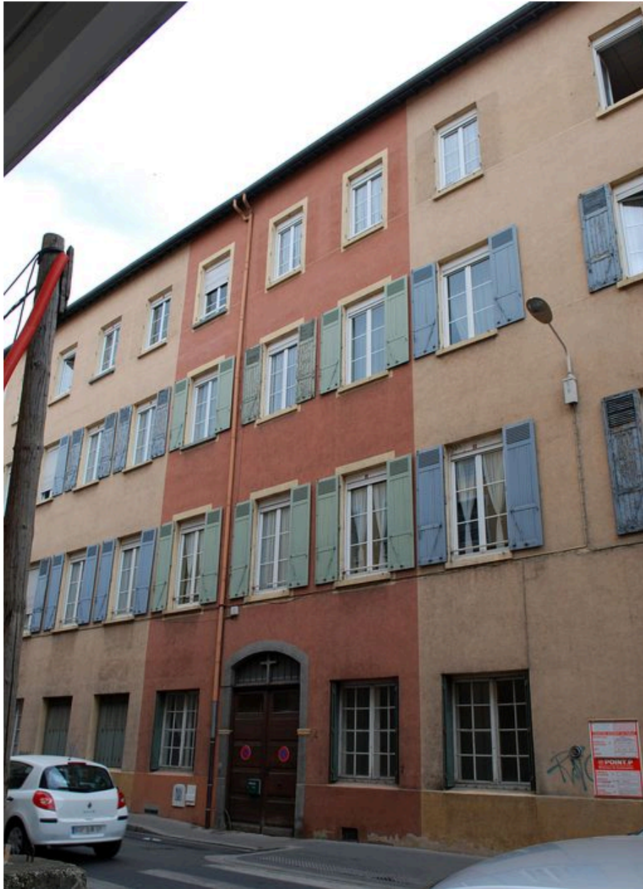
Elévation rue de la Claire : travées axiales et portail