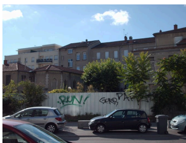
Elévations rue du 24-mars-1852 : vue de situation IVR82_20116902463NUCA