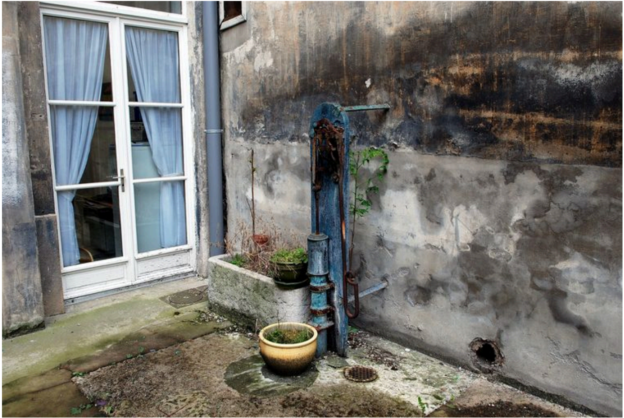
Cour fermée par la chapelle et la maison : pompe et bassin