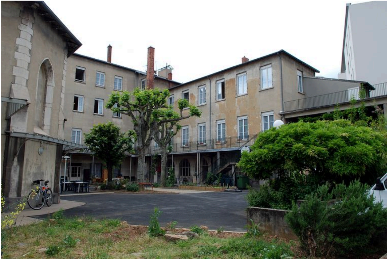
Elévations sur cour vers le sud