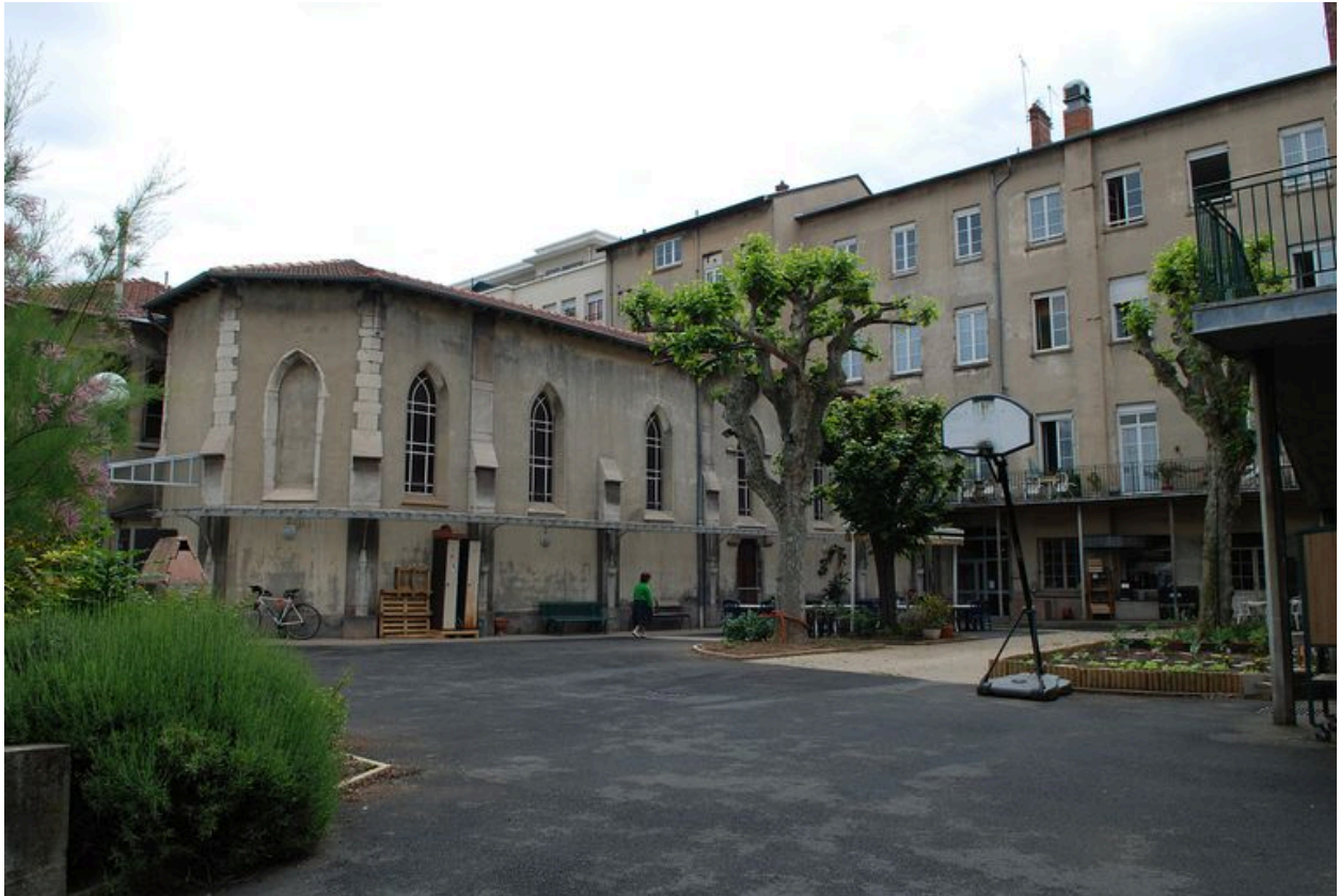
Elévations sur cour vers le nord-est