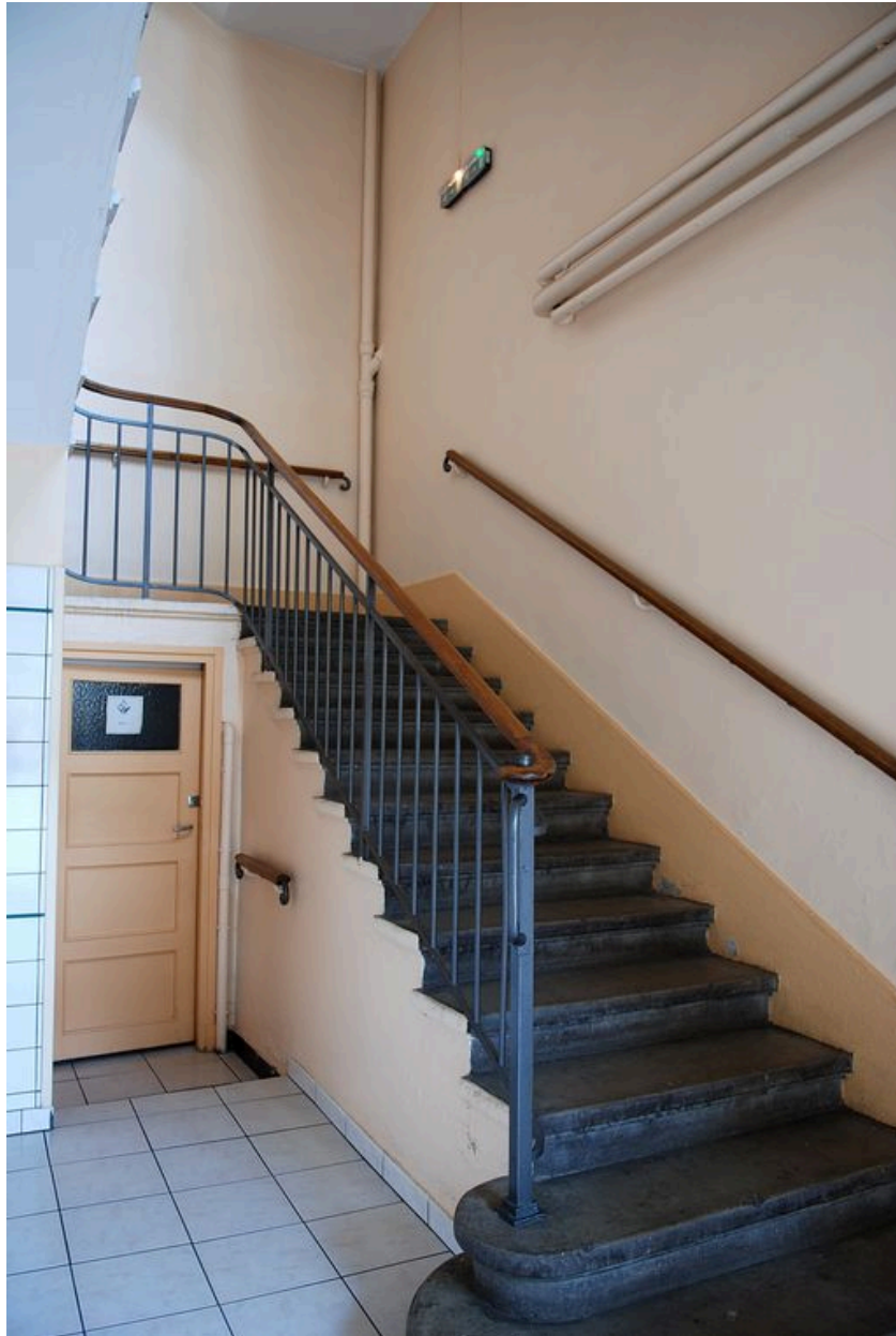
Corps de bâtiment principal : escalier sud-ouest