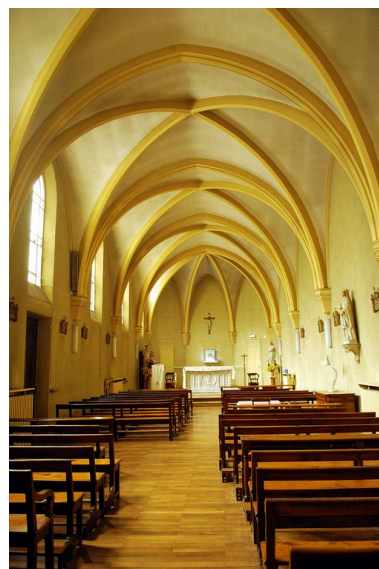
Chapelle : vue intérieure vers le chœur IVR82_20096900795NUCA