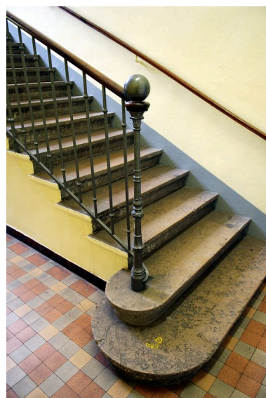
Corps de bâtiment principal : départ de l'escalier nord-est IVR82_20096900793NUCA