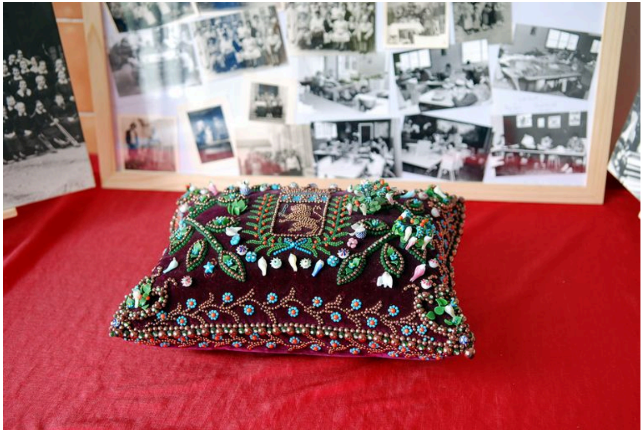
Coussin piqué d'épingles fabriquées autrefois par les résidentes