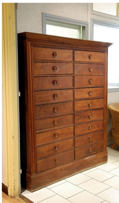
Meuble où les religieuses rangeaient leurs bobines de fil