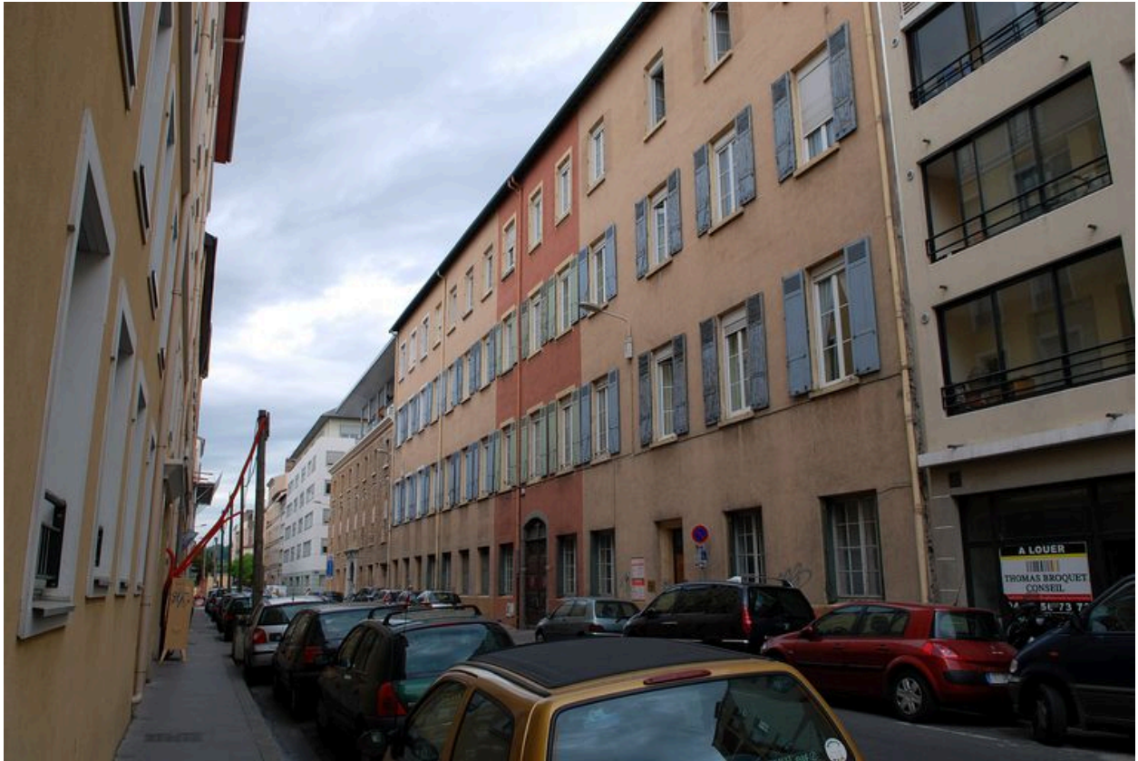
Elévation rue de la Claire : vue de situation