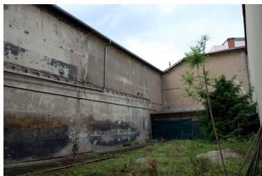
Cour fermée par la chapelle et la maison