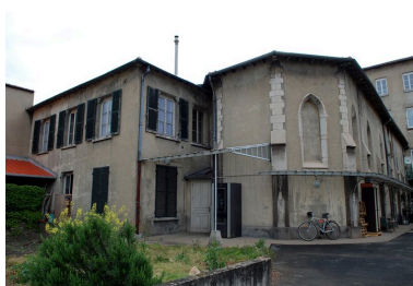
Chevet de la chapelle et maison IVR82_20096900786NUCA