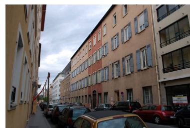
Elévation rue de la Claire : vue de situation IVR82_20096900778NUCA