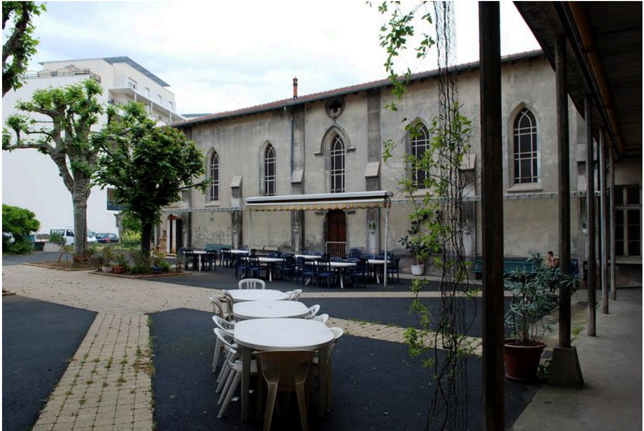
Chapelle : élévation latérale