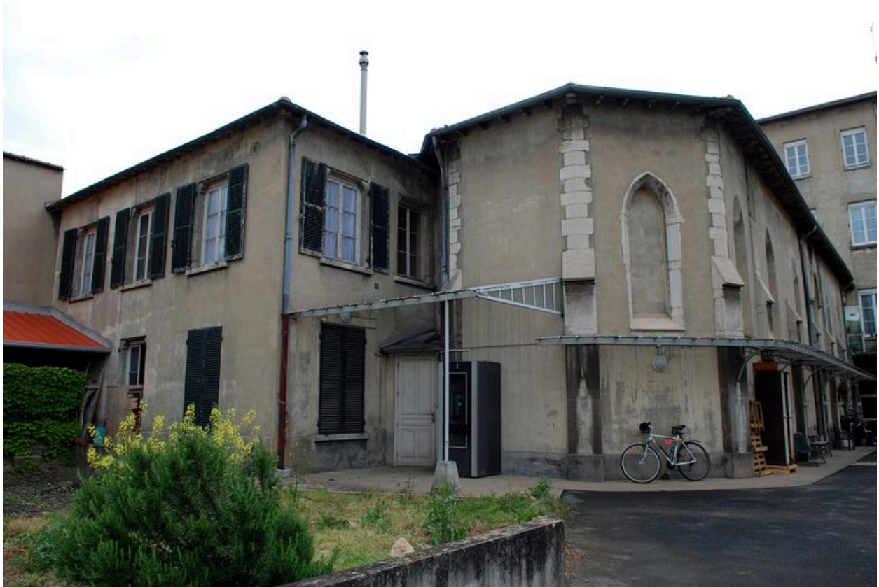
Chevet de la chapelle et maison