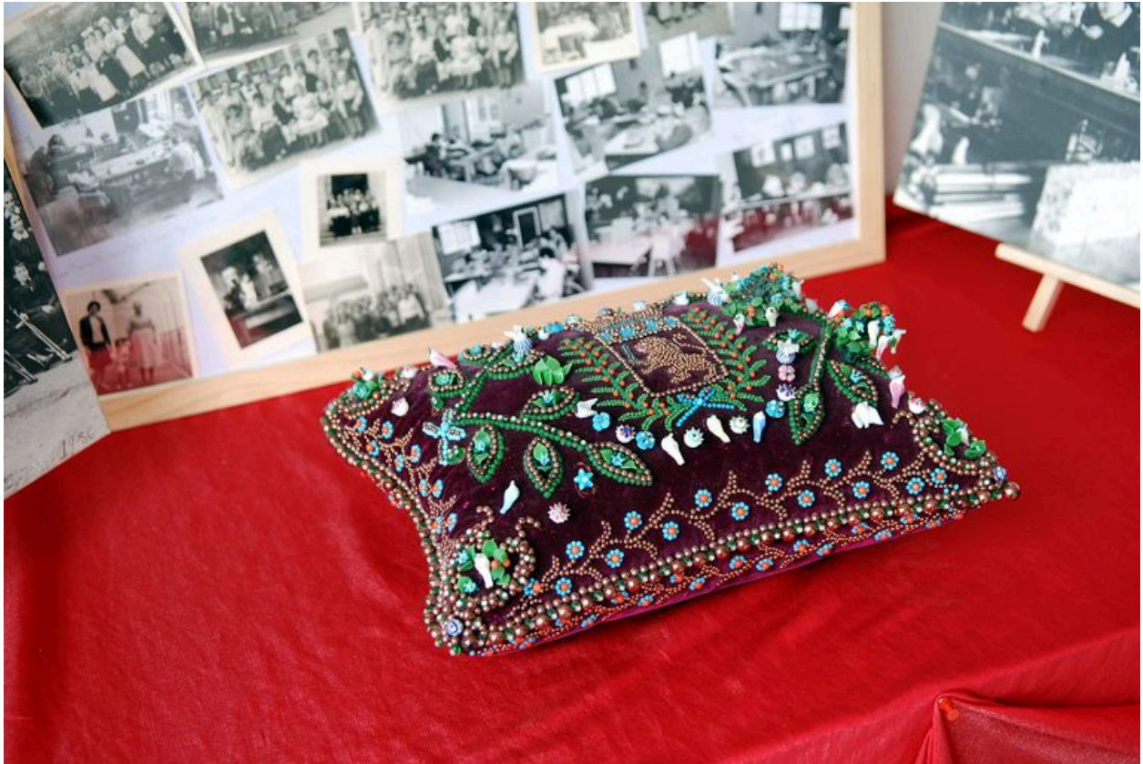
Coussin piqué d'épingles fabriquées par les résidentes