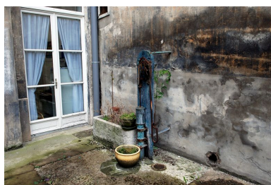
Cour fermée par la chapelle et la maison : pompe et bassin IVR82_20096900791NUCA