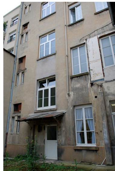
Cour fermée par la chapelle et la maison : façade postérieure du bâtiment principal