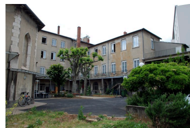
Elévations sur cour vers le sud IVR82_20096900781NUCA