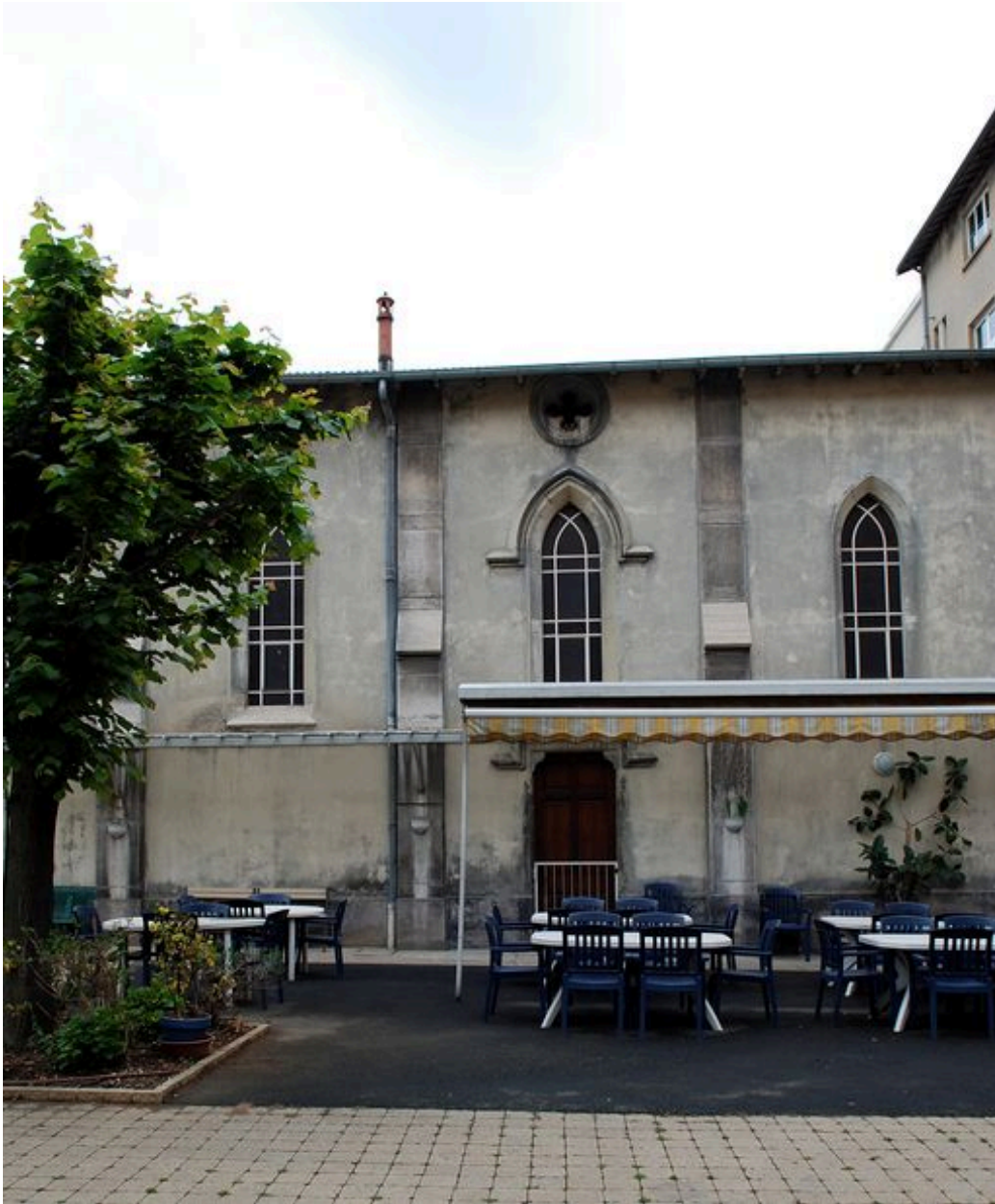
Chapelle : élévation latérale, détail d'une travée