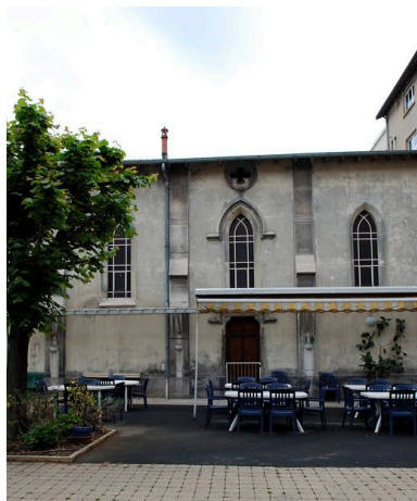
Chapelle : élévation latérale, détail d'une travée IVR82_20096900788NUCA