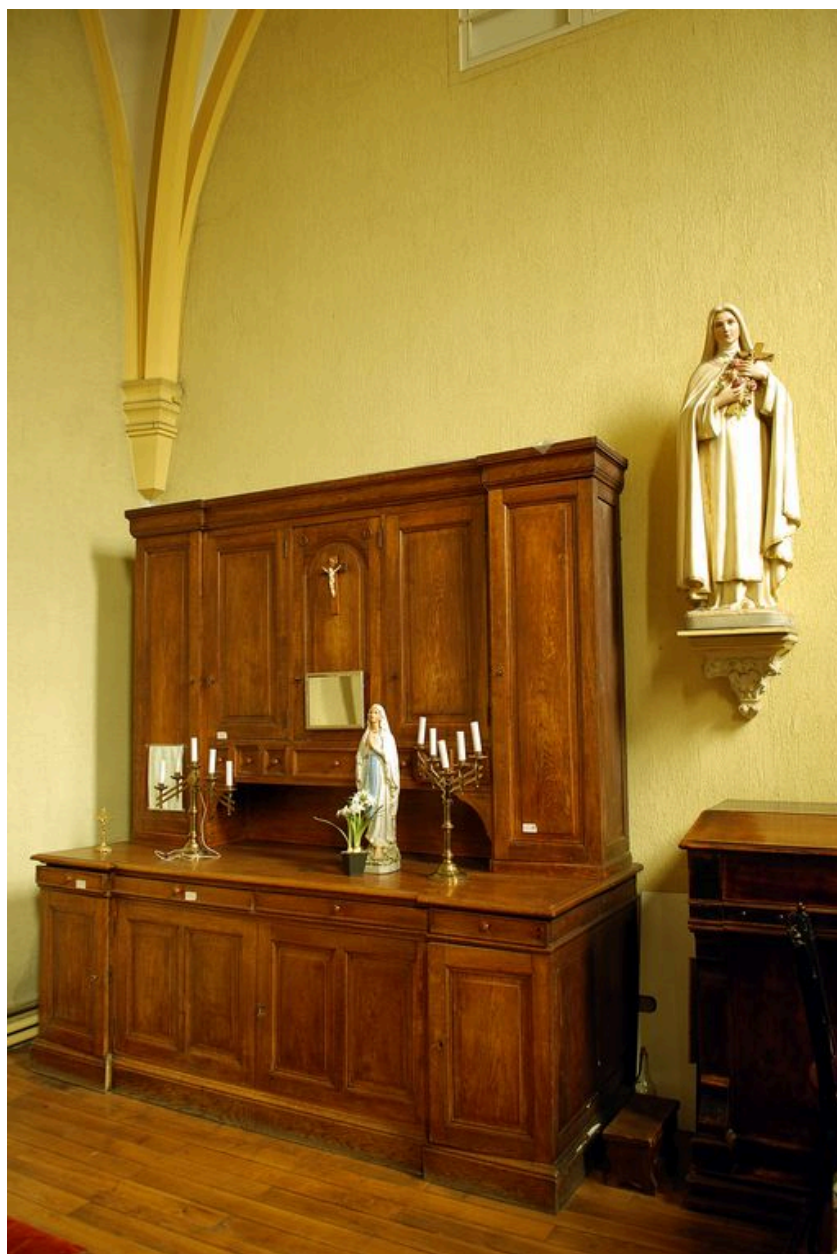
Chapelle : meuble de sacristie