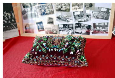
Coussin piqué d'épingles fabriquées autrefois par les résidentes