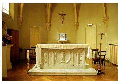
Chapelle : l'autel et, derrière, le tabernacle dont la porte est ornée d'un pélican symbolique IVR82_20096900797NUCA