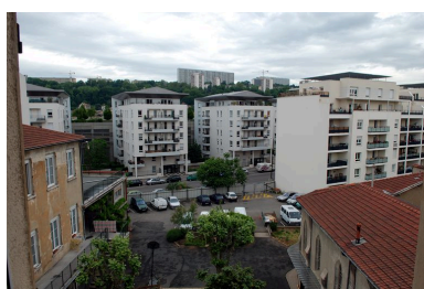
Le jardin et la rue du 24-Mars-1852 depuis le corps de bâtiment principal