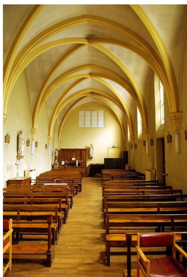
Chapelle : vue intérieure vers la nef