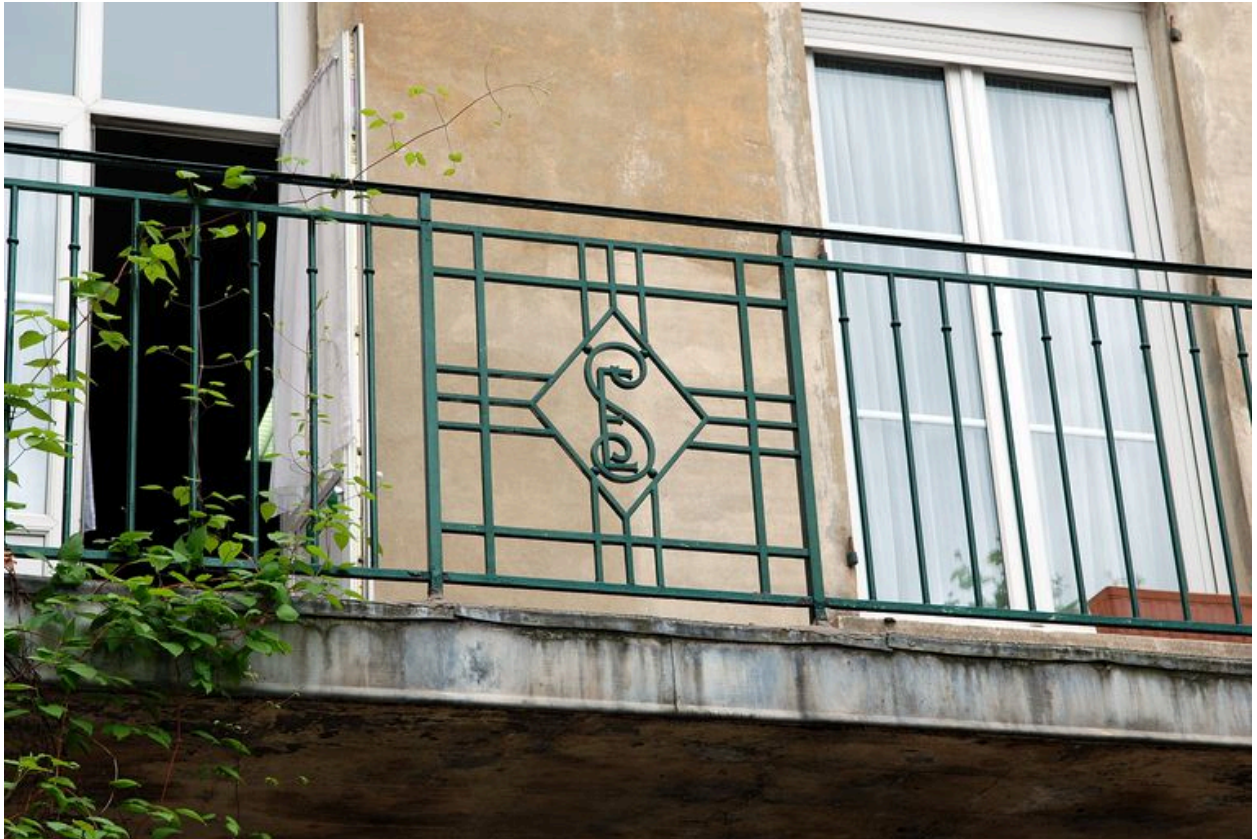
Corps de bâtiment perpendiculaire à la rue de la Claire : détail du monogramme SE