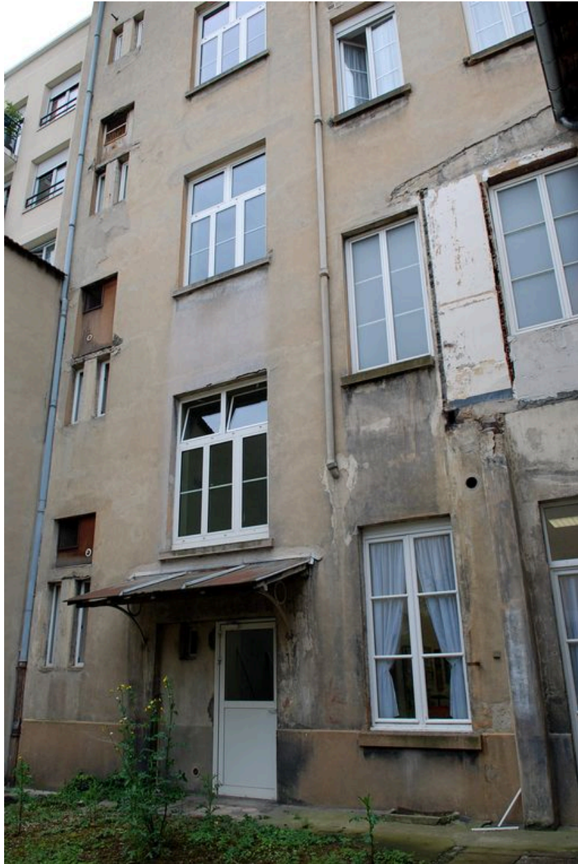
Cour fermée par la chapelle et la maison : façade postérieure du bâtiment principal