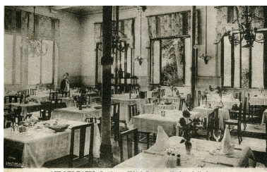
La salle à manger IVR82_20097301008NUCB