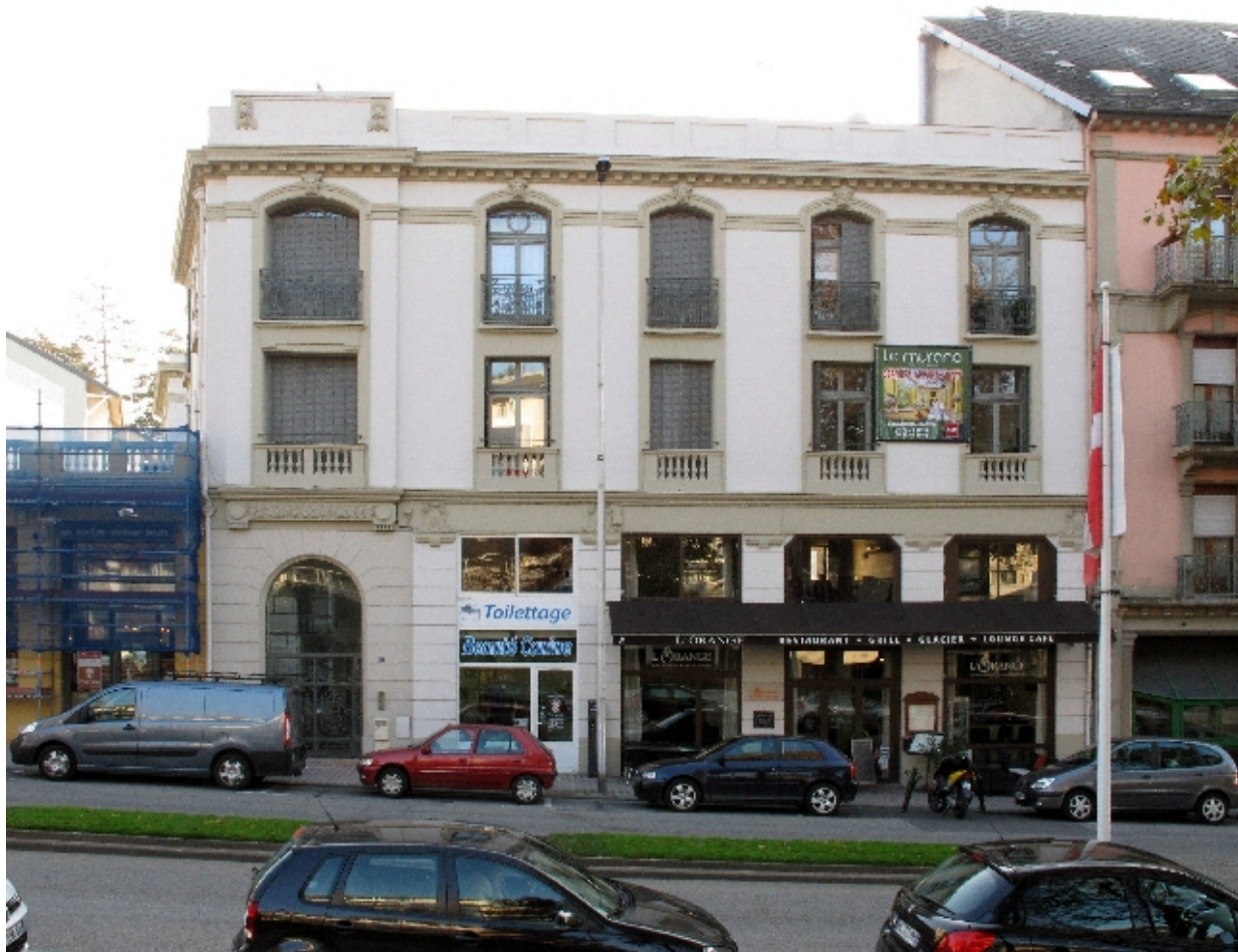
Façade principale de l'ancien hôtel