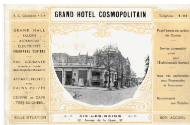
Publicité IVR82_20097301009NUCB