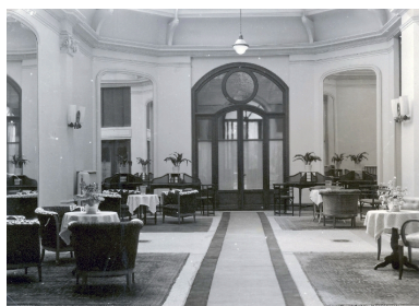
Le hall d'entrée au milieu du XXe siècle IVR82_20097301004NUCB