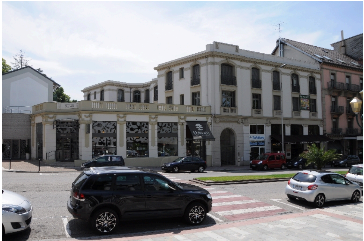
Elévations sur rue