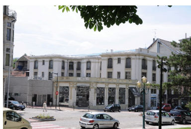
Vue générale IVR82_20127300312NUCA