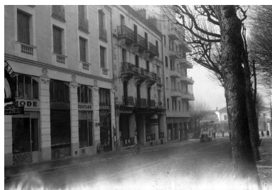
Façade sur rue depuis l'est