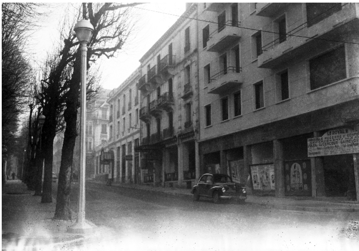
Façade sur rue depuis l'ouest