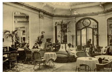
Le grand hall utilisé comme salon IVR82_20097301007NUCB