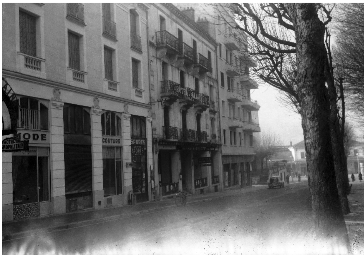
Façade sur rue depuis l'est