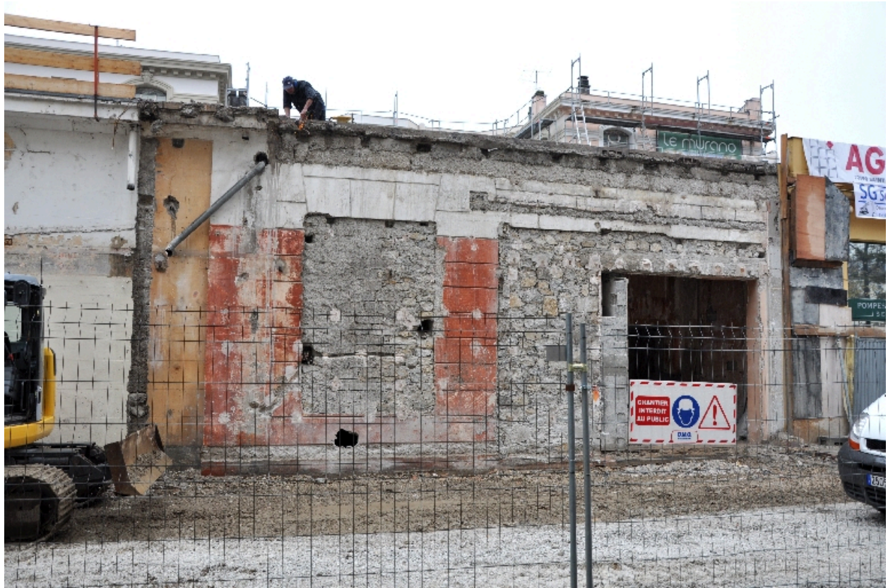
Traces des anciennes boutiques