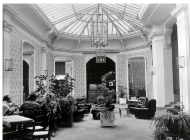
Le hall d'entrée vers 1980