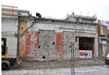
Traces des anciennes boutiques