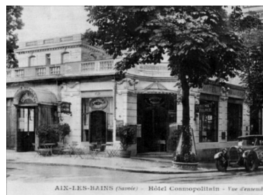
Entrée du bar et du cinéma IVR82_20097301010NUCB