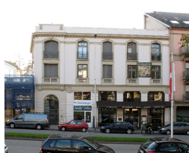
Façade principale de l'ancien hôtel IVR82_20127300313NUCA