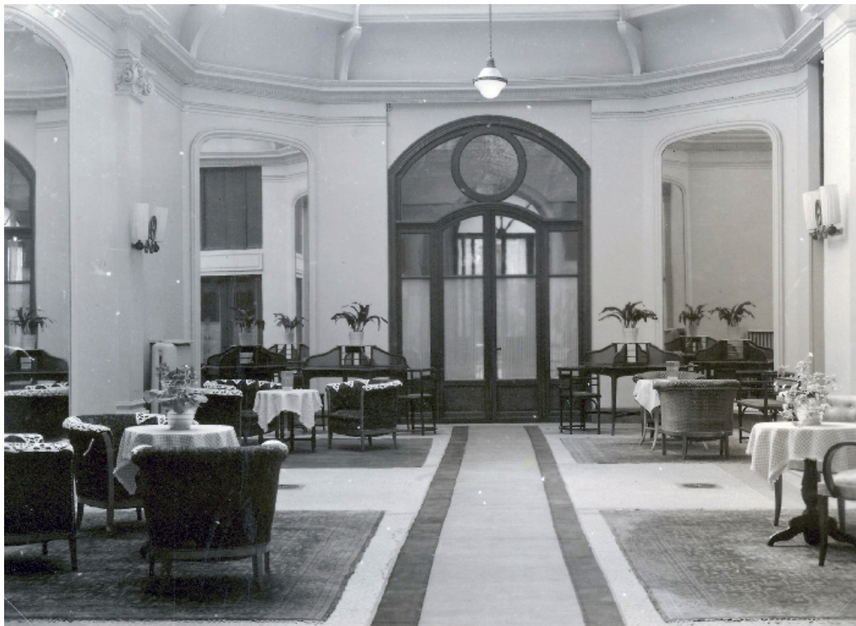
Le hall d'entrée au milieu du XXe siècle