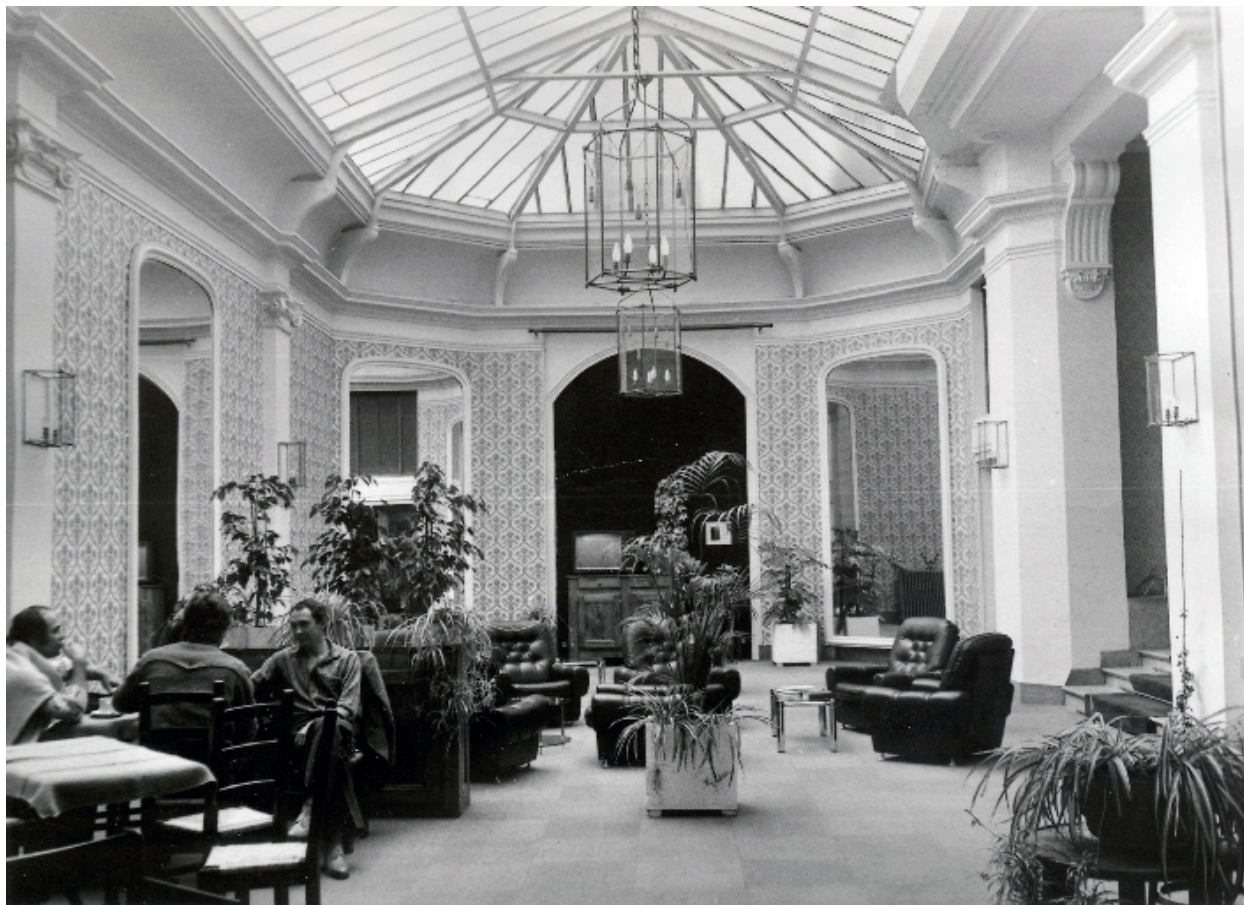
Le hall d'entrée vers 1980