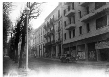
Façade sur rue depuis l'ouest IVR82_20097301005NUCB