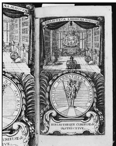
Frontispice en page de garde de l'ouvrage : Bibliothèque curieuse et instructive. IVR82_19910100613X