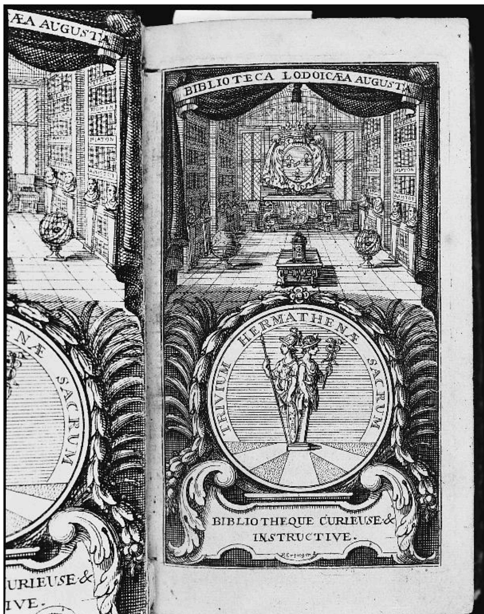
Frontispice en page de garde de l'ouvrage : Bibliothèque curieuse et instructive.