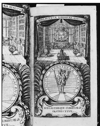
Frontispice en page de garde de l'ouvrage : Bibliothèque curieuse et instructive.