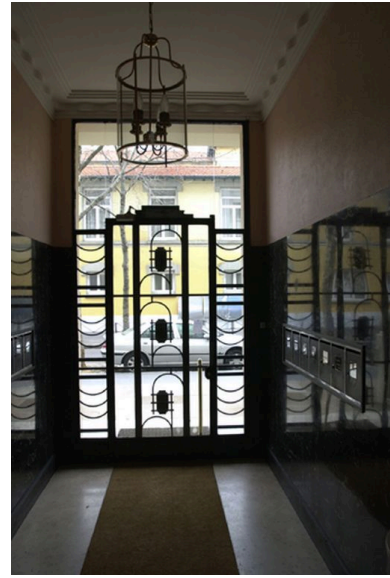
Vue de la porte d'entrée depuis l'intérieur