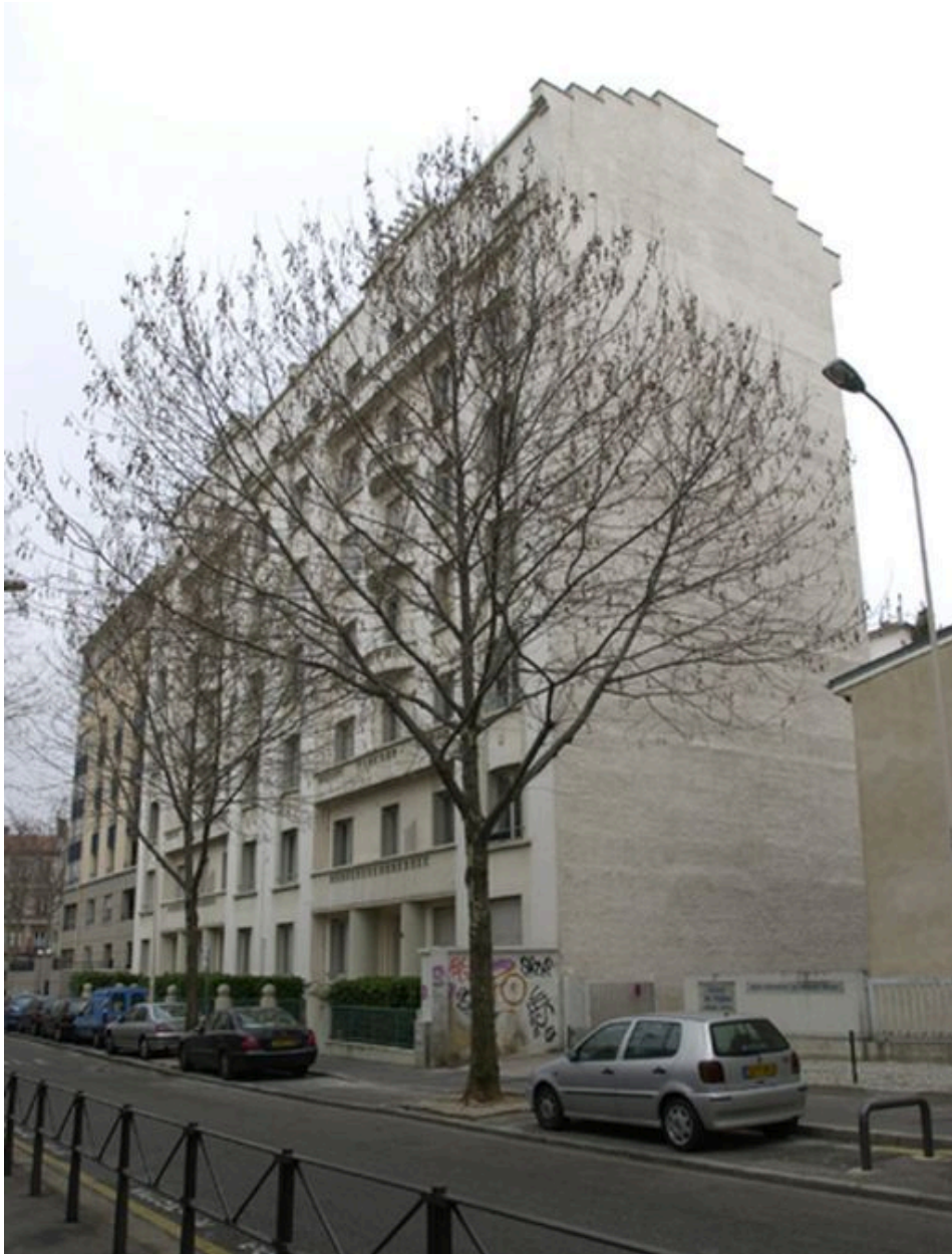
Vue générale des 2 immeubles depuis le nord