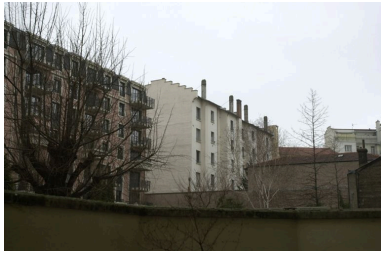
Vue de l'élévation postérieure depuis l'escalier du 3, avenue Jean-Jaurès IVR82_20046904322NUCA