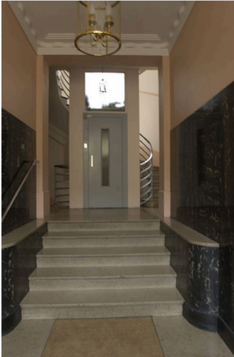
Vue du vestibule et de l'escalier depuis la porte