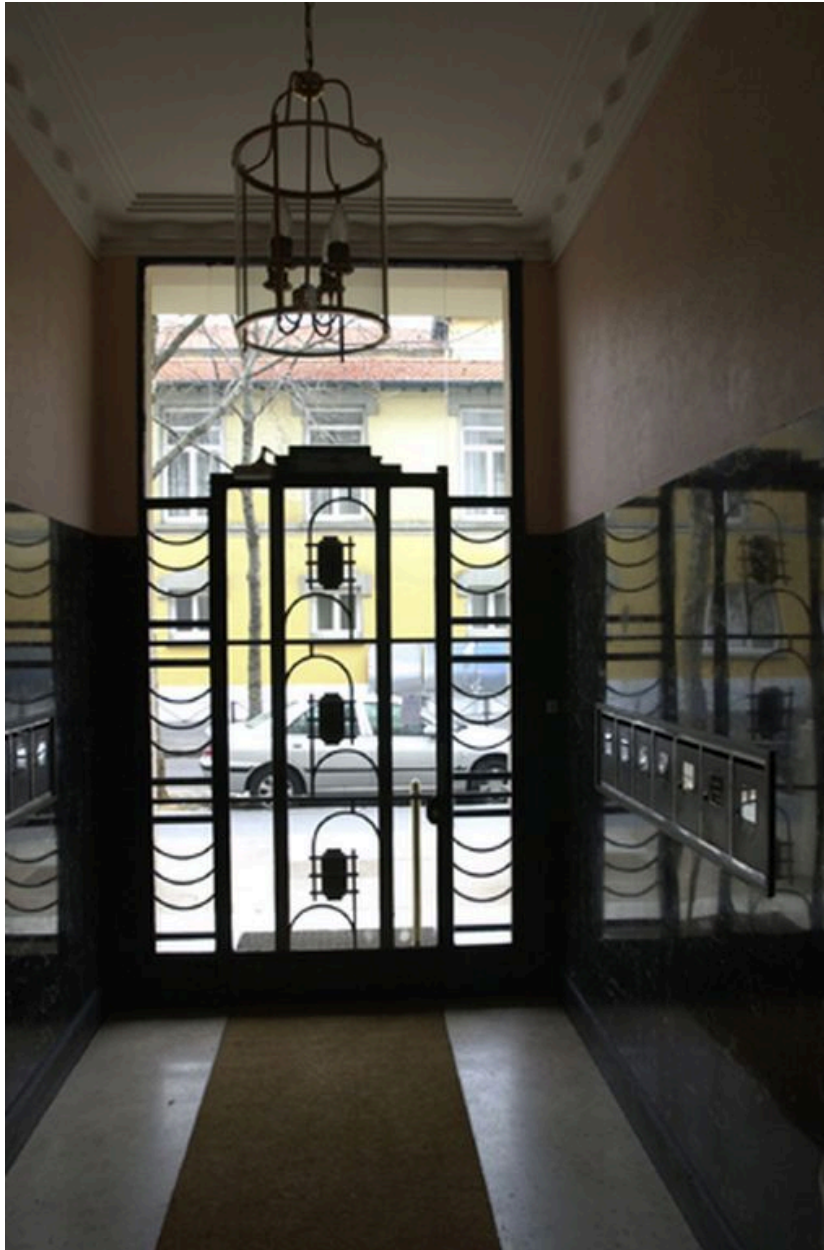
Vue de la porte d'entrée depuis l'intérieur