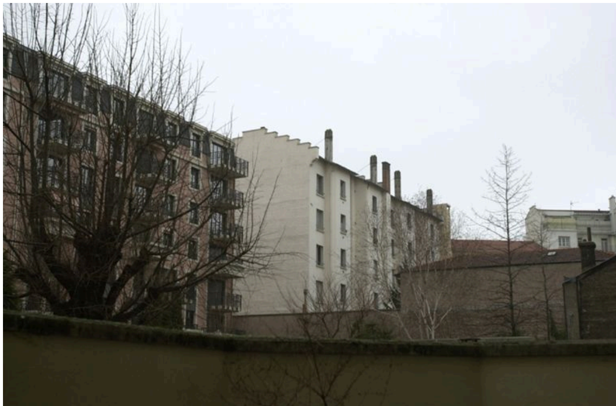
Vue de l'élévation postérieure depuis l'escalier du 3, avenue Jean-Jaurès