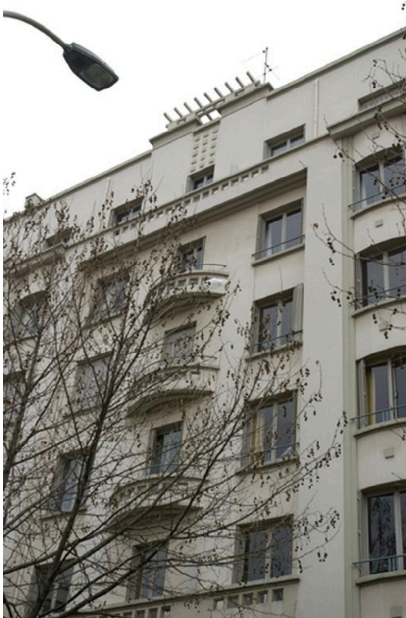
Détail de la partie supérieure de la façade du 14, rue Jean-Marie Chavant