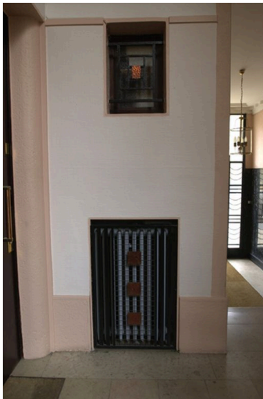
Vue du cache-radiateur et de la fenêtre des WC IVR82_20046904319NUCA