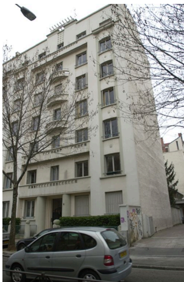
Détail du 14, rue Jean-Marie Chavant IVR82_20046904314NUCA