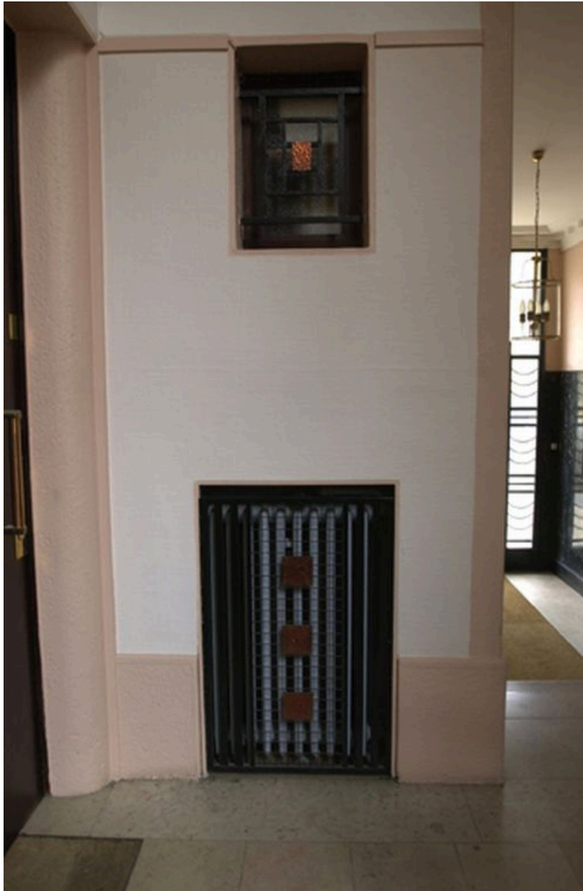
Vue du cache-radiateur et de la fenêtre des WC