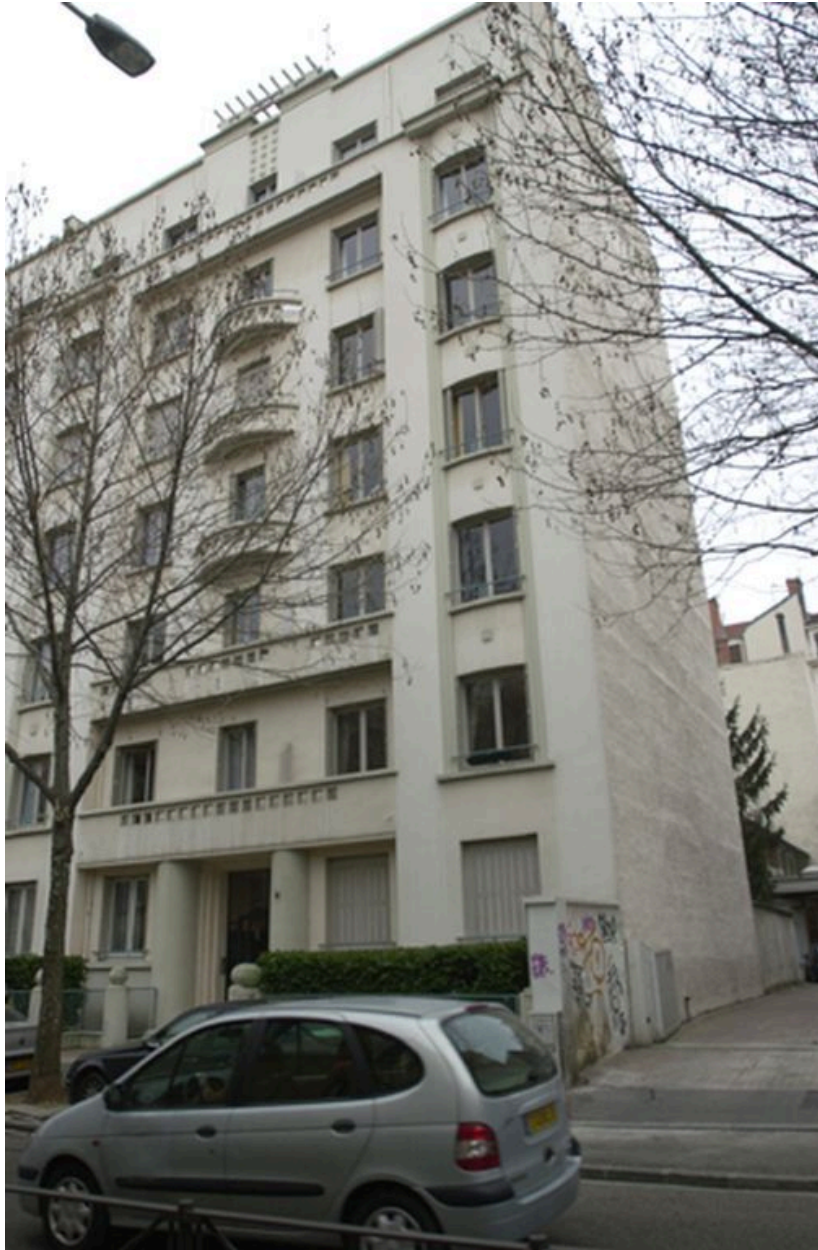
Détail du 14, rue Jean-Marie Chavant