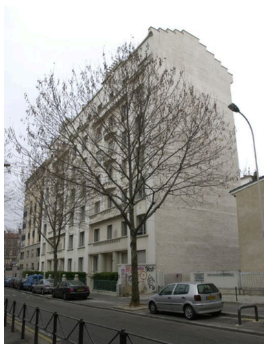
Vue générale des 2 immeubles depuis le nord IVR82_20046904313NUCA