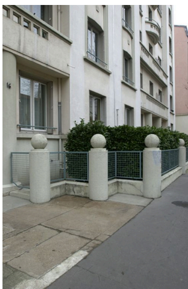
Jardin de devant IVR82_20046904320NUCA