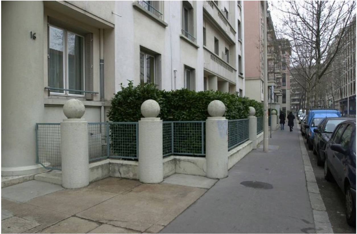
Jardin de devant en enfilade, vue sur la rue