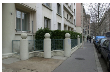
Jardin de devant en enfilade, vue sur la rue IVR82_20046904321NUCA