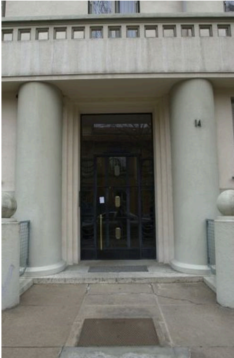
Entrée du 14, rue Jean-Marie Chavant