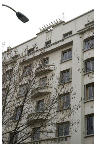
Détail de la partie supérieure de la façade du 14, rue Jean-Marie Chavant IVR82_20046904315NUCA