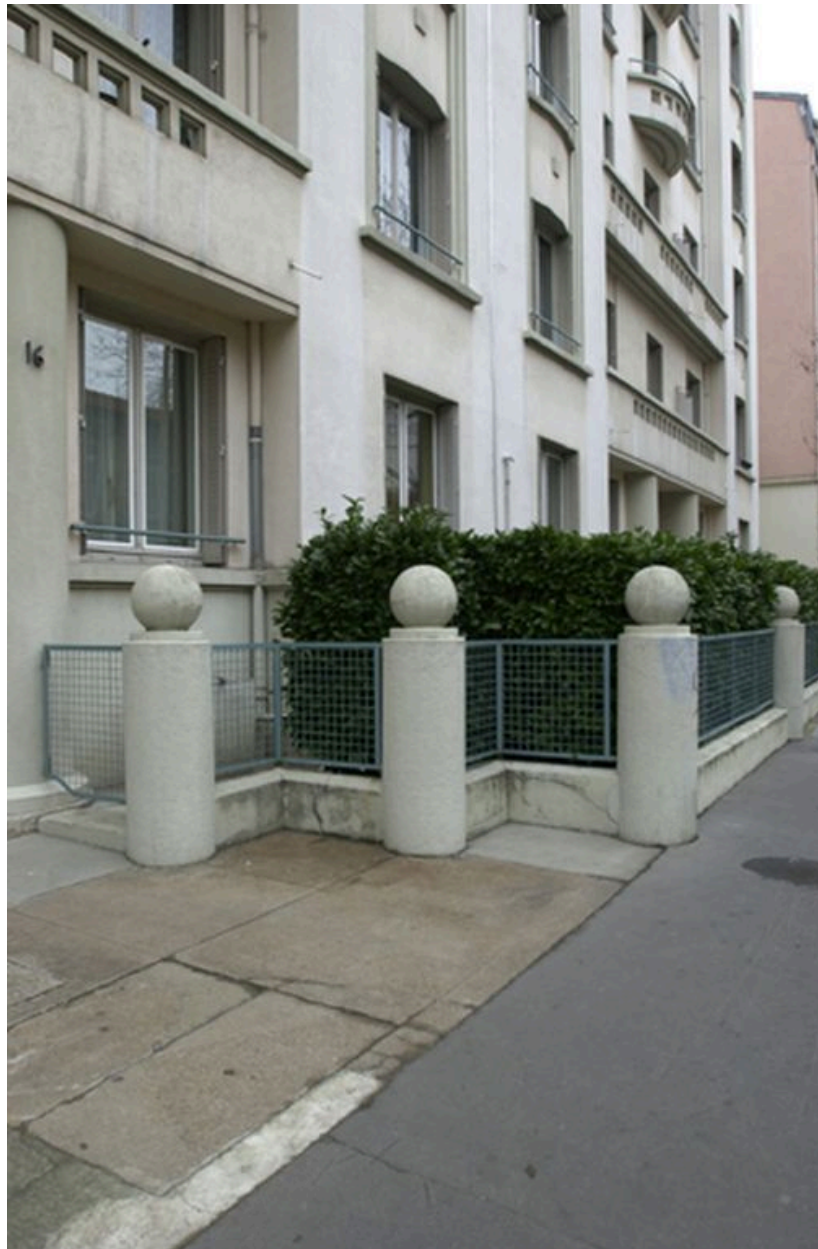
Jardin de devant