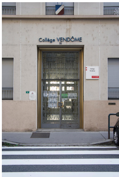
Vue d'ensemble