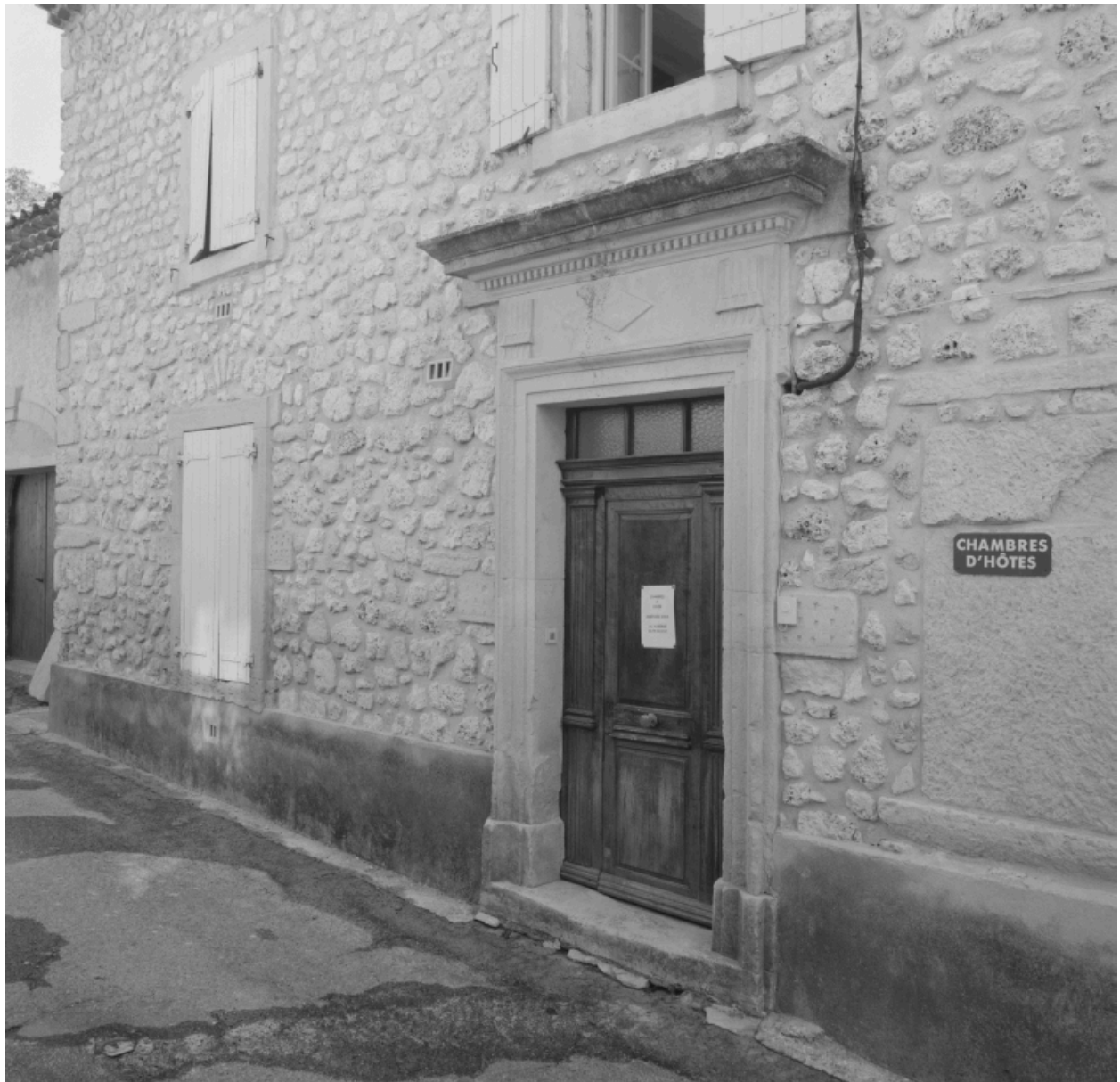
Façade, détail ; à l'extrémité, remise et dépendances.