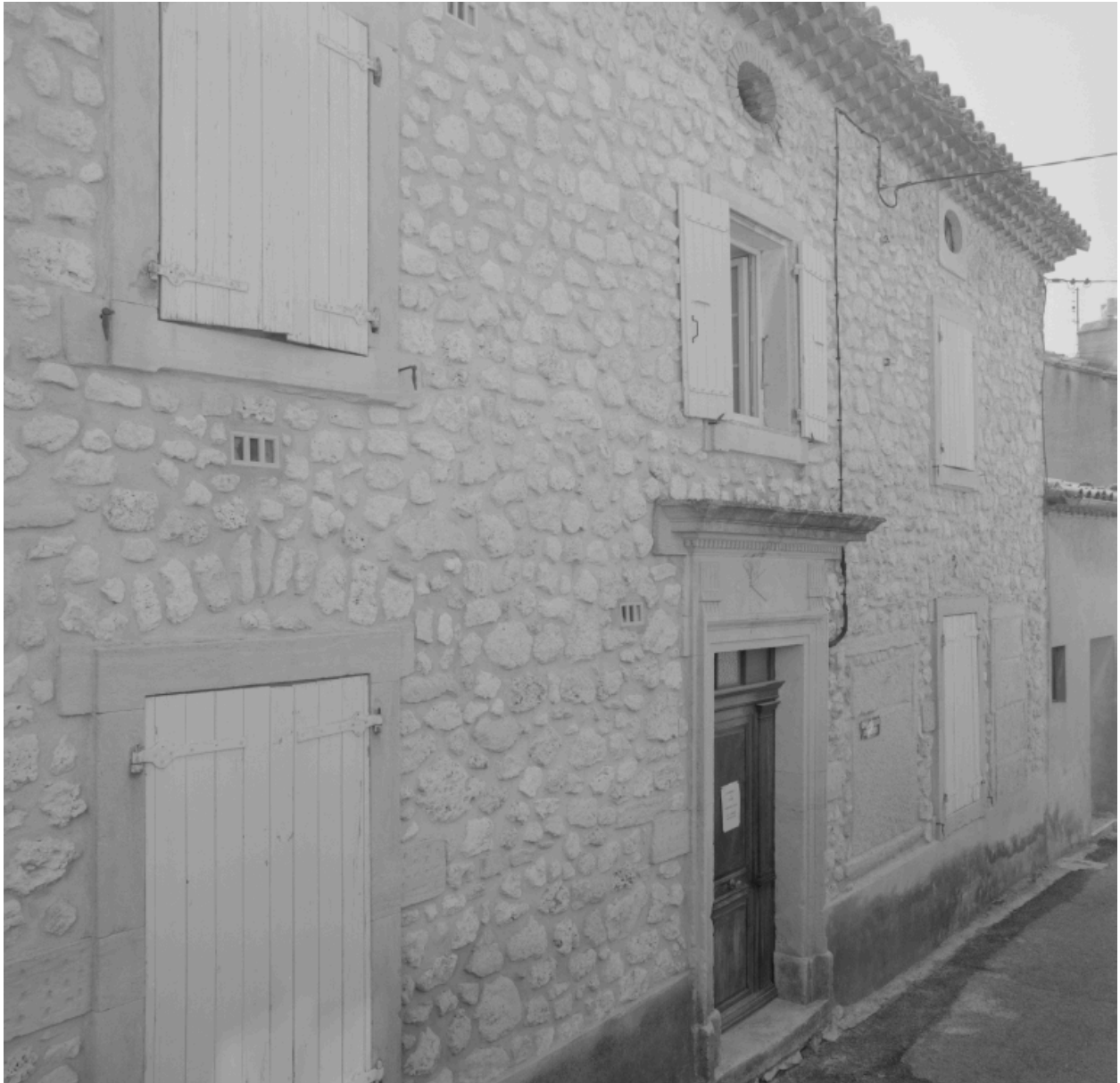
Façade sur la Grande rue, vue partielle.