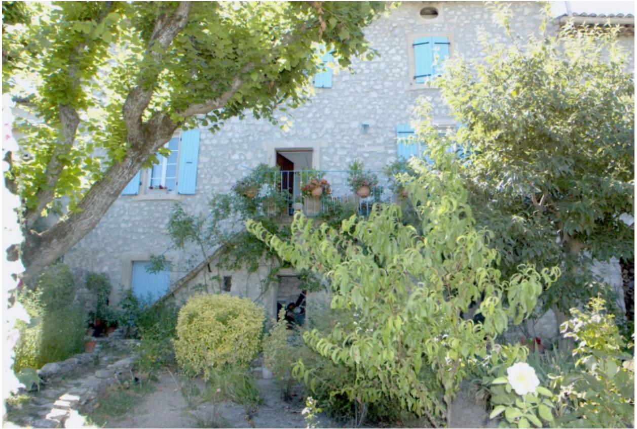
Vue partielle de l'élévation postérieure et du jardin.