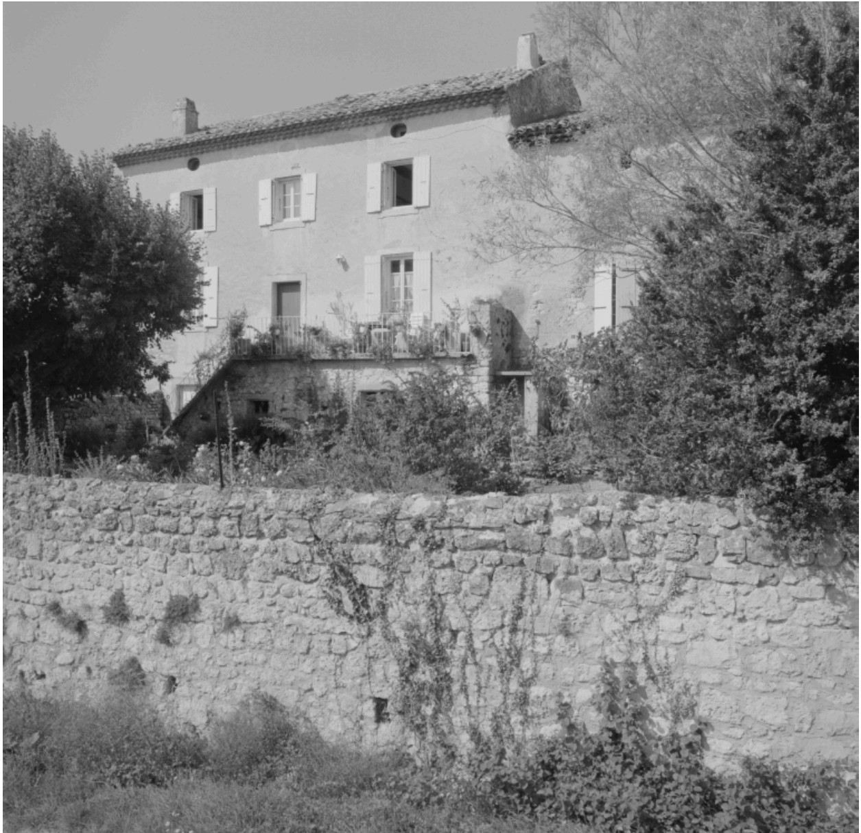
Elévation postérieure sur le jardin.