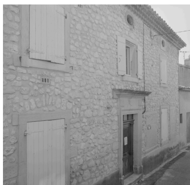
Façade sur la Grande rue, vue partielle.