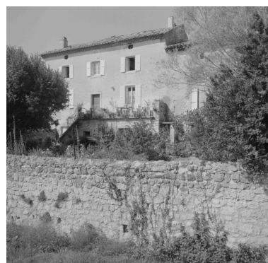
Elévation postérieure sur le jardin. IVR82_19992600446X