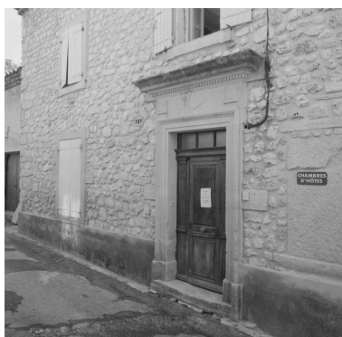
Façade, détail ; à l'extrémité, remise et dépendances.